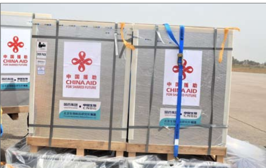
سيرا ليون استلمت نصيبها ايضا