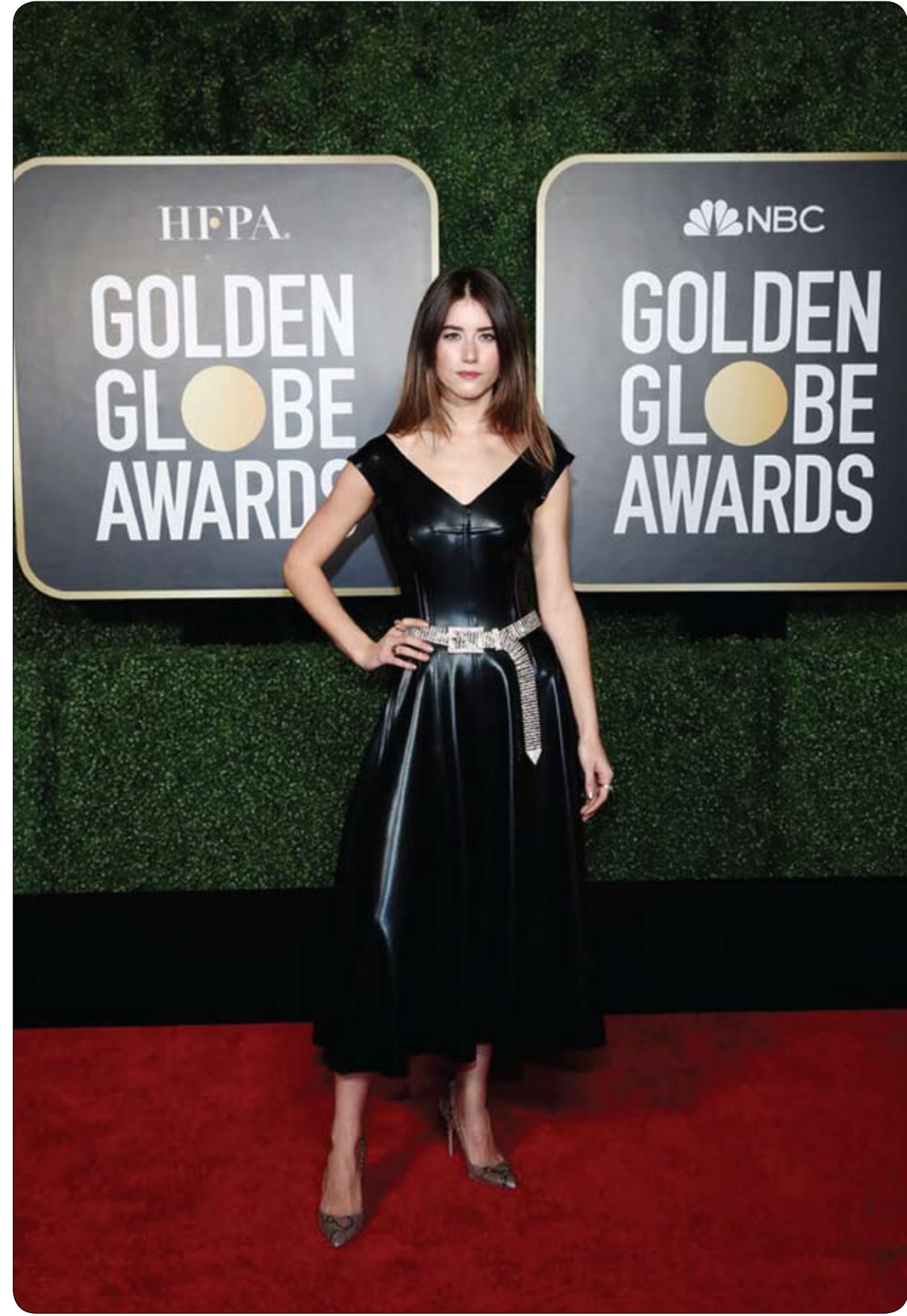
صوفيا ايضا بيترا ميلوني خلال مشاركتها في حفل توزيع جوائز غولدن غلوب السنوي 78 في نيويورك.

قال الأمير هاري مقدمة البرامج التلفزيونية الأمريكية أوبرا وينفري إنه كان قلقاً من أن يعيد التاريخ نفسه، وذلك وفقاً لمقابلة مع مقابلة مع وينفري نشرت يوم أمس الأول الأحد. وكان هاري وزوجته ميغان قد أصابا بريطانيا بصدمة عندما تم تحيا عن وشررت شبكة (سي.بي.إس) التلفزيونية مقطعين مصورين قصيرين من مقابلة وينفري مع الزوجين والتي من المقرر بثها في السابع من مارس آذار. والمقابلة التلفزيونية هي الأولى للزوجين، اللذين كانا يلقبان مع السابق بندق ودوقة ساكس، منذ أن أقاما في كاليفورنيا العام الماضي. وقال هاري "أخشى ما كنت أشاهه أن يعيد التاريخ نفسه"، في إشارة على ما يبدو إلى أمه الأميرة ديانا التي كانت تطاردها الصحافة وتوفيت عن عمر ناهز 36 عاماً في حادث سيارة في باريس بعد طلاقها من الأمير تشارلز. كان هاري (36 عاماً) يجلس بجانب ميغان (39 عاماً) ويمسك بيدها. وأعلن الزوجان هذا الشهر أنهما ينتظران طفلهما الثاني. وقال هاري "أنا مرتاح حقاً وسعيد لأنني أجلس هنا وأحدث معك ويجانبني زوجتي، لأنني لا يمكن أن أتخيل كيف كان الحال بالنسبة لها (ديانا)، وهي تمر بهذا الوضع بنفسها طوال تلك السنين". وأضاف هاري "كان الأمر صعباً للغاية لنا نحن الاثنين، لكن على الأقل فإننا معاً".