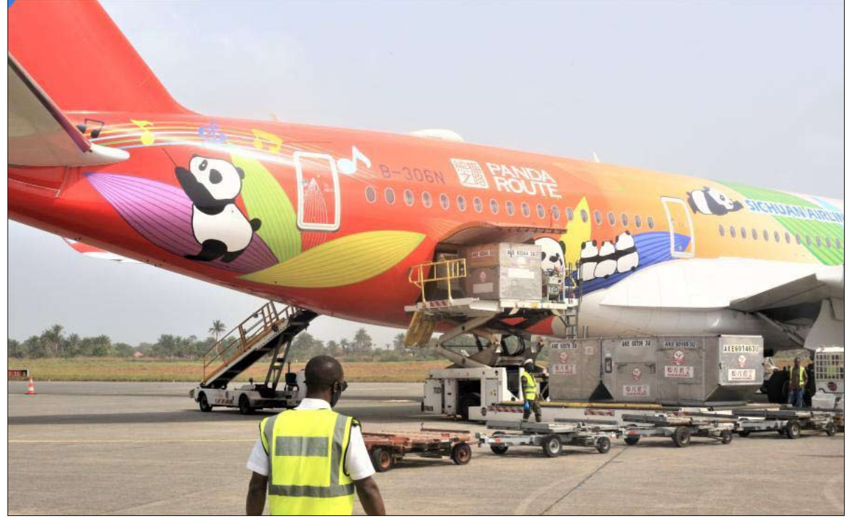
العالم النامي هو المستفيد

مرسيليا والخبير في الأمراض المعدية، والذي يعارض الواقف الرسمية، في 15 فبراير على سي نيوز: "من وجهة نظري، اللقاح الصيني منطقي أكثر، إنه لقاح أفهمه... إنه يسمح بمواجهة متغيرات فيروس كورونا بطريقة معقولة أكثر". وختم: "لو كنت قادراً على الاختيار، فهذا هو اللقاح الذي كنت سأفضله.."