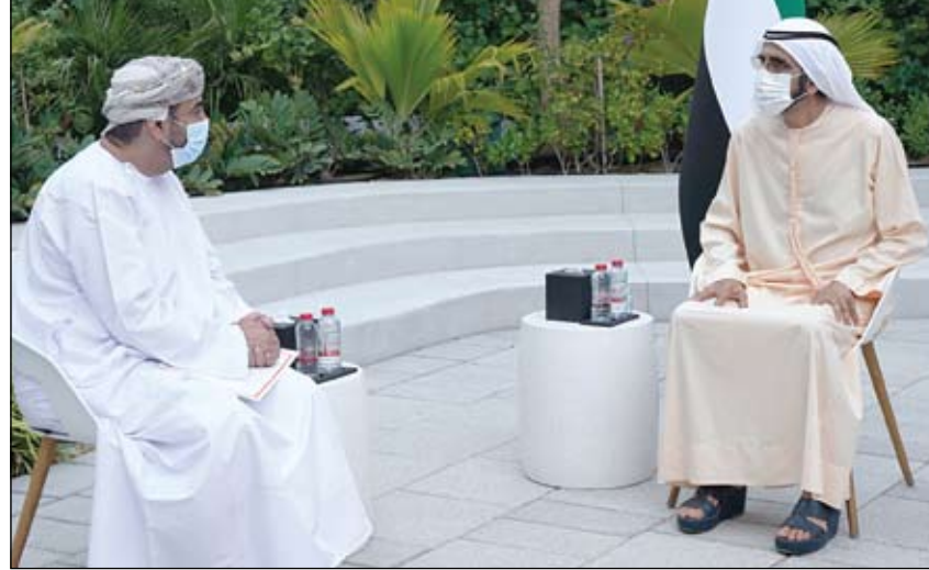
محمد بن راشد خلال استقباله سفير سلطنة عمان لدى الدولة

البرهان يطالع على المشاريع التنموية لهيئة آل مكتوم الخيرية بالسودان •• الخرطوم - وام: اطلع الفريق أول ركن عبدالفتاح البرهان رئيس مجلس السيادة الانتقالي بجمهورية السودان على الدور الكبير الذي تقوم به هيئة آل مكتوم الخيرية لدعم المشاريع التنموية في السودان. وأشاد البرهان - خلال لقائه بمكتبه وقد هيئة آل مكتوم الخيرية برئاسة سعادة ميرزا حسين الصايغ عضو مجلس الأمناء مدير مكتب سمو الشيخ حمدان بن راشد آل مكتوم نائب حاكم دبي وزير المالية راعي الهيئة - بالأعمال الخيرية التي تضطلع بها الهيئة خاصة دعمها للمشروع الزراعي بولاية نهر النيل الذي يستهدف حوالي 4500 أسرة متفعفة بالولاية ومساهماتها في بناء وتعمير المدارس بولاية الخرطوم وولايات دارفور وغرب كردفان. (التفاصيل ص8) أجرت 175.033 فحصا كشفت عن 2,526 إصابة (الصحة) تعلن شفاء 1,107 حالات جديدة من كورونا •• أبوظبي-وام: أعلنت وزارة الصحة ووقاية المجتمع عن تقديم 7.956 جرعة خلال الساعات الـ 24 الماضية وبذلك يبلغ مجموع الجرعات التي تم تقديمها حتى أمس 6.028.417 جرعة ومعدل توزيع اللقاح 60.95 جرعة لكل 100 شخص. من جهة أخرى وتماشيا مع خطة وزارة الصحة ووقاية المجتمع لتوسيع وزيادة نطاق الضغوطات في الدولة بهدف الاكتشاف المبكر وحصر الحالات المصابة بفيروس كورونا المستجد كوفيد - 19 والمخالطين لهم وعزلهم.. أعلنت الوزارة عن إجراء 175.033 فحصا جديدا خلال الساعات الـ 24 الماضية. (التفاصيل ص8)