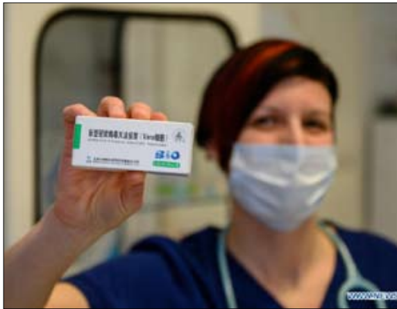
شُرعت المجر في إعطاء اللقاحات الصينية

«دبلوماسية اللقاح» لا تنتشر اللقاحات الصينية في