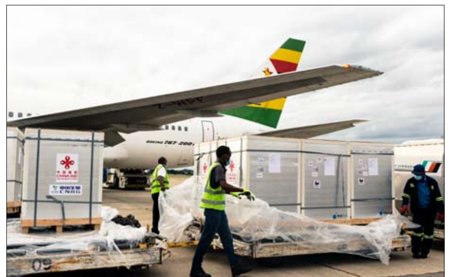
تلقي 200 ألف جرعة من اللقاح الصيني في مطار هراري، زيمبابوي