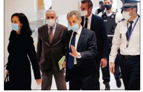
ساركوزي خلال وصوله الى مقر المحكمة في باريس

الحكم على ساركوزي بالسجن 3 سنوات •• باريس-أ ف ب: أدانت محكمة فرنسية الإثنين الرئيس الفرنسي الأسبق نيكولا ساركوزي بتهم الفساد واستغلال النفوذ وحكمت عليه بالسجن ثلاث سنوات بينها اثنتان مع وقف التنفيذ. واتهم ساركوزي بمساعدة قاض على نيل وظيفة عالية في سوناكو مقابل معلومات حول تحقيق بشأن قضايا تمويل حملته الانتخابية. لكن الرئيس الأسبق الذي حضر جلسة القضية السماة بالانتصت لن يدخل السجن لأن هذه العقوبة تطبق عادة في فرنسا للحكام التي تزيد عن سنتين. دعا المدير العام للوكالة الدولية للطاقة الذرية، إلى عدم تحويل عمليات التنشيط التي تجريها هيئته في إيران إلى ورقة مساومة، بالتزامن مع سعي عدد من الدول الأوروبية لقرار من الوكالة ضد طهران. وقال رافاييل غروسفي في مؤتمر صحفي: يجب المحافظة على عمليات التنشيط التي تجريها الوكالة الدولية للطاقة الذرية... يجب ألا توضع على طاولة المفاوضات كورقة مساومة، وفق ما ذكرت وكالة فرانس برس. يأتي ذلك في الوقت الذي تمضي فيه بريطانيا وفرنسا وأانيا قدما في خطة تدعمها الولايات المتحدة، لإصدار قرار من مجلس محافظي الوكالة الدولية للطاقة الذرية، ينتقد إيران لتقليصها تعاونها مع الوكالة، رغم تحذيرات روسية وإيرانية من عواقب خطيرة. ويعقد مجلس محافظي الوكالة المؤلف من 35 دولة، اجتماعه ريع السنوي هذا الأسبوع، في ظل جهود متعثرة لإحياء الاتفاق النووي المبرم بين إيران والقوى العالمية، بعدما أصبح الرئيس الأميركي جو بايدن في السلطة. وسرت إيران في الآونة الأخيرة وتيرة انتهاكاتها للاتفاق، في محاولة واضحة لزيادة الضغط على بايدن، مع إصرار كل طرف على أن يتحرك الآخر أولاً. وجاءت انتهاكات طهران للاتفاق،