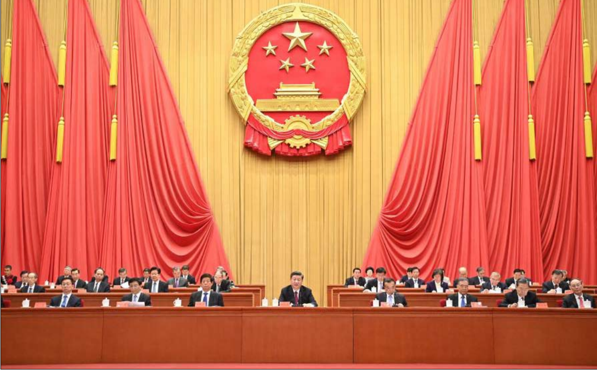
القيادة الصينية تتحدث عن منفعة عالمية