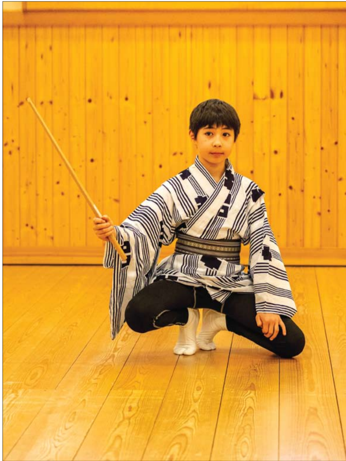
ممثّل كابوكي فرنسي ياباني يبلغ من العمر 10 سنوات في غرفة بروفة في مسرح كابوكي زا في طوكيو.