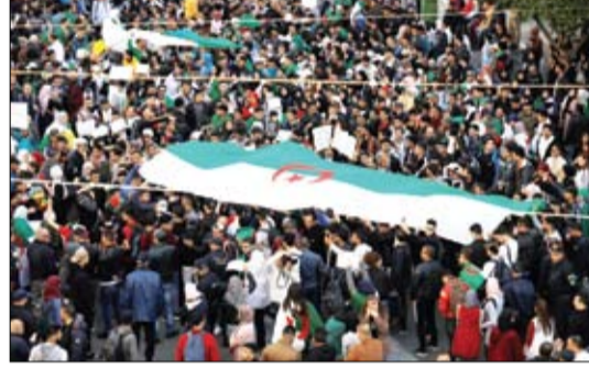
متظاهرون جزائريون يحملون علم بلادهم مطالبين بتغيير سياسي

الجزائري الأخضر، الأخضر الإبراهيمي، سيراؤم المؤتمر الوطني الجامع الذي اقترحه بوتفليقة للإشراف على المرحلة الانتقالية، وأضاف المصدر إن «المؤتمر سيضم ممثلين للمتظاهرين بالإضافة إلى شخصيات لعبت دوراً بارزاً في حرب الاستقلال التي استمرت من عام 1954 إلى عام 1962».