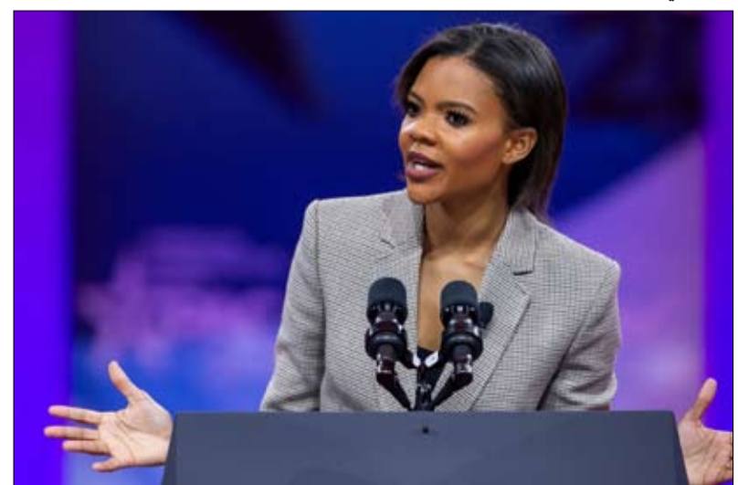
كانداس أوينز من قيادات السود تقدم اجابة