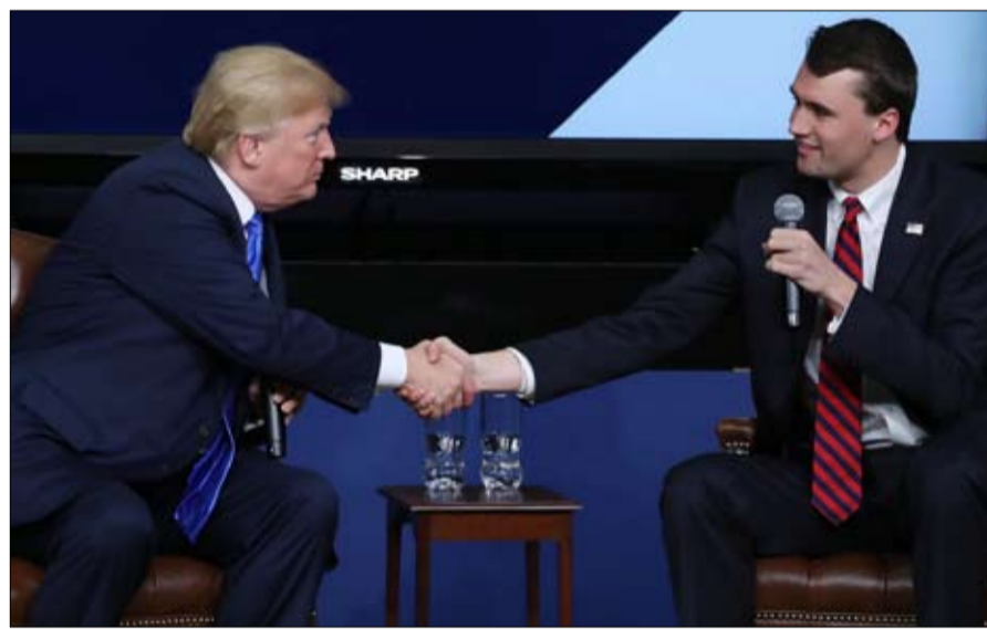
تشارلي كيرك من أبرز الفاعلين في المؤتمر

إلى الحركة المحافظة. ففي ممرات مؤتمر العمل السياسي المحافظ 2019، مغنية البوب الأفرود-أمريكي جوي فيلا، ترتدي سترة موسومة "ترامب"، تضاعف عدد صور السلفي والحوارات. فألى جانب عدد من الشخصيات الأخرى قدمت التضود على استاغرام، تقترح على أتباعها أن مؤتمر العمل السياسي المحافظ بذات خفة وبهجة مراسم جوائز غرامي - حيث كانت تعرض منذ سنوات فساتينها واكسسواراتها "فننجل أمريكا عظيمة مرة أخرى". من الواضح أن "الحرب الثقافية" التي أثارها الناشط تشارلي كيرك ستمر عبر صناعة الترفيه. ولكن يبدو أن المعسكر المحافظ الأمريكي أمامه طريق طويلة لاستكمال تجده وتنوعه. وتظهر نتائج انتخابات التجديد التصفي، التي أجريت في أوائل نوفمبر 2018، أن الترشيحات الجمهورية في المتوسط لم تجتذب سوى 32 بالمئة من الذين تتراوح أعمارهم بين 18 و29 عاماً، و29 بالمئة فقط من الناخبين اللاتينوس، وأقل من 10 بالمئة من السود الأمريكيين - نتائج تقل عن منجز عام 2014. ومع ذلك، في نظر أنصار ترامب، يمكن أن تكون المسألة خداعاً بصرياً.. فنان جيمس، الناشط على اليوتيوب والمحافظ المتشدد، الذي حضر مؤتمر العمل السياسي المحافظ 2019، مقتنع بأن الحزب الجمهوري تتجاوزته تدريجياً الترابمية لتحل محله.