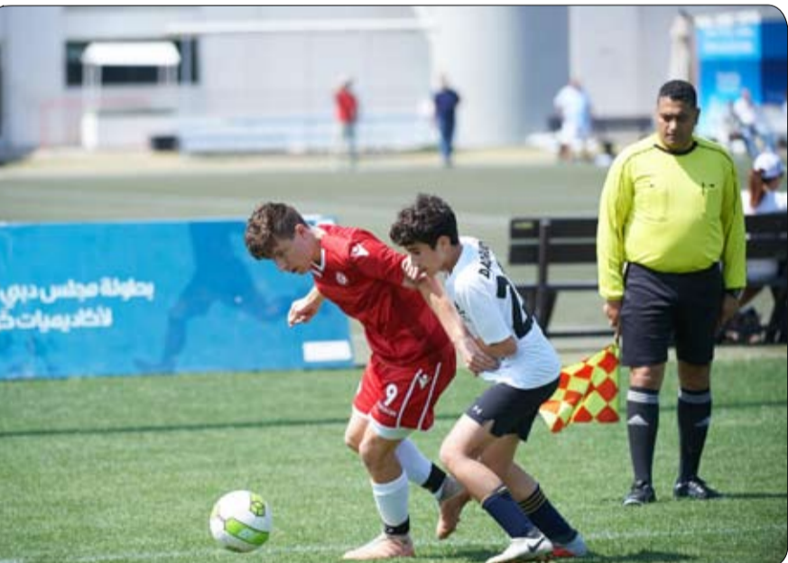
بطولة مجلس دبي للأكاديميات كرة القدم

توج فريق « دو لا ليغا » للكفاءات العالية بطلا لفئة تحت 18 سنة ضمن منافسات « بطولة مجلس دبي الرياضي أكاديميات كرة القدم » التي ينظمها المجلس وتقام منافساتها يوم السبت من كل أسبوع في ملاعب نادي الوصل ونادي شباب الأهلي دبي ومدينة دبي الرياضية لمدة 18 أسبوعا. وفاز فريق دو لا ليغا بهذا اللقب بعد أن تصدر الفريق جدول ترتيب الفرق بسجل خال من الهزائم برصيد 33 نقطة وبفارق 5 نقاط عن الوصيف. وشهدت منافسات تحت 16 عاما تعادلا نادي الوصل بنتيجة 2-2 مع فريق « جو برو » بينما حقق « دو لا ليغا » للكفاءات العالية الفوز بسباحة نظيفة ليستمر في صدارة فئة تحت 16 سنة ونجحت المدرسة الإسبانية « إنيسستا » في الفوز على « فوكسس » بنتيجة 4-0 وذلك في المباريات التي أقيمت على ملاعب شباب الأهلي. أما منافسات تحت 14 سنة فقد شهدت فوز أكاديمية « برشلونة رونالدنيهو » على أكاديمية الموهوبين بنتيجة 8-0 بينما حقق الوصل فوزا كبيرا على أكاديمية « لاليجا فياريال » بنتيجة 6-1 وحققت المدرسة الإسبانية راموس الفوز بنتيجة 4-0 على أليانس. ويعلن الفائز بالبطولة من فئة تحت 18 سنة يتبقى أسبوعا واحدا لكل الفئات الأخرى .