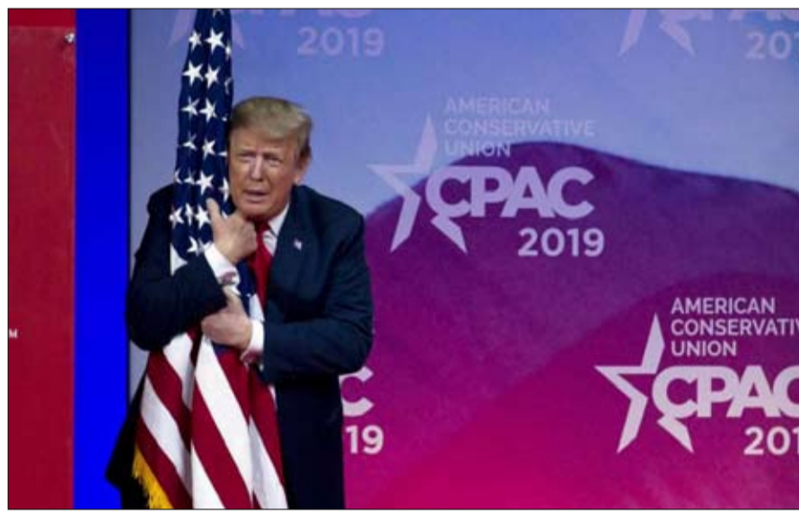
ترامب يغير تركيبة الجمهوريين المحافظين