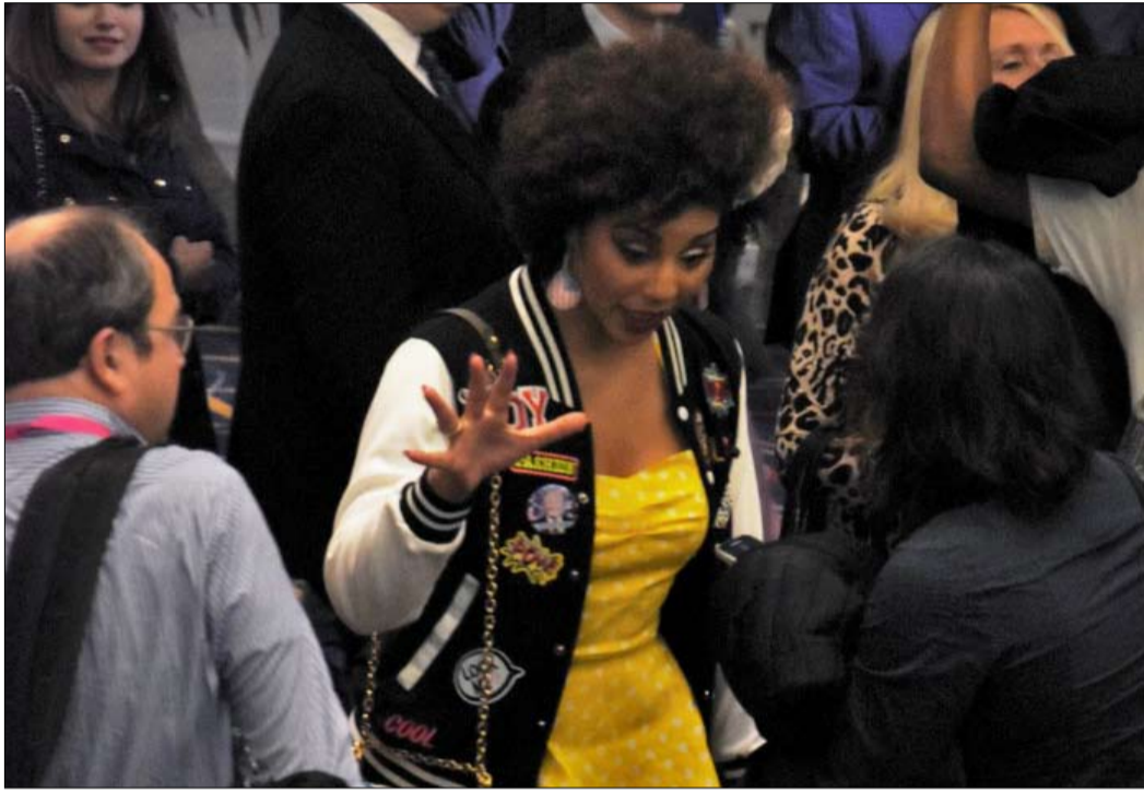
جوي فيلا، مغنية بوب شابة جاءت لتوظف خبرتها في التأثير

إلى الحركة المحافظة. ففي ممرات مؤتمر العمل السياسي المحافظ 2019، مغنية البوب الأفرود-أمريكي جوي فيلا، ترتدي سترة موسومة "ترامب"، تضاعف عدد صور السلفي والحوارات. فألى جانب عدد من الشخصيات الأخرى قدمت التضود على استاغرام، تقترح على أتباعها أن مؤتمر العمل السياسي المحافظ بذات خفة وبهجة مراسم جوائز غرامي - حيث كانت تعرض منذ سنوات فساتينها واكسسواراتها "فننجل أمريكا عظيمة مرة أخرى". من الواضح أن "الحرب الثقافية" التي أثارها الناشط تشارلي كيرك ستمر عبر صناعة الترفيه. ولكن يبدو أن المعسكر المحافظ الأمريكي أمامه طريق طويلة لاستكمال تجده وتنوعه. وتظهر نتائج انتخابات التجديد التصفي، التي أجريت في أوائل نوفمبر 2018، أن الترشيحات الجمهورية في المتوسط لم تجتذب سوى 32 بالمئة من الذين تتراوح أعمارهم بين 18 و29 عاماً، و29 بالمئة فقط من الناخبين اللاتينوس، وأقل من 10 بالمئة من السود الأمريكيين - نتائج تقل عن منجز عام 2014. ومع ذلك، في نظر أنصار ترامب، يمكن أن تكون المسألة خداعاً بصرياً.. فنان جيمس، الناشط على اليوتيوب والمحافظ المتشدد، الذي حضر مؤتمر العمل السياسي المحافظ 2019، مقتنع بأن الحزب الجمهوري تتجاوزته تدريجياً الترابمية لتحل محله.