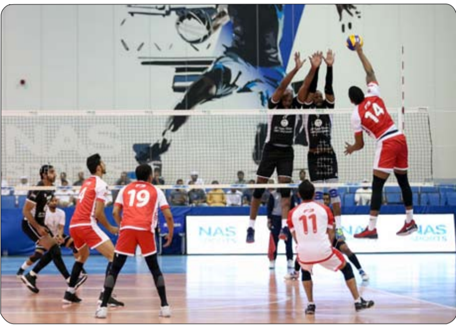
وسيتم توزيع الفرق المشاركة في مجموعات وستقوم اللجنة الفنية البطولة وإجراءاتها وشروطها في النهائيات عن طريق القرعة إلى بتعميم موعد ومكان إقامة قرعة وقت لاحق.