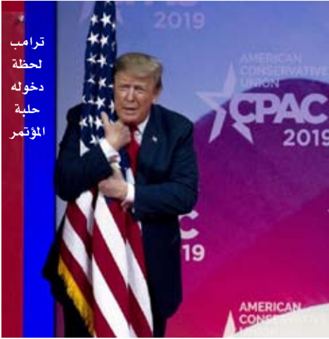
ترامب لحظة دخوله حلبة المؤتمر