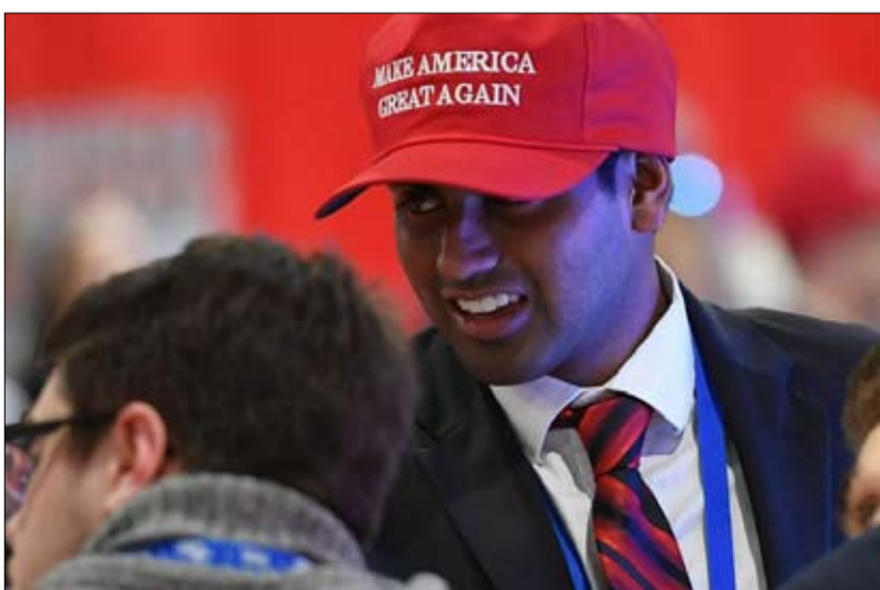
من بين من حضروا اشغال المؤتمر بالقرب من واشنطن