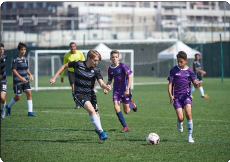
بطولة مجلس دبي للأكاديميات كرة القدم

توج فريق « دو لا ليغا » للكفاءات العالية بطلا لفئة تحت 18 سنة ضمن منافسات « بطولة مجلس دبي الرياضي أكاديميات كرة القدم » التي ينظمها المجلس وتقام منافساتها يوم السبت من كل أسبوع في ملاعب نادي الوصل ونادي شباب الأهلي دبي ومدينة دبي الرياضية لمدة 18 أسبوعا. وفاز فريق دو لا ليغا بهذا اللقب بعد أن تصدر الفريق جدول ترتيب الفرق بسجل خال من الهزائم برصيد 33 نقطة وبفارق 5 نقاط عن الوصيف. وشهدت منافسات تحت 16 عاما تعادلا نادي الوصل بنتيجة 2-2 مع فريق « جو برو » بينما حقق « دو لا ليغا » للكفاءات العالية الفوز بسباحة نظيفة ليستمر في صدارة فئة تحت 16 سنة ونجحت المدرسة الإسبانية « إنيسستا » في الفوز على « فوكسس » بنتيجة 4-0 وذلك في المباريات التي أقيمت على ملاعب شباب الأهلي. أما منافسات تحت 14 سنة فقد شهدت فوز أكاديمية « برشلونة رونالدنيهو » على أكاديمية الموهوبين بنتيجة 8-0 بينما حقق الوصل فوزا كبيرا على أكاديمية « لاليجا فياريال » بنتيجة 6-1 وحققت المدرسة الإسبانية راموس الفوز بنتيجة 4-0 على أليانس. ويعلن الفائز بالبطولة من فئة تحت 18 سنة يتبقى أسبوعا واحدا لكل الفئات الأخرى .