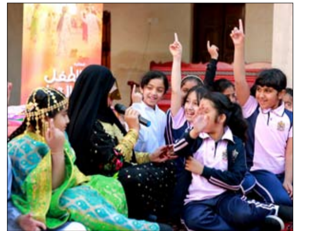
استجابة لتوجيهات «أم الامارات»