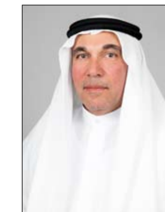
•• أبو ظبي-وام:

كما أنه تنفيذاً للمرسوم بقانون اتحادي رقم /28/ لسنة 2021 بتعديل بعض أحكام القانون الاتحادي رقم /7/ لسنة 2017 في شأن الإجراءات الضريبية التي دخل حيز التنفيذ اعتباراً من الأول من نوفمبر 2021؛ تم تطبيق إجراءات جديدة لتقديم مزيد من التسهيلات للمسجلين بالنظام الضريبي بشأن طلبات إعادة النظر، وتقديم الاعتراضات على قرارات الهيئة، وتنفيذ قرارات لجنة فض المنازعات، وإجراءات الطعن. وحول أبرز ملامح التطوير التي حققتها الهيئة، أشار البستاني إلى أن الهيئة الاتحادية للضرائب تقدم جميع خدماتها بإجراءات إلكترونية ميسرة، ومن بينها منصة الإلكترونية لرد ضريبة القيمة المضافة للمواطنين عن بناء مساكنهم المشيدة حديثاً عبر الموقع الإلكتروني للهيئة، وحرص على تطبيق إجراءات إلكترونية بسيطة لاسترداد المواطنين للضريبة المدفوعة من قبلهم عن بناء مساكنهم الجديدة تنفيذاً لرؤية القيادة الرشيدة الرامية لتطوير منظومة إسكان عصرية للمواطنين وتوفير أفضل مستويات الحياة والعيش الرغيد لهم في إطار الرعاية الكبيرة التي توليها الدولة لهم باعتبارهم محور خطط التنمية