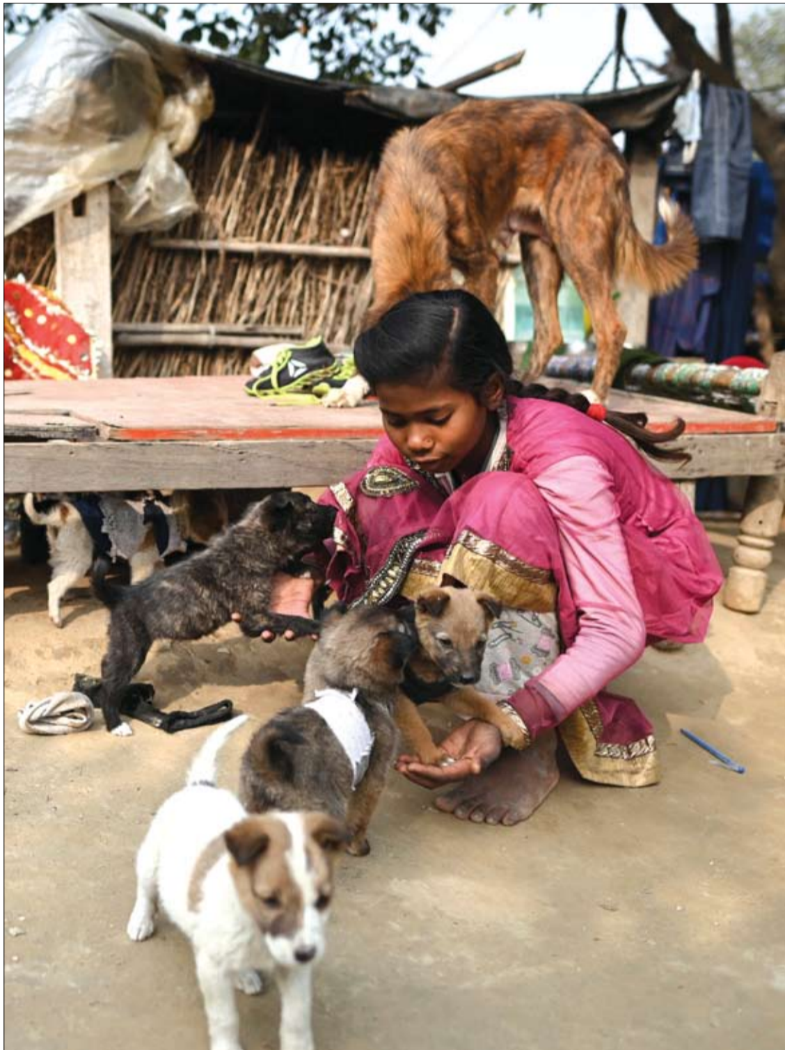
فتاة تطعم الجراء خارج منزلها على ضفاف نهر يامونا في نيودلهي ا ه ب

وحذر الباحثون: "أولئك الذين يسعون إلى تناول وجبات أصغر، خاصة الأطعمة الغنية التي يريدون تقليصها، بأن يتجنبوا التقاط صور لما يأكلونه".