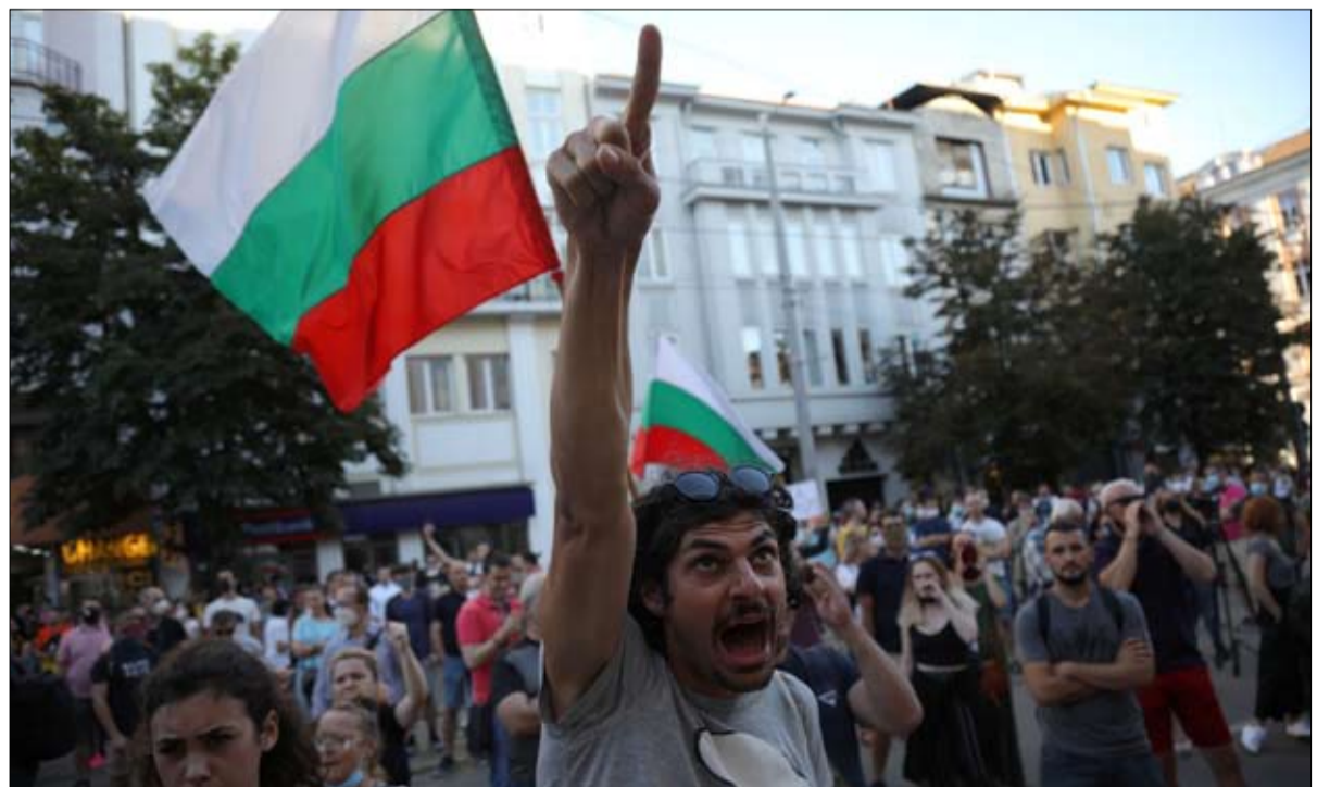
•• صوفيا-أ ف ب

•• لندن-وكالات أكد مستشار وزارة الخارجية الأمريكية للشؤون الإيرانية مايك بيل على أهمية تصديق حظر السلاح على إيران في أكتوبر (تشرين الأول) القادم، محذرا من أنه إذا لم يحدث ذلك "ستتحرك أساطيل الأسلحة الإيرانية في المنطقة دون راع". وفي مقابلة مع صحيفة "الشرق الأوسط" اللندنية، نشرتها أمس الأحد، نفي أن تكون هناك مفاوضات سرية بين الولايات المتحدة وإيران في مسقط. وحول إعلان الرئيس الإيراني حسن روحاني أكثر من مرة بأن إيران مستعدة أن تتفاوض مع الولايات المتحدة إذا اعترفت ودفعت تعويضات، قال: "أوضح الرئيس دونالد ترامب أن الإدارة مستعدة للتفاوض إنما دون شروط مسبقة. وفي السابق طالب الإيرانيون برفع العقوبات قبل المفاوضات أو إقامة علاقات. ما يقوله الإيرانيون يعكس أنهم غير جادين ولا يعبرون عن رغبة في التفاوض. وعما إذا كان يعتقد أن إيران تريد حرباً أم أنها تريد البقاء على الحافة، قال: "أعتقد أن الهدف الاعتماد على