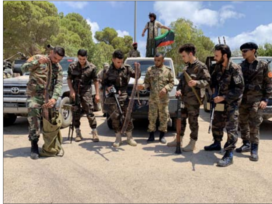
الأتراك يدركون جيدا أن الجماعة الإرهابية منبوذة شعبيا

ووفقا لصحف عربية صادرة أمس الأحد، أشارت مصادر إلى وجود صفقة لإعادة استئناف إنتاج النفط الليبي مقابل خروج تركيا، بينما تشن الحكومة التركية حملة انتقادات على دول غربية وعربية معتبرة أنها تقف وراء دعاية لتشويه صورة أردوغان.