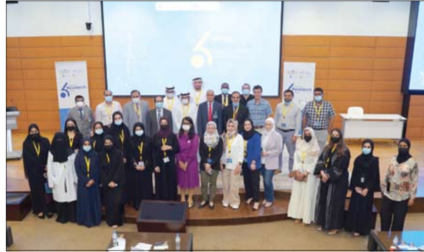
تم عقده في مدينة العين بحضور 100 خبير طبي