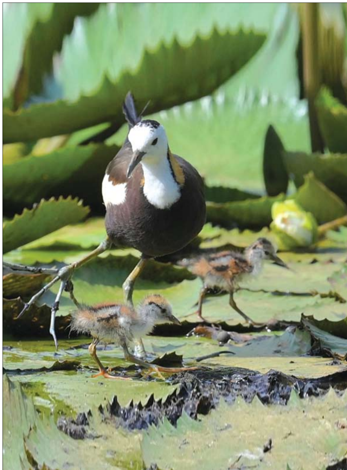
طائر جاكانا يمشي مع فراخه فوق حشائش في مزرعة في مقاطعة بيلان، شرق تايوان

وطرح الخبراء عدة تساؤلات يمكن أن تكون مهمة حول المدة التي استمرت فيها الإساءة، أو العمر الذي بدأت فيه، ومستويات الدعم العاطفي الذي يمكن أن يعتمد عليه أولئك اللاتي تعرضن لسوء المعاملة.