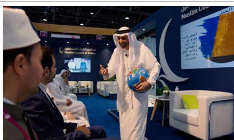
في ندوة بأبوظبي للكتاب