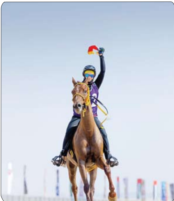
وتحول تركيزي إلى سباقات القدرة فقط اعتباراً من عام 2016، وأحرزت لقب النسخة الأولى لسباق