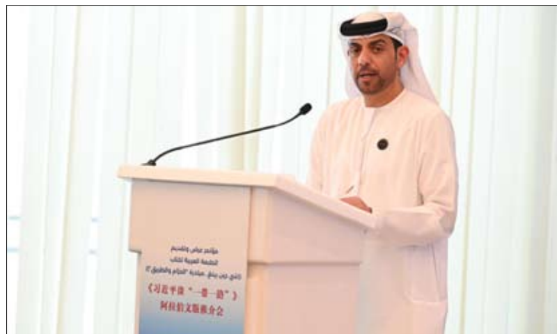
ببرنامج معرفي حافل