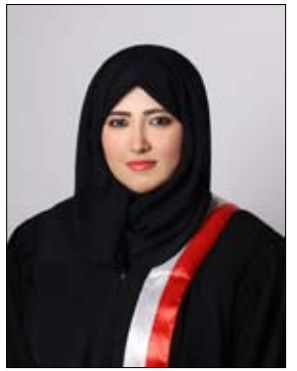
دبي - الفجر:

شاركت سعادة القاضي حمدة السويدي، قاض بالمحكمة التجارية في محاكم دبي، في المؤتمر الدولي الدائم الخامس للمحاكم التجارية، المنعقد في دولة قطر، بتنظيم منظمة سيفوك الدولية. وقد تميزت مشاركة سعادة القاضي حمدة السويدي بالفعالية والتفاعل في المناقشات والجلسات التي عقدت خلال الفعالية،