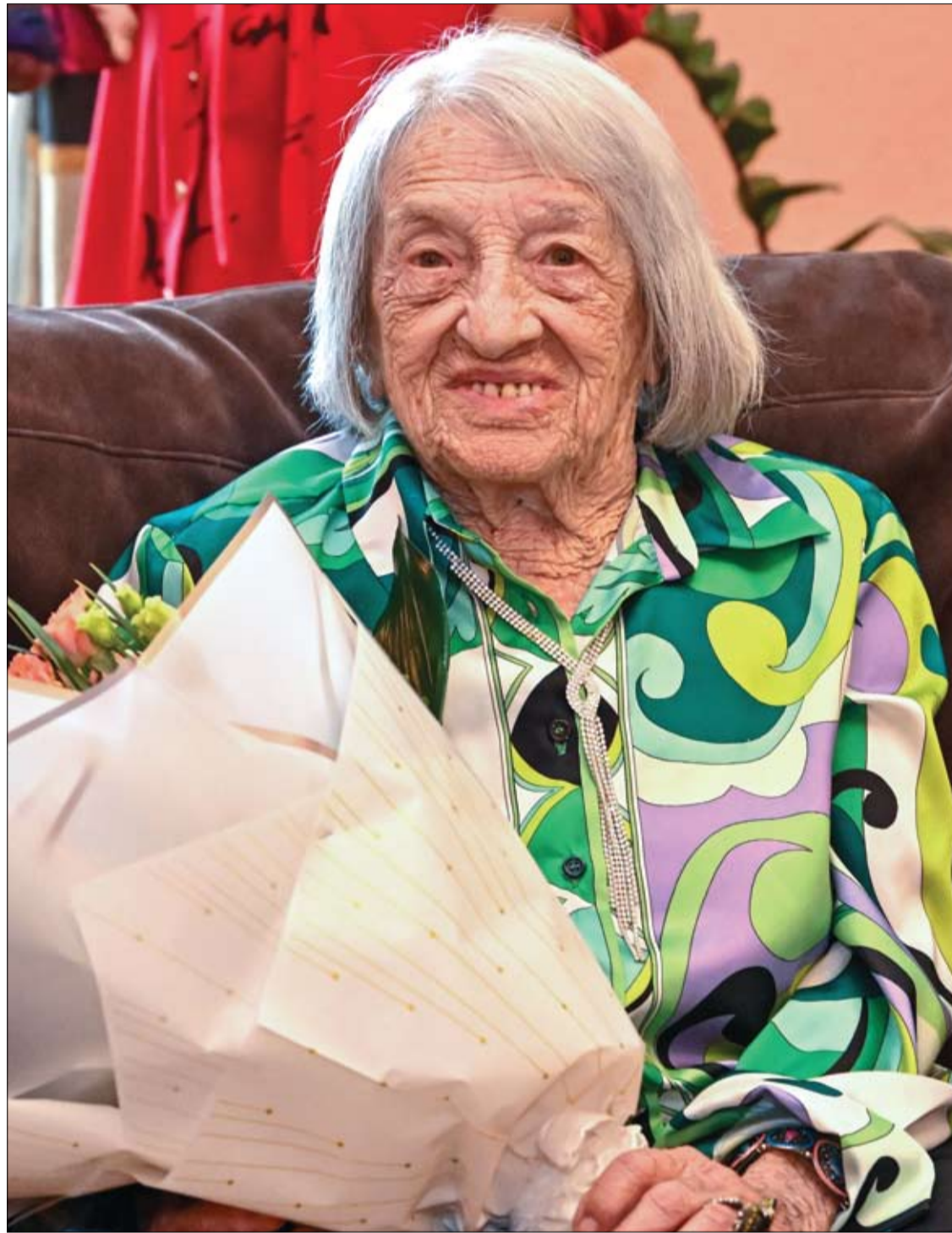
لاعبة الجمباز المجرية الإسرائيلية المتقاعدة والمدربة واحدى الناجيات من الهولوكوست أنيس كيليتي وهي تستعد للاحتفال بعيد ميلادها الـ 102 في شقتها في بودابست، المجر وتعتبر أقدم رياضي أولمبي على قيد الحياة في العالم.