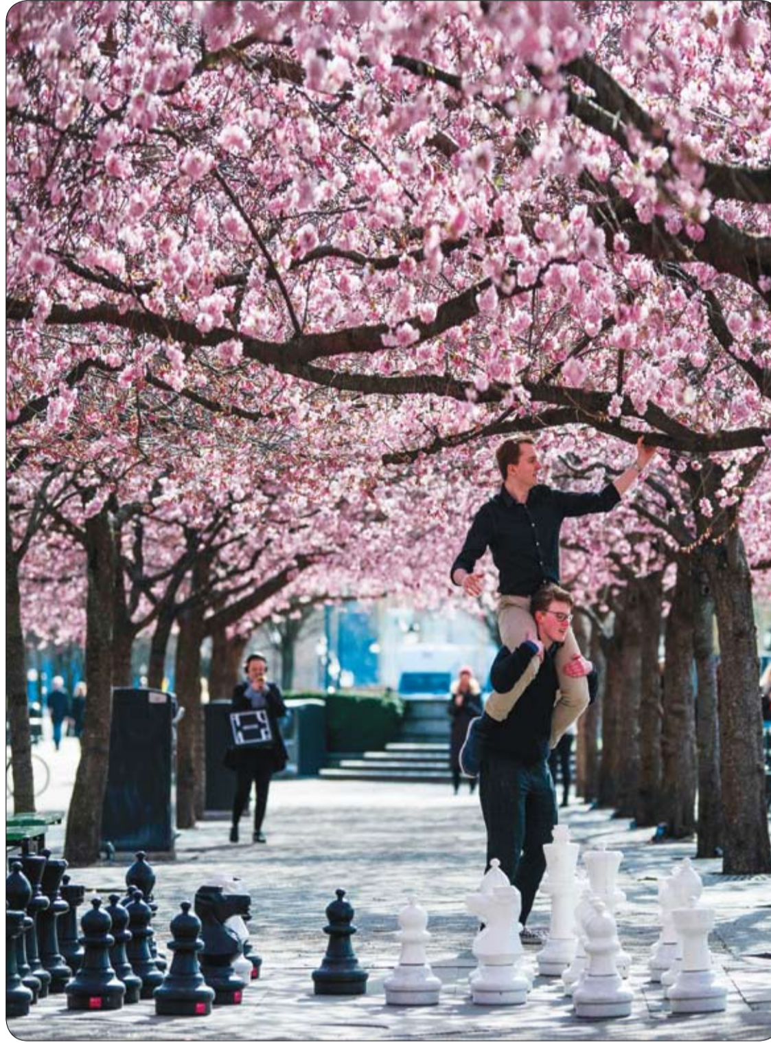
شابان يستمتعان بأزهار الكرز أمام رقعة شطرنج ضخمة في ستوكهولم، مع انتشار فيروس كورونا.