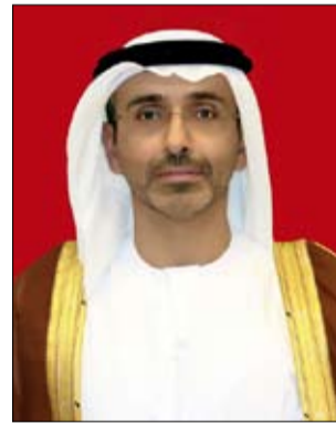
محمد بن زايد آل نهيان رئيس الدولة "حفظه الله" ، بمناسبة حلول شهر رمضان المبارك.

هنأ سمو الشيخ ذياب بن زايد آل نهيان، صاحب السمو الشيخ محمد بن زايد آل نهيان رئيس الدولة "حفظه الله" ، بمناسبة حلول شهر رمضان المبارك،