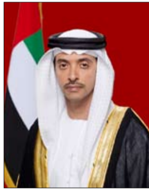
المناسبة الكريمة صاحب السمو الشيخ محمد بن راشد آل مكتوم نائب رئيس الدولة رئيس مجلس الوزراء حاكم دبي "رعاه الله" وأصحاب السمو أعضاء المجلس الأعلى لحكام الإمارات وأولياء العهود ونواب الحكام وشعب الإمارات.. سائلاً المولى عز وجل أن يعيد هذه المناسبة الفضيلة عليهم وعلى الإمارات وأهلها والعالم أجمع بالسلام والطمأنينة واليمن والبركات.

كما هنأ سموه بهذه المناسبة الكريمة صاحب السمو الشيخ محمد بن راشد آل مكتوم نائب رئيس الدولة رئيس مجلس الوزراء حاكم دبي "رعاه الله" وأصحاب السمو أعضاء المجلس الأعلى للإتحاد حكام الإمارات وأولياء العهود ونواب الحكام وشعب الإمارات.. سائلاً العلي القدير أن يعيد هذه المناسبة الفضيلة عليهم وعلى الإمارات وأهلها والعالم أجمع بالسلام والخير واليمن والبركات.