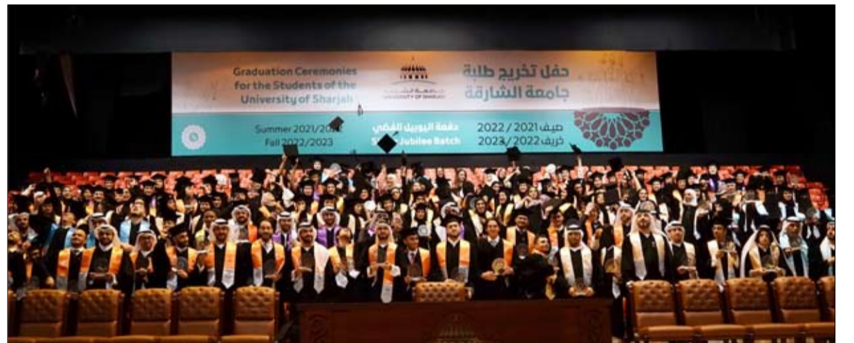
برعاية سلطان بن أحمد بن سلطان القاسمي