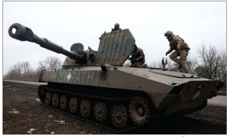
رجال المدفعية الأوكرانيون يتخذون مواقعهم القتالية على الطريق في منطقة دونيتسك

القوات اللبنانية: حزب الله ينسف البلاد بيروت-وكالات: اتهم حزب القوات اللبنانية، حزب الله بخطف القرار السيادي اللبناني بإصراره على زرع أداة تابعة له مباشرة أو مواربة في كرسى الرئاسة الأولى. ويجده على اتهامات حزب الله للقوات اللبنانية بالانقلاب على الترتيب والهيبة، قال الحزب في بيان نشره موقع قناة الجديد، إن حزب الله ينسف الجمهورية اللبنانية من أساسها ويضرب كل الفرض والطروحات والاتفاقات التي تسعى لبناء الدولة وينقلب على اتفاق الطائف بشكل متواصل ويفرض تسليم سلاحه. وأضاف وأضاف مستغربة اتهامات حزب الله، أن الأخير أكثر من عمل على ضرب الصيغة اللبنانية بروحيها عبر استهدافه كل المكونات الراضية للخضوع لإملاءاته ومصادرته القرار السياسي السيادي، العسكري والأمني، وانخراطه في حروب عبثية دون العودة للدولة وللشعب اللبناني، وأغرقتهم بالدمار.