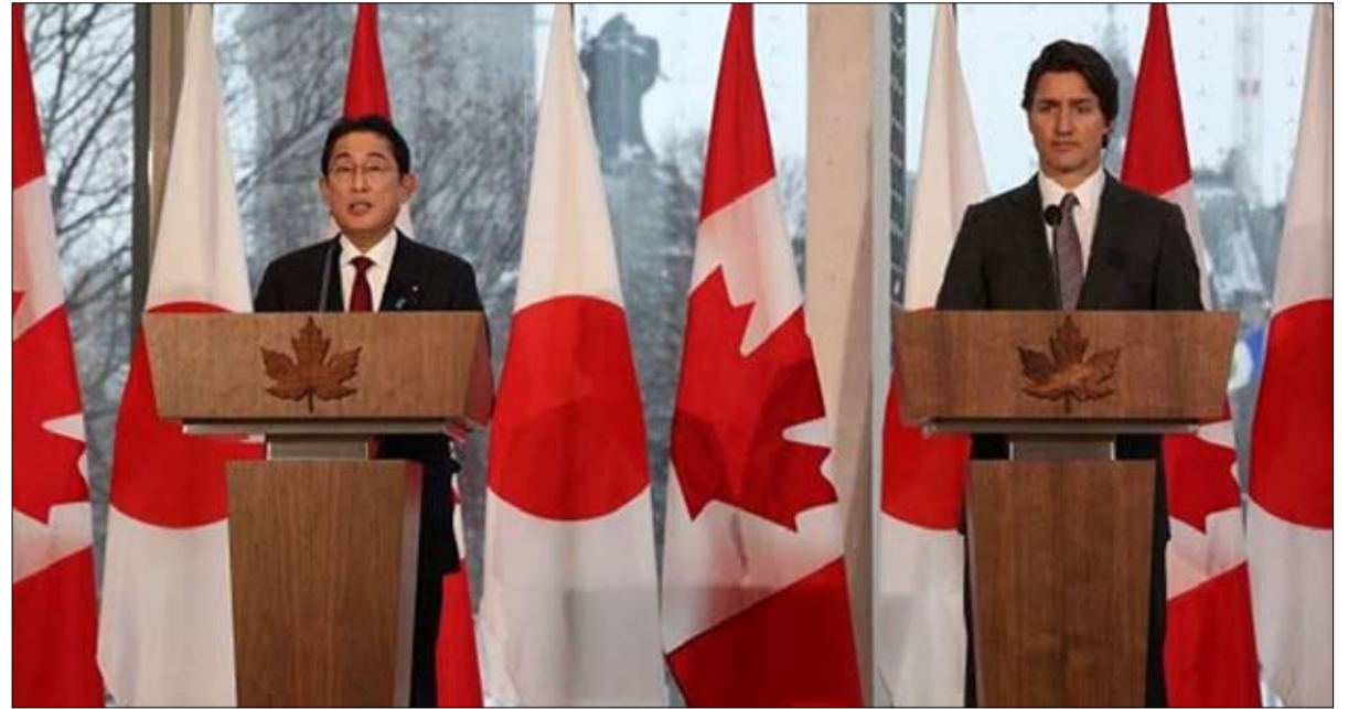
كندا واليابان تسعيان إلى تعزيز علاقتهما الاقتصادية والأمنية