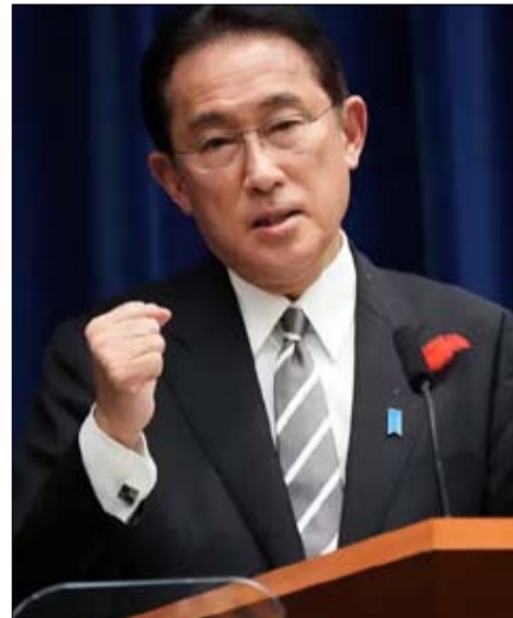
اليابان تتعهد باستثمار 30 مليار دولار في إفريقيا