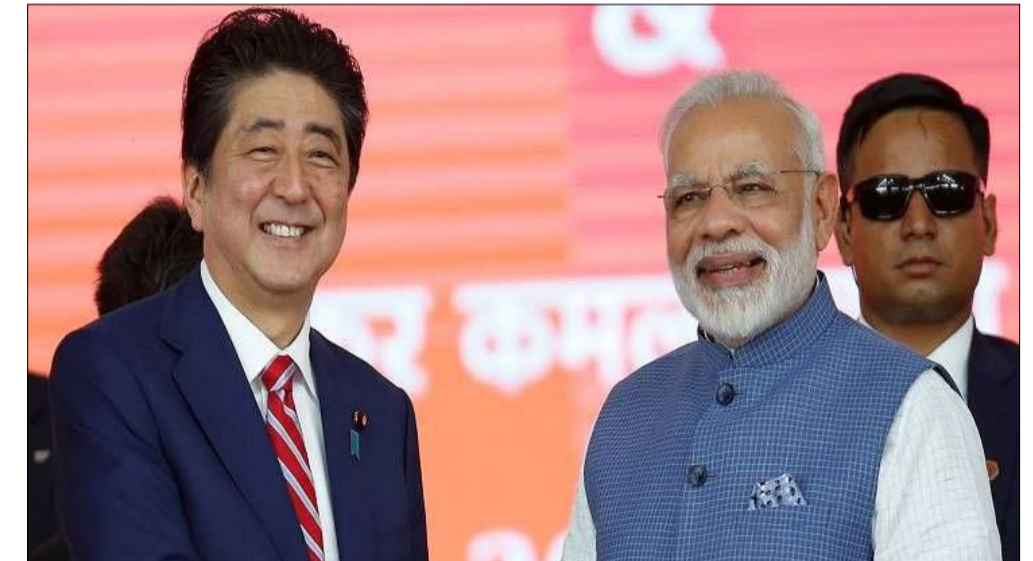
رئيس وزراء اليابان السابق اهتم بتوثيق العلاقات مع الهند في ظل تنامي النفوذ الصيني