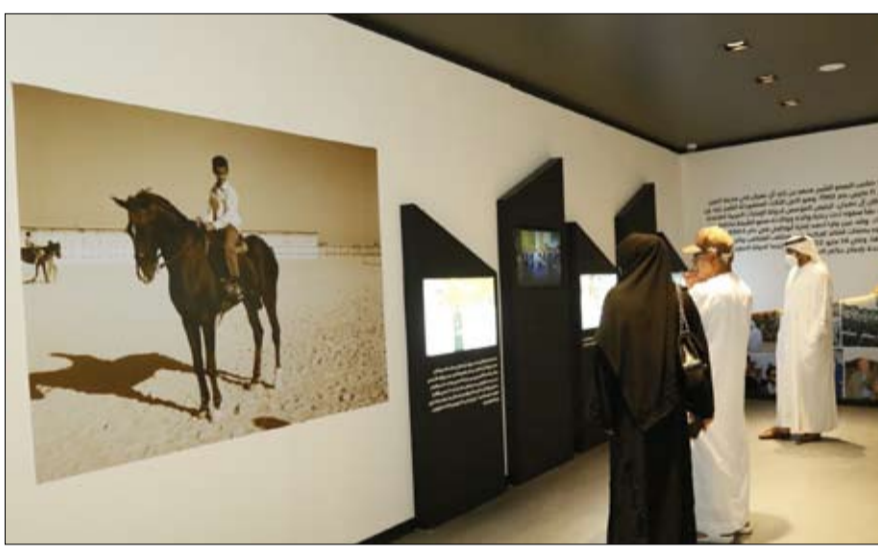
السمو الشيخ محمد بن راشد آل مكتوم نائب رئيس الدولة، محمد بن زايد آل نهيان رئيس الدولة - حفظه الله - وصاحب اهتمام صاحب السمو الشيخ آل نهيان - طيب الله ثراه - والشيخ صاحب السمو الشيخ محمد بن راشد آل مكتوم نائب رئيس الدولة،

مقتنيات المنصة منافسات بطولة أبوظبي الدولية لجمال الخيول العربية في ميدان قفز الحواجز بنادي أبوظبي للروسية عام 2011م، وسباق كأس تحدي العمالة للقدرة في ميدان القدرة العالمية للقدرة في الوثبة عام 2013م، ووقفت المنصة أيضاً تسليم نسخة من كتاب (أصول الخيل للمنظمة العالمية للخيول العربية الأصلية (الواهو) عام 1990، ومشاركة دولة الإمارات في مؤتمر (الواهو) الذي عقد في المغرب. هذا ويأتي اهتمام منصة "ذاكرة الوطن" بالخيول مستكملاً لجهوده في دعم مهرجان سمو الشيخ منصور بن زايد آل نهيان العالمي للخيول