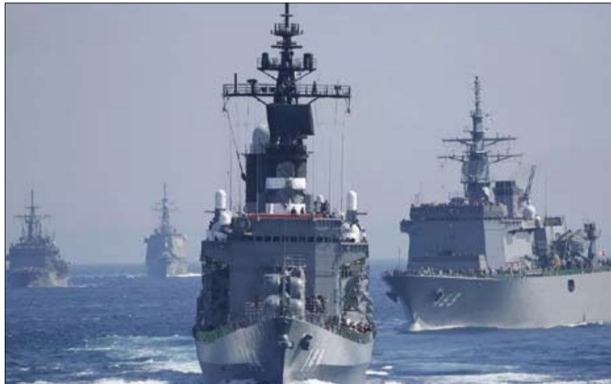
مناورات بحرية أمريكية يابانية لتعزيز الجاهزية القتالية في المحيطين الهندي والهادئ

و اذا ما كان المعنيون بالشأن الدولي يتابعون منذ سنوات عديدة زحف الصين الى القارة الإفريقية و يرصدون تحركاتها من اجل اتخاذ موقف جديد من قضية تايوان فان الانعطاف السريع لليابان عن عقيدتها الدفاعية شكل حدثا لافتا جعل العديد من الباحثين في العلوم السياسية و المختصين في الدراسات الأمنية مثل الكندي لوك هاسي أو الامريكي دافيد اغناتسيو يتساءلون عن اسباب هذا الانقلاب في السياسة العسكرية اليابانية و يخوضون في تفاصيلها .