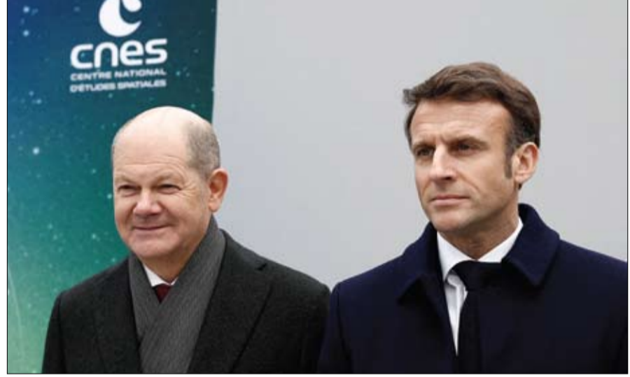
ماكرون وشولتس خلال الاحتفال بالذكرى الستين لتوقيع معاهدة الإليزيه، لإتمام المصالحة بين البلدين

ماكرون وشولتس: مستقبل أوروبا يعتمد على الحرك الفرنسي-الألماني باريس-أ ف ب: بعد استعراض الخلافات، حاول المستشار الألماني أولاف شولتس والرئيس الفرنسي إيمانويل ماكرون الأحد طي صفحة خلافاتهما وأعلن في باريس وحدة الحرك الفرنسي-الألماني ليصبح رائدا في إعادة تأسيس أوروبا. بمناسبة الذكرى الستين لتوقيع معاهدة المصاحبة بين البلدين، فيما تجد القارة العجوز نفسها غارقة من جديد في الحرب منذ شهر، أكد الرئيس الفرنسي أن هذا الثنائي سيقوم باختيار المستقبل كما فعل عند كل نقطة تحول في البناء الأوروبي. وقال في كلمة ألقاها بهذه المناسبة في جامعة السوربون إن ألمانيا وفرنسا، لأنهما مهدتا الطريق إلى المصالحة، يجب أن تصبحا رائدتين في إعادة تأسيس أوروبا واصفاً الجارين بأنهما روحان في صدر واحد. وأشار المستشار الألماني، من جانبه، إلى أن المستقبل، كما الماضي، يعتمد على تعاون بلدينا كمحرك لأوروبا موحدة قادر ميركل في نهاية عام 2021، فكل منهما مستاء من المبادرات التي اتخذها الآخر بدون استشارة مسبقة. تاريخ الاجتماع رمزي للغاية، فهو يوافق مرور ستين عاماً على توقيع معاهدة الإليزيه من قبل شارل ديغول وكونراد أديناور، هذا العمل التأسيسي للمصالحة بين البلدين اللذين كانا ألد عدوين وقررا أن يصبحا الحليفين المقربين، على قول ماكرون. أكد أولاف شولتس وإيمانويل ماكرون بصوت واحد أن الهدف هو سيادة أوروبا من خلال زيادة الاستثمار في الدفاع والصناعة. ومن المتوقع أن يناقش الزعيمان ما إذا كان سيرسلان دبابات ثقيلة إلى كيب، في الوقت الذي يتزايد دبابات ليوبارد إلى الجيش الأوكراني. في جامعة السوربون، أكتفى شولتس بالتأكيد أن فرنسا وألمانيا ستواصلان تقديم كل الدعم الذي تحتاج إليه أوكرانيا إمبريالية بوتين لن تنصرا.