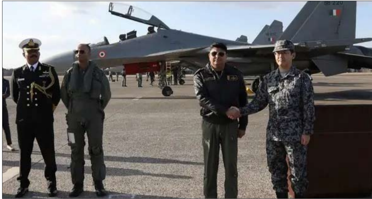
لواجهة الصين.. الهند تطلق تدريبات مشتركة مع اليابان

السوداء في تاريخ التعصب والكراهية. وطالب الأزهر المجتمع الإنساني والمؤسسات الدولية وحكام العالم، بالوقوف في وجه محاولات العبث بالمقدسات الدينية، وإدانة هذه الأفعال، ووضع حد لفوضى مصطلح "حرية التعبير"، وإساءة استخدامه فيما يتعلق باستفزاز المسلمين واحترام مقدساتهم، وفتح تحقيق عاجل حول تكرار هذه الحوادث، مشدداً على أن السماح بتكرار هذه الاستفزازات تحت شعار "حرية التعبير" يعيق جهود تعزيز السلام وحوار الأديان والتواصل بين الشرق والغرب، وبين العالم الإسلامي والعالم الغربي.