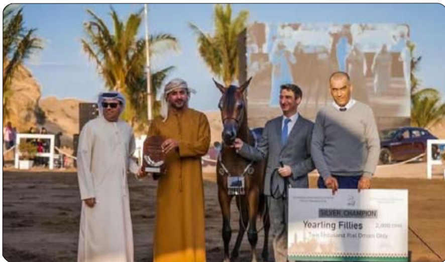
دي دوية وهي من الفحل العالمي شهدت مستوى عالياً من التنافس بين صفوة من الأفراس الخليجية تمكنت ببطولة عجمان الفرس دي جهرا وهي من الفحل العالمي

الرابطة الأولى. أما في مستوى التميز والأفضلية فقد توج مربط دبي بلقب جائزة أفضل مربط عربي، مؤكداً مشاركته ببطولة عجمان لجمال الخيل العربية، وهو لقب تمكن من إحرازه في العديد من البطولات الوطنية والدولية منها بطولة منتون وكأس كل الأمم و بطولة العالم، وهو اعتراف متجدد بالمستوى الإنتاجي الذي يحافظ عليه مربط دبي منذ سنوات.