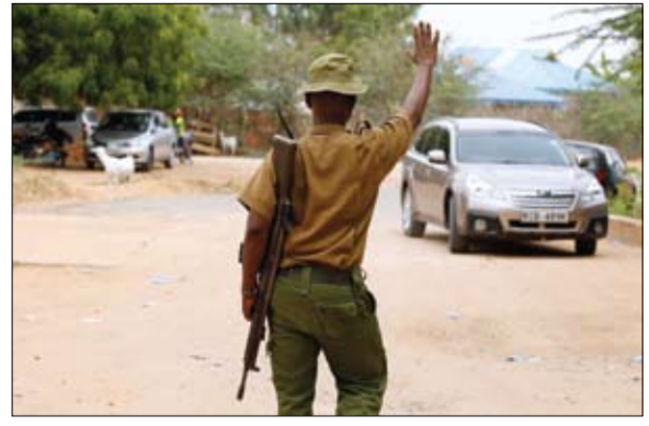
دوريات للشرطة الصومالية في مختلف المناطق حيث تصاعدت الهجمات

انفجار قرب مكتب رئيس البلدية في عاصمة الصومال مقديشو-وكالات: دوى انفجار قرب مكتب رئيس البلدية في العاصمة الصومالية مقديشو، الأحد، وأصيب 10 قتلى. ولم تتضح بعد الجهة التي تقف وراء الانفجار. وتشن حركة الشباب الصومالية المتطرفة هجمات متكررة بالقنابل والأسلحة النارية على أهداف في مقديشو وفي أنحاء البلاد. وتخوض الحركة قتالا ضد الحكومة المركزية في الصومال منذ 2006 وتوسعي للإطاحة بها. وكثفت حركة الشباب من الهجمات بشكل خاص في الأشهر القليلة الماضية مما يعكس قدرتها على البقاء في المشهد رغم إطلاق حكومة الرئيس حسن شيخ محمود لهجوم ضد مقاتلي الحركة الموالية لتنظيم القاعدة في أغسطس 2022. هذا وقالت القيادة الأمريكية في أفريقيا في بيان إن ضربة عسكرية أمريكية أدت إلى مقتل نحو 30 من مسلحي حركة الشباب المتشددة، بالقرب من بلدة جلعاد الواقعة في وسط الصومال والتي شهدت قتالا عنيفا بين الجيش الصومالي ومسلحين. وأضاف البيان أن العملية التي وصفها الجيش الأمريكي بأنها كشفت تقارير صحفية في السودان، عن توصل مجموعتي قوى الحرية والتغيير، والكتلة الديمقراطية، لتضامات مشتركة، ينتظر أن تنتج إعلانا سياسيا جديدا خلال الأيام المقبلة. وكانت الخلافات بين المجموعتين عطلت استمرار العملية السياسية لنهايتها، والوصول لاتفاق نهائي، تشكل بعده الحكومة الجديدة، حيث رفضت مجموعة الكتلة الديمقراطية التوقيع على الاتفاق الإطاري، بعدما تمسكت الحرية والتغيير بانضمام حركتي جبريل ومناوي فقط، من دون بقية قوى تحالف الكتلة الديمقراطية. وقالت صحيفة الحرك السياسي الصادرة أمس، نقلا عن مصادر وصفتها بالطلعة، إن مجموعتي الحرية والتغيير-المجلس المركزي، والكتلة الديمقراطية توصلتا إلى تضامات بشأن العملية السياسية الجارية الآن.