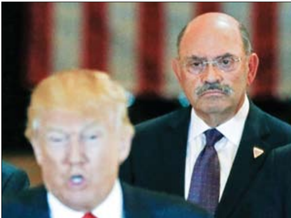
ترامب والمدير المالي لمنظمة في صورة أرشيفية

وأعلن الكاظمي، الخميس، عن النجاح في تفكيك شبكات داعش الإرهابية، فيما أشار إلى خطط لضمان الأمن الانتخابي، اجتماعه بالممثلين الدائمين لدول حلف شمال الأطلسي في بروكسل إن العراق يقدر عاليا التعاون مع منظمة حلف شمال الأطلسي (الناتو) والدول الأعضاء فيها، من أجل دعم إعادة بناء مؤسساتنا العسكرية.