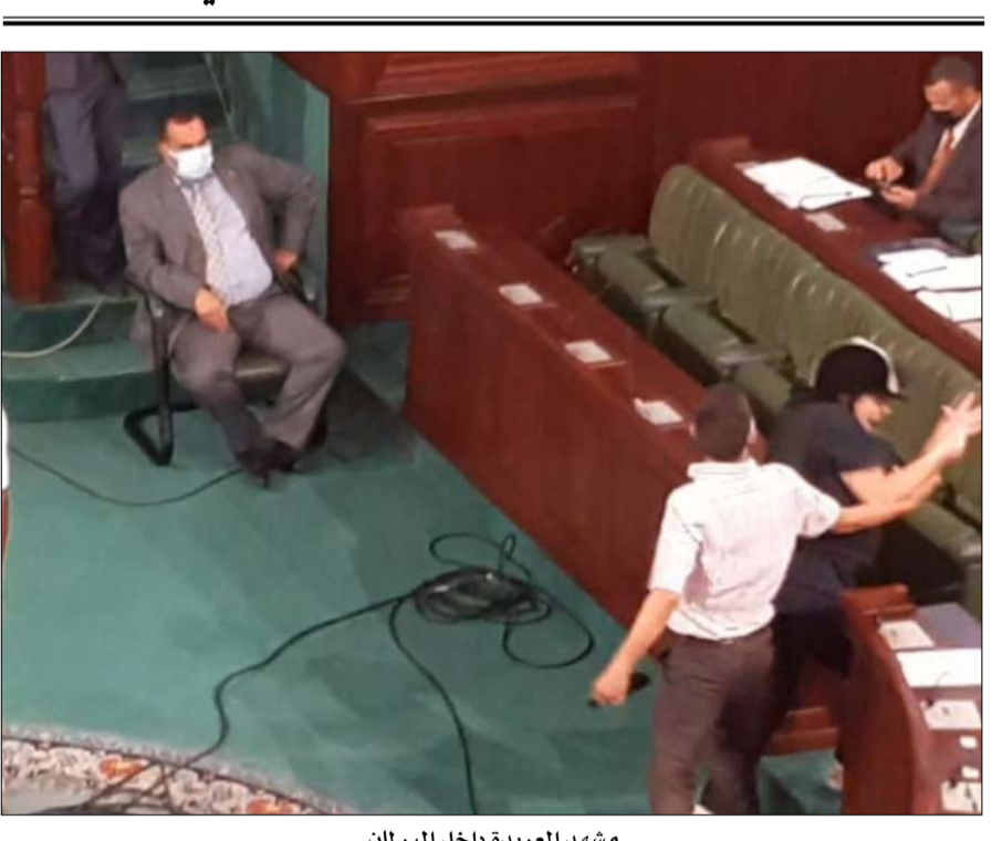
مشهد العريضة داخل البرلمان