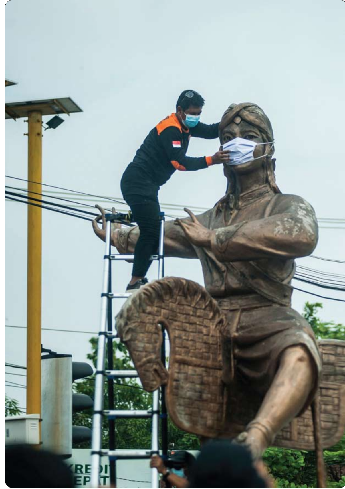
عامل يضع قناعاً جراحياً وهمياً على أحد التماثيل القديمة في يوجيا كارتا، لتشجيع السكان على ارتداء الماسك مع ارتفاع معدلات الإصابة في إندونيسيا.

أظهرت أرقام دائرة الضرائب أن المؤثرة والمشهورة السويدية بيانكا لغروسو والتي تبلغ من العمر 26 عاماً قد بلغ دخلها في العام المنصرم 202 مليون كرون سويدي، وهو ما يعادل تقريبا 23 مليون دولار أميركي. بيانكا المولودة أواخر عام 1994 برزت منذ سنوات كمؤثرة على السوشال ميديا، ومدونة، ولها تجارب في الغناء، وشاركت وهي صغيرة في نسخة الصغار من مسابقة يورو فيجين الغنائية عام 2006 ووصلت للمرتبة الثانية. وزادت شهرتها إلى حد أن أصبحت أحد أعضاء لجنة التحكيم في النسخة السويدية من برنامج المواهب