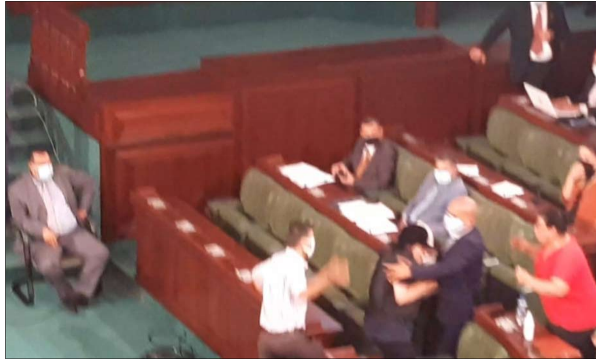
العنف ضد المرأة