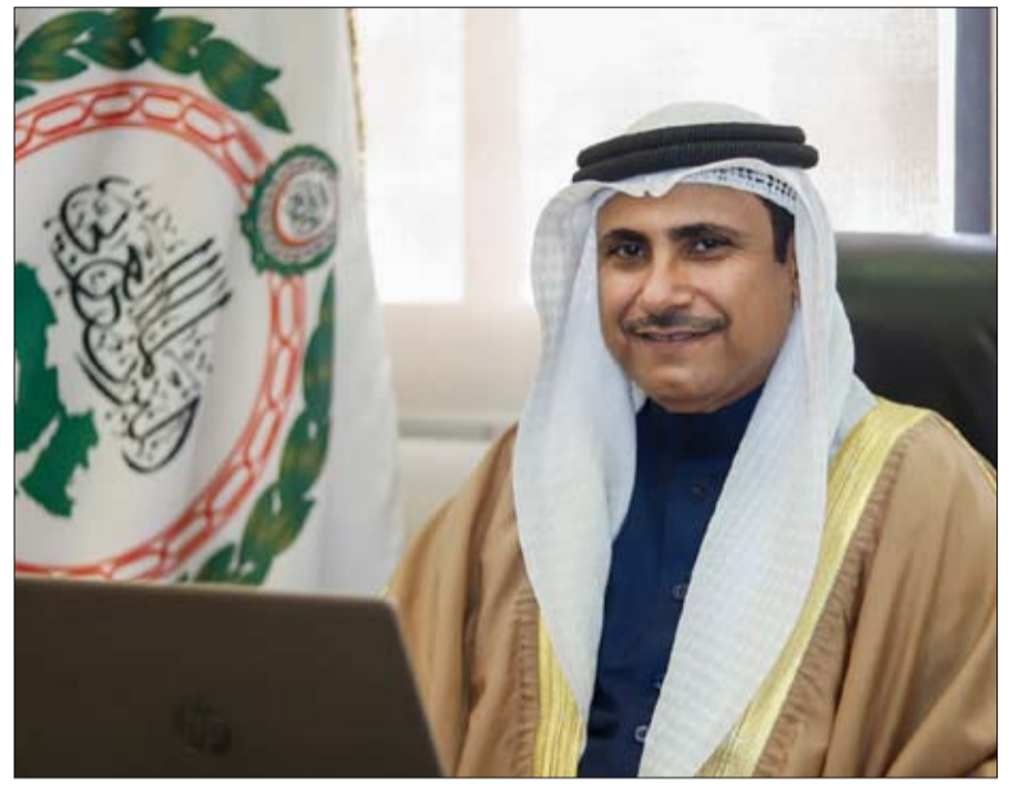
صاحب المعالي السيد عادل بن عبدالرحمن العسومي رئيس البرلمان العربي

هنأ صاحب المعالي السيد عادل بن عبدالرحمن العسومي رئيس البرلمان العربي، فخامة الرئيس عبدالفتاح السيسي رئيس جمهورية مصر العربية وحكومة وبرلمان وشعب مصر، بمناسبة الذكرى الثامنة لثورة الثلاثين من يونيو، مؤكداً أنها كانت ثورة تلاحم بين الشعب المصري وجيشه الوطني العظيم من أجل استعادة الدولة المصرية والحفاظ على مقدرات الشعب المصري والعبور الآمن إلى مرحلة الأمن والاستقرار والوحدة الوطنية.. مشيداً على أن هذه الثورة المجيدة أثبتت قوة الدولة المصرية، وقدرتها الشعبي المصري، على تجاوز كافة التحديات.. كما دشنت عهداً جديداً من