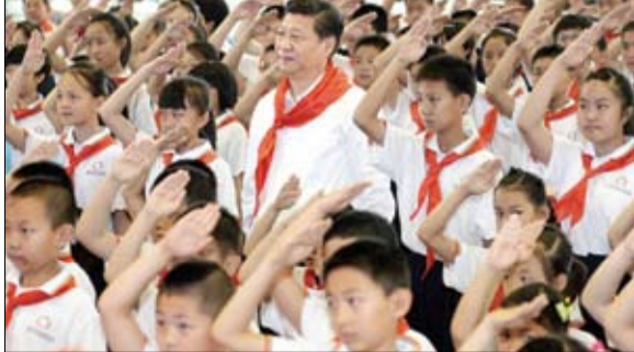
من سيكسب الرهان الديموغرافي؟

استفادت منذ فترة طويلة من مجموعة ضخمة من العمالة الشابة منخفضة التكلفة، تشهد انخفاضا في عدد سكانها العام المقبل. ويمكن أن ينخفض الرقم