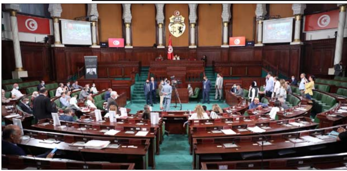
من برلمان الى حلبة ملاكمة

أعلن الحزب الدستوري الحر امس الخميس أنه وضع عريضة للطعن في دستورية الاتفاقية "المشبوحة التي تم تمريرها خلسة تحت جنح الظلام" في إشارة الى مشروع القانون الأساسي المتعلق بالموافقة على اتفاقية مقرر بين حكومة الجمهورية التونسية وصندوق قطر للتنمية حول فتح مكتب لصندوق قطر للتنمية بتونس برمته ب 122 نعم و 1 احتفاظ و 12 رفضا. وجاء في بلاغ صادر عن الدستوري الحر: "بعد العنف والهجمية والتغول الذي عايناه الرأى العام لازالت فرصة للطعن في دستورية الاتفاقية الاستعمارية المشبوحة ... نضع توقيعات كتلة الحزب الدستوري الحر على دمة عريضة الطعن في دستورية الاتفاقية المشبوحة التي تم تمريرها خلسة تحت جنح الظلام.. يشار الى ان رئيس لجنة المالية وممثل حركة الشعب بالبرلمان هيكل المكي