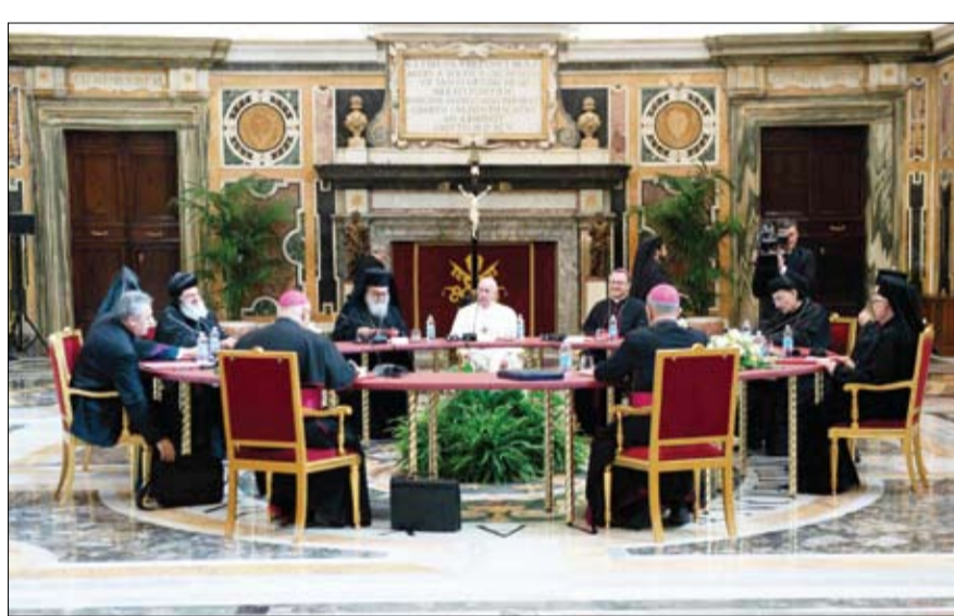
الابا فرنسيس خلال لقائه قادة مسيحيين لبنانيين لإجراء مشاورات في القصر الرسولي بالفاتيكان. (ا ف ب)

غالاغر الذي يتولى منصب وزير خارجية الكرسي الرسولي إن الزيارة يمكن أن تتم في نهاية 2021 أو مطلع 2022. بفضل بعد تشكيل حكومة جديدة. يشهد لبنان منذ صيف 2019 انهيارا اقتصاديا متعامدا، فقدت معه العملة المحلية أكثر من تسعين في المئة من قيمتها أمام الدولار.