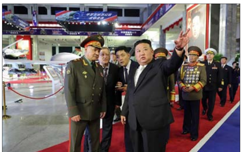
الاستخباراتية (في واشنطن وسيول) تراقب عن كثب" تحضيرات العرض العسكري الكوري الشمالي، مضيفا أنها تتابع أيضا "اتجاهات تطوير الأسلحة" في البلاد.