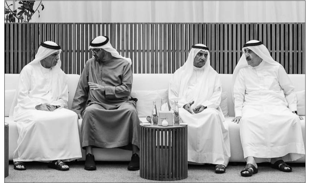
رئيس الدولة يتلقى التعازي من حكام الفجيرة وأم القيوين ورأس الخيمة