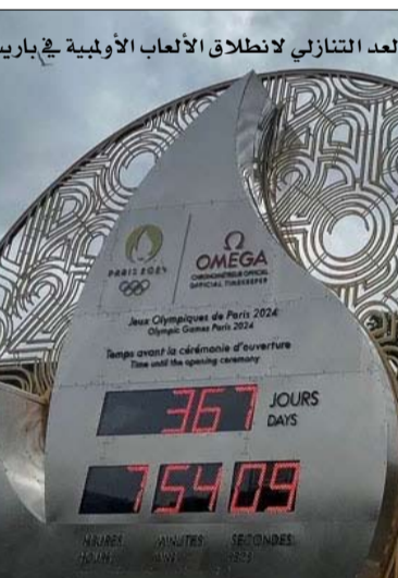
ساعة توضح العد التنازلي لانطلاق الألعاب الأولمبية في باريس

القرية الإعلامية، وهو ما يجعلها قادرة على استيعاب 1300 صحفي في المجموع، ينبغي بناء أكثر من 4000 وحدة سكنية، ثم تسليمها في هاتين المنطقتين في سان سان دوني، واللذان كانتا تعتبران حتى الآن محرومتين ولا تتوفر بهما ديناميكية كبيرة من حيث العقارات. في مايو الماضي طرح الوكيل العقاري أيضا أول شقة في قرية الرياضيين للبيع بأسعار تبدأ من 6700 يورو للمتر المربع. ولا تني شركة إنجاز أشغال المواقع الأولمبية في مدح هذه الأحياء المشاة حديثا والاشهر لها ولستقبل تطورها. في لوبورجيه، تم بالفعل افتتاح مدرسة جديدة هذا العام. وداخل قرية الرياضيين، يجب أن ترى المدارس وصالة الألعاب الرياضية والملاعب النور، بينما ستتمدد حديقة "أمبار" المستقبلية على مساحة تزيد عن 3 هكتارات إلى جانب القرية الأولمبية، استفاد بعض المروجين أيضا من الألعاب لتطوير مشاريعهم الخاصة. هذه هي حالة شركة بلايال للإستثمار، التي قررت تجديد برج "سين سان دونيه" الذي البعد الرمزي الذي يرتفع إلى 132 مترا، لتحويله إلى فندق 4 نجوم يضم 700 غرفة على أن يتم الانتهاء من بنائه بنهاية العام. ومن أجل إيواء موظفي الدولة وبعض حراس الأمن الخاصين الوفاء الوزارى المشترك الخاص بالألعاب 18000 مكان إقامة لحجزها، بما في ذلك 3200 في مساكن الطلاب.