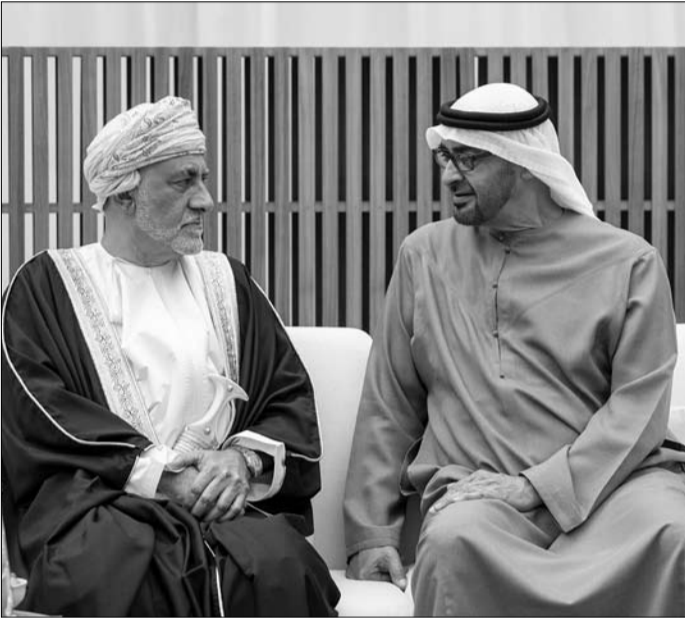
رئيس الدولة يتلقى التعازي من نائب رئيس الوزراء لشؤون الدفاع في سلطنة عمان الشقيقة

الجمعة 28 يوليو 2023 م - 10 محرم 1445 العدد 13908 Friday 28 July 2023 - Issue No 13908