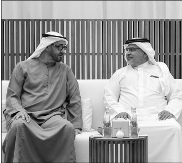
رئيس الدولة يتلقى التعازي من ولي العهد رئيس مجلس الوزراء في مملكة البحرين الشقيقة