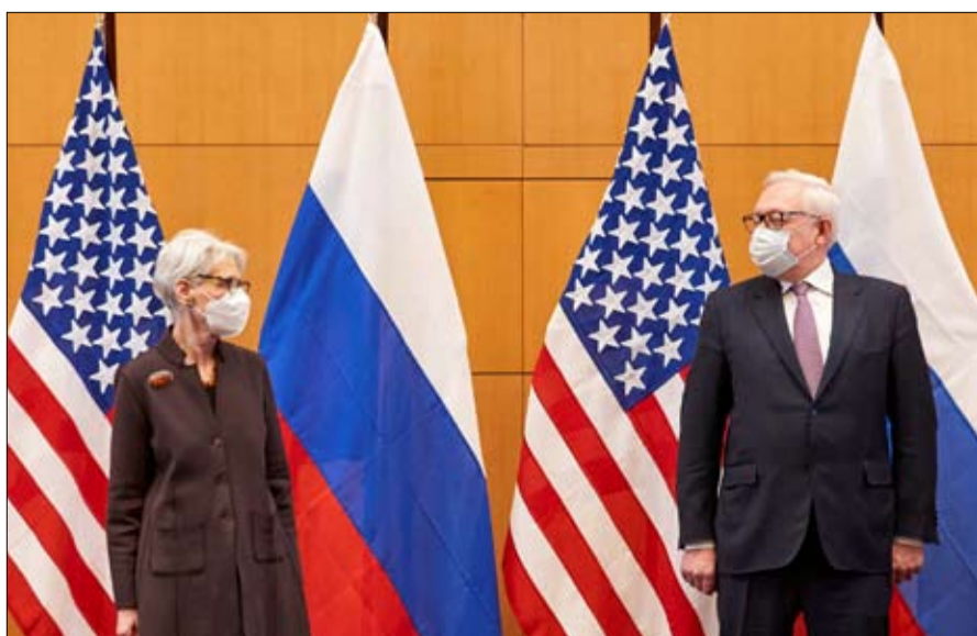
مفاوضات جنيف والتوقعات الضعيفة