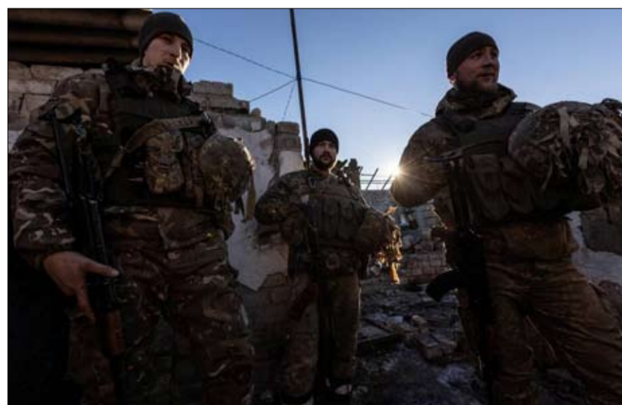
عناصر من الجيش الاوكراني على الحدود

الدول التي كانت تنتمي إلى الاتحاد السوفياتي ولم تكن أعضاء في الناتو، ولن تحافظ على التعاون العسكري معها. كما يتعهد الطرفان بمرعاة مختلف القيود المفروضة على نشر الأسلحة، وعلى وجه الخصوص، عدم نشر أسلحة نووية خارج حدودهما.