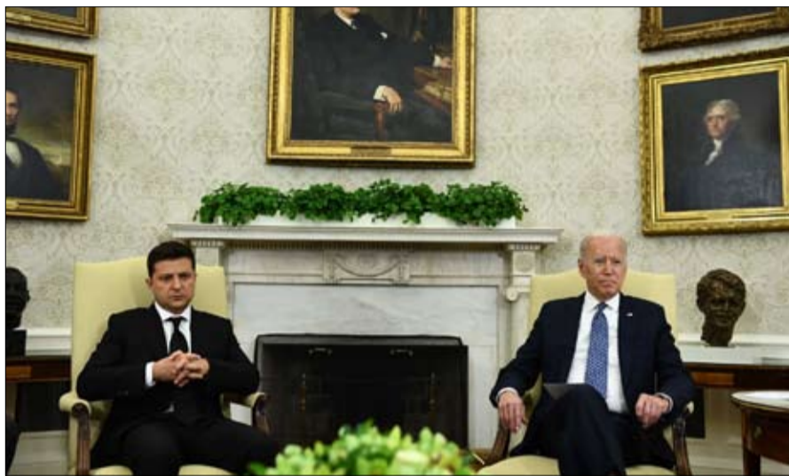
الولايات المتحدة في مازق

استمرارية إقليمية بين روسيا وشبه جزيرة القرم؛ استمرار هذه الحركة نحو الغرب لفهم روسيا الجديدة بأكملها. تلك الحافة الجنوبية لأوكرانيا، والتي كان بوتين يأمل عبثا أن تنتفض في نفس الوقت مع دونباس عام 2014، ان لم يكن احتلال كل شرق أوكرانيا حتى نهر الدنيبر، وهذا يعني حتى كييف. يضاف إلى ذلك مجهول آخر، وهو الأكثر إشارة للقلق في هذا الملف؛ ما الذي يمكن أن يخدمه الخيار العسكري في هذه القضية؟ أيا كان السيناريو المختار، الى ماذا يمكن أن يؤدي؟ جزء جديد من أوكرانيا مرتبط بروسيا؟ بأي مشروع سياسي للعلاقات بين روسيا وأوكرانيا وروسيا والغرب، إن لم يكن عداوة لا يمكن اصلاحها بين الأولين، وحرب باردة جديدة بين الأخيرين؟