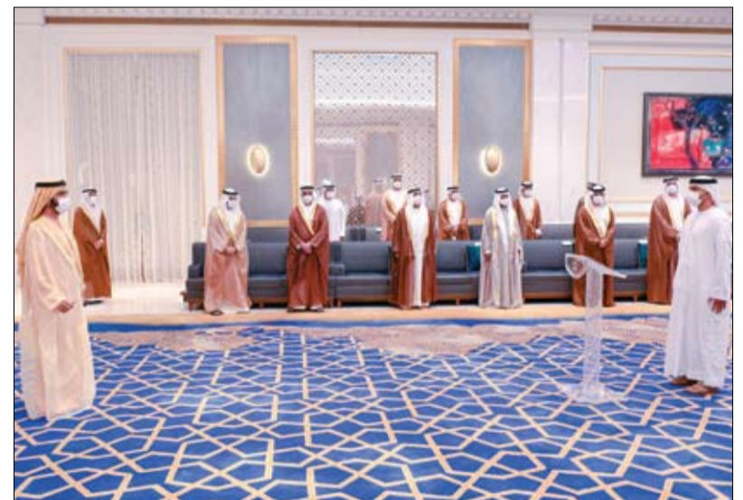
أمام محمد بن راشد