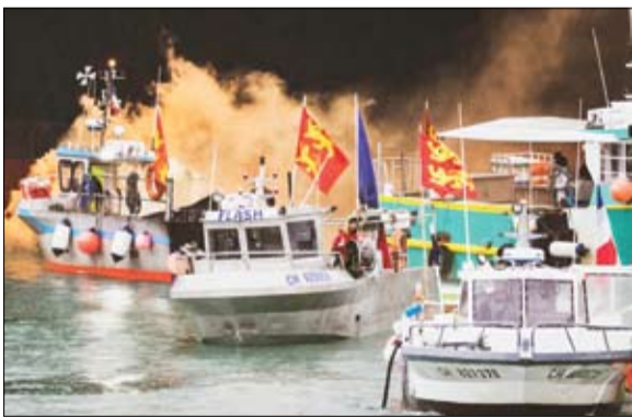
معاركة صيد الأسماك بين إنجلترا وفرنسا

أعلن الرئيس الأوكراني، فولوديمير زيلينسكي، الثلاثاء، أنه مستعد لاتخاذ القرارات الضرورية التي تنهي الحرب شرقي البلاد مع المتمردين المدعومين من موسكو.