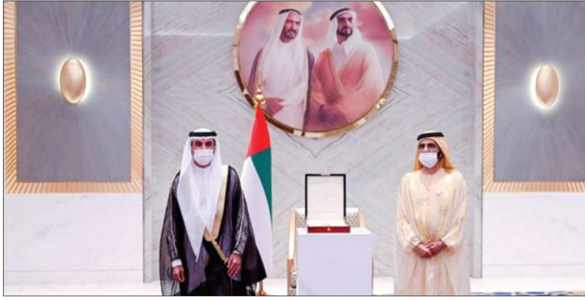
محمد بن راشد خلال تكريمه الفائزين بجائزة دبي التقديرية لخدمة المجتمع

أحدث القانون الذي أصدره صاحب السمو الشيخ محمد بن راشد آل مكتوم نائب رئيس الدولة رئيس مجلس الوزراء رعاها الله بصفته حاكماً لإمارة دبي القانون رقم 3 لسنة 2022 بشأن حقوق الأشخاص ذوي الإعاقة في إمارة دبي ردود فعل واسعة أشادت بالقانون الذي يرسخ لحقوق هذه الفئة الغالية على قلوب الجميع في مجتمعنا المعطاء. (التفاصيل ص7)