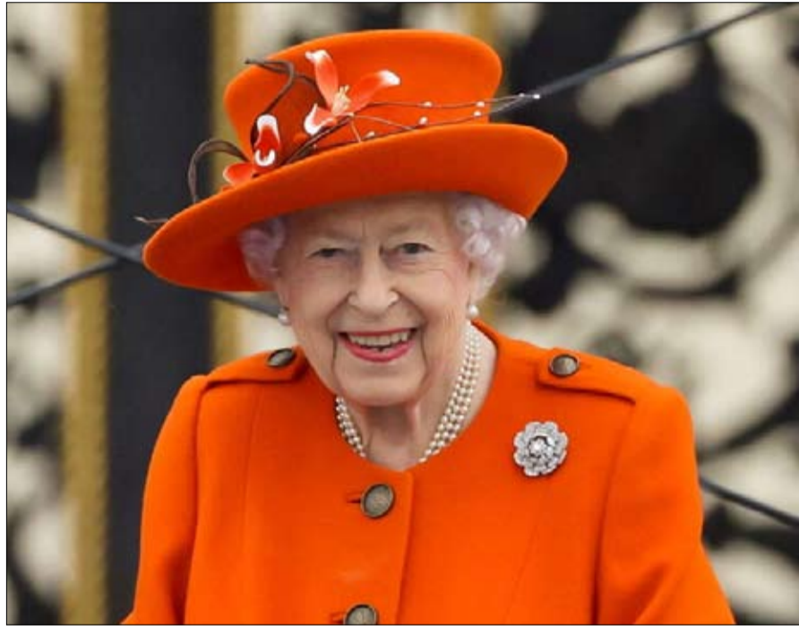
اليزابت الثانية دوقة نورماندي

نورمان إلى اللغة الإنجليزية، فقد ظلوا مرتبطين بشدة بهويتهم النورماندية، وإلى محافظاتهم، وقوانينهم العرفية، وأسمائهم الجغرافية الفرنسية. الشيء نفسه ينطبق على الألقاب: لن يربك ناطق بالفرنسية وجود رئيس وزراء في جيرسي يدعى جون لو فونديريه، أو وزير في جيرسي يدعى جونانان لو توك.