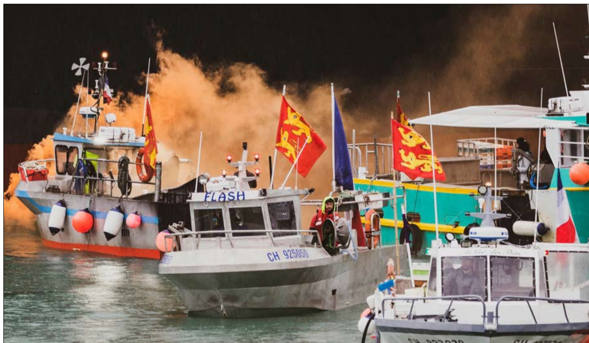
مركبة صيد الاسماك بين إنجلترا وفرنسا