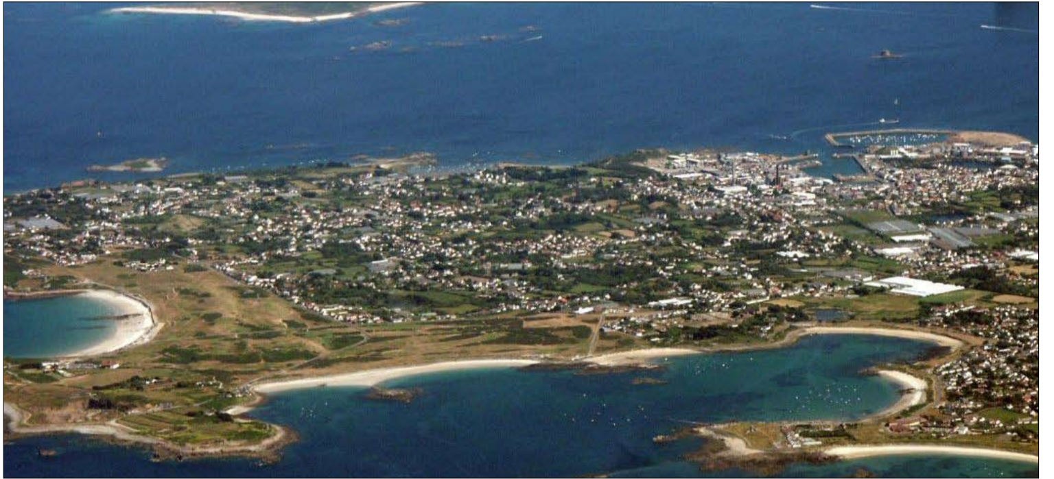
منظر جوي لجزيرة غيرنسي