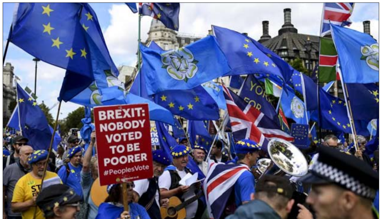
البريكسيت أشعل الفتيل في حدود الأرخيل