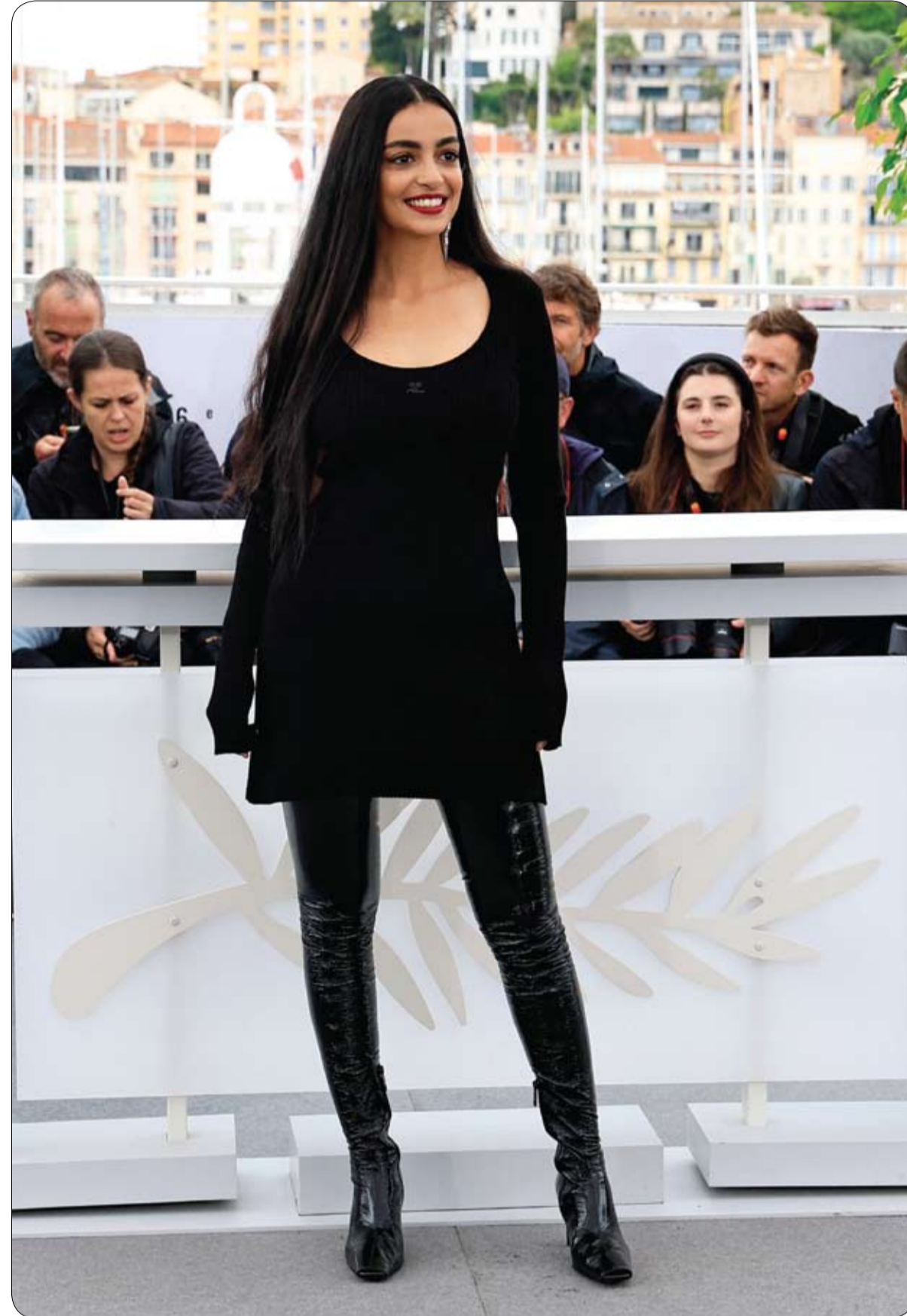
المثلة مريم عبيار في صورة فوتوغرافية لفيلم Omar la Fraise خلال مهرجان كان

وقد لقي الفيديو ردود أفعال متناقضة، حيث قال بعض المتابعين بأن الموقف مضحك، في حين انتقد آخرون تصرف الفتاتين لأنهما حاولتا التهرب من دفع قيمة الوزن الزائد، وفق ما نقلت صحيفة ديلي ميل البريطانية.