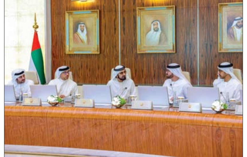
محمد بن راشد: أقرنا 78 مشروعاً ومبادرة بيئية استعداداً لـ COP28