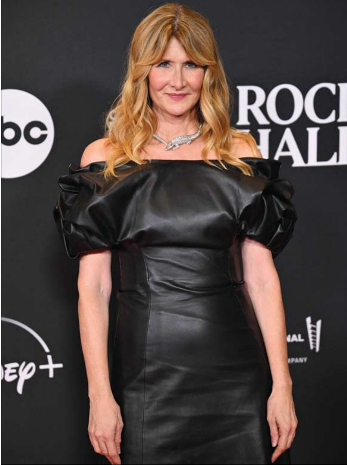
الممثلة الأمريكية لورا ديرن لدى حضورها الحفل السنوي لقاعة مشاهير الروك أند رول بمدينة نيويورك.

كشفت الدكتورة آسيا مولا عن علامات مرض الاضطرابات الهضمية، والتي تصف شدة عدم تحمل الغلوتين. وقالت مولا، وهي طبيبة عامة في المركز الطبي "دا هيلث سويت": "تم تشخيص هذه الحالة لدى 36% فقط من الأشخاص المصابين". ويمكن أن تشمل أعراض انخفاض مستوى حساسية الغلوتين والانتفاخ والإسهال وآلام المعدة. وقالت: "إذا كنت تعاني من هذه الأعراض، فإننا نقترح بشدة حجز فحص دم مع طبيبك العام لاختبار مرض الاضطرابات الهضمية". ويمكن أن يؤدي مرض الاضطرابات الهضمية إلى التهاب الجلد، والذي يظهر على شكل طفح جلدي مثير للحكة. وتظهر الآفات الجلدية عادة على المرفقين والركبتين والأرداف وفروة الرأس. وأضافت أن "تقافم الإكزيما، أو جفاف الجلد والحكة، يمكن أن يشير أيضا إلى عدم تحمل الغلوتين". وقد يؤدي مرض الاضطرابات الهضمية أيضا إلى ظهور أعراض عصبية، مثل الاكتئاب والقلق والتعب. وقالت مولا: "من المهم أن نلاحظ أن للاكتئاب والقلق أسبابا متعددة. لذلك قد تكون هناك عوامل أخرى هي السبب وليس فقط عدم تحمل الغلوتين. ولإجراء تقييم شامل، من الأفضل دائما التحدث إلى أخصائي الرعاية الصحية لاستكشاف الاحتمالات المختلفة". كما أن أحد الأعراض المدهشة لعدم تحمل الغلوتين هو الاعتلال العصبي، والذي ينطوي على تنميل أو وخز في الذراعين والساقين. وذلك لأن عدم تحمل الغلوتين يمكن أن يؤدي إلى نقص التغذية، ما قد يؤثر على وظيفة الأعصاب. وهناك مؤشر آخر محتمل على عدم تحمل الغلوتين ومرض الاضطرابات الهضمية وهو الشعور بالإرهاق. ويُصبح أي شخص يشبهه في أنه قد يكون لديه حساسية تجاه الغلوتين بحجز موعد مع طبيبه.