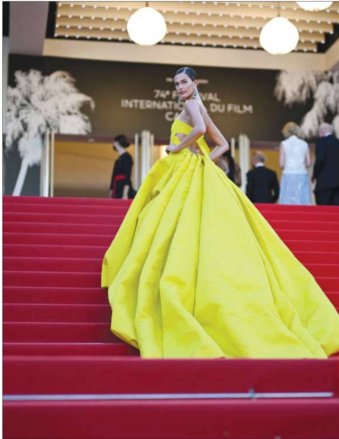
عارضه الأزياء الأمريكية نويل كابريري بييري لدى حضورها عرض فيلم Aline. The Voice Of Love في الدورة 74 مهرجان كان السينمائي.

وبهذا الشأن، قال الباحث الروسي ميخائيل إيفانتشينكو: "الناس مختلفون تماماً، ولكن حتى الآن لم نعرف كيف تؤثر هذه الاختلافات على الأمراض المرتبطة بالعمر، وكيف نتقدم في العمر. بالنسبة للطب الشخصي، من المهم جداً فهم مسارات التطور والتكيف والشيخوخة لكل فرد، ونتيجة بحثنا وجدنا أن الناس حقاً يشيخون بطرق مختلفة".