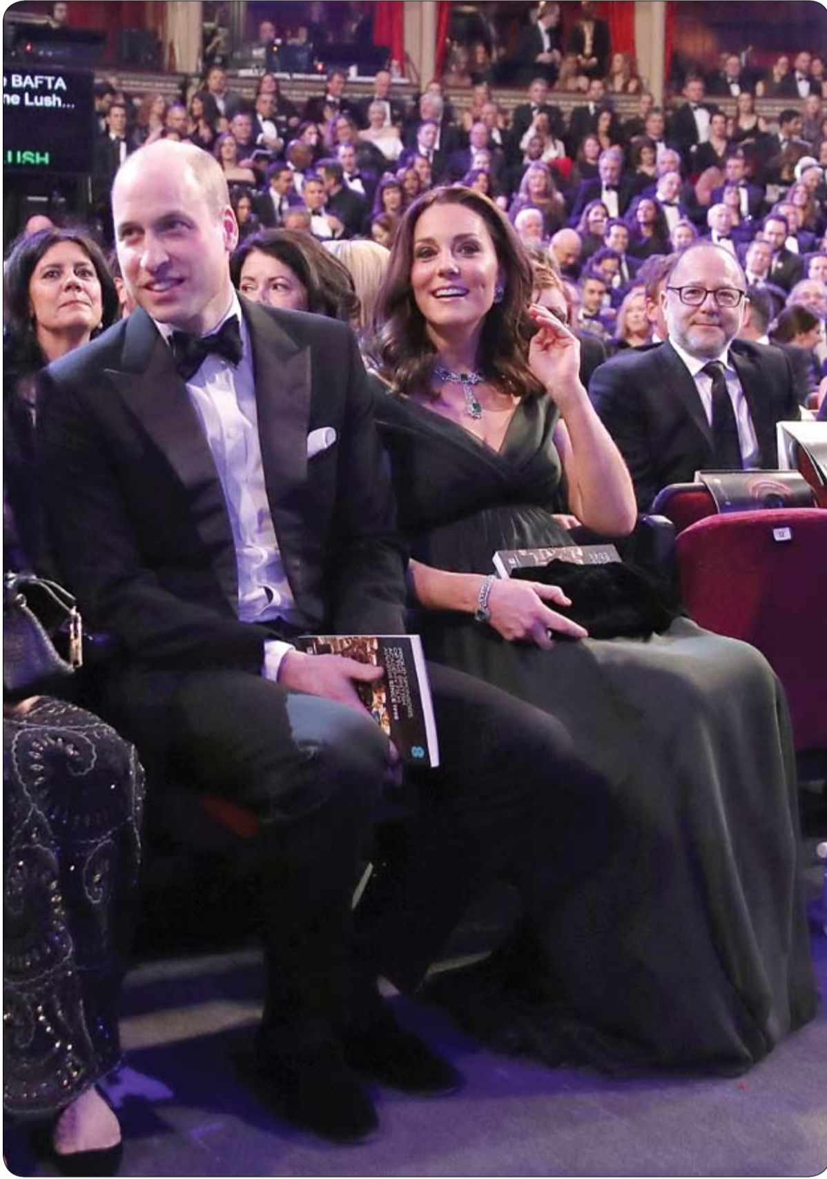
الأمير وليام، وكاترين البريطانية، دوقة كامبريدج يأخذان مقاعديهما خلال حضورهما جائزة بافتا للأفلام

أما جوهرة المطعم فتتمثل بفرنه الذي لم يطفأ أبداً منذ يوم إنفتاحه أي منذ 293 عاماً ويعمل بانتظام، بحسب ما أكد لويس خافيير سانشيز ألفاريز، نائب المدير في المطعم.