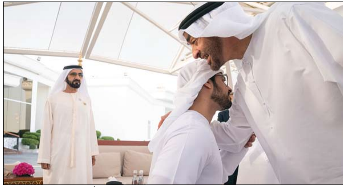
محمد بن راشد ومحمد بن زايد خلال استقبالهما زايد بن حمدان وتهنئته بسلامة الوصول الى أرض الوطن (وام)