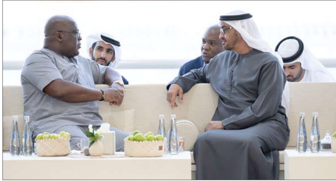
رئيس الدولة خلال استقباله رئيس الكونغو الديمقراطية (وام)

أعلنت وزارة الداخلية العراقية، أمس الثلاثاء، القبض على شبكة للإنتاج بالبشر تتكون من 4 متهمين، بينهم نساء، في محافظة ميسان 400 كم جنوب شرق بغداد. وقالت وزارة الداخلية، في منشور عبر حسابها بموقع فيس بوك إن الشبكة تزعمها امرأة، وإنها تقوم بجلب الفتيات الهاربات من ذويهن والقاصرات من خارج المحافظة، وذلك لأغراض وممارسات لا أخلاقية وغيرها من المواضيع المرفوضة اجتماعياً والتي يعاقب عليها القانون.