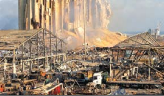
منظر عام يظهر الدمار في موقع الانفجار في مرفأ بيروت.

وكان مسؤول قضائي أوضح من الشهر ذاته، في إطار دعاوى حق عام بجرائم القتل والإيذاء والإحراق والتخريب معطوفة جميعها على القصد الاحتمالي، على من دون تفاصيل محددة حول المأخذ على كل من المدعى عليهم، بينها استنفاة التحقيق.