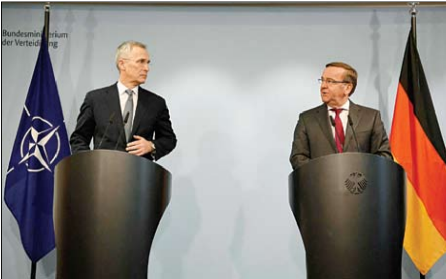
وزير الدفاع الألماني وأمين عام حلف شمال الأطلسي خلال مؤتمر صحفي مشترك في برلين.

وأعلن وزير الدفاع البولندي ماريوش بلاشتشاك، الثلاثاء، أنه طلب موافقة ألمانيا لإرسال دبابات ليوبارد إلى أوكرانيا، فيما حذرت روسيا من هذه الخطوة. وذكر المسؤول الأوكراني أن إسبانيا وهولندا والدنمارك أبدت أيضاً استعدادها لتقديم بعض من دباباتها، لكن موافقة ألمانيا لا تزال ضرورية للمضي قدماً في عملية التسليم. وتعرضت ألمانيا لضغوط شديدة