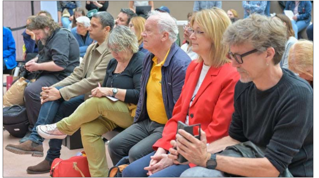
ضمن مشاركته الاستثنائية كضيف خاص في المهرجان