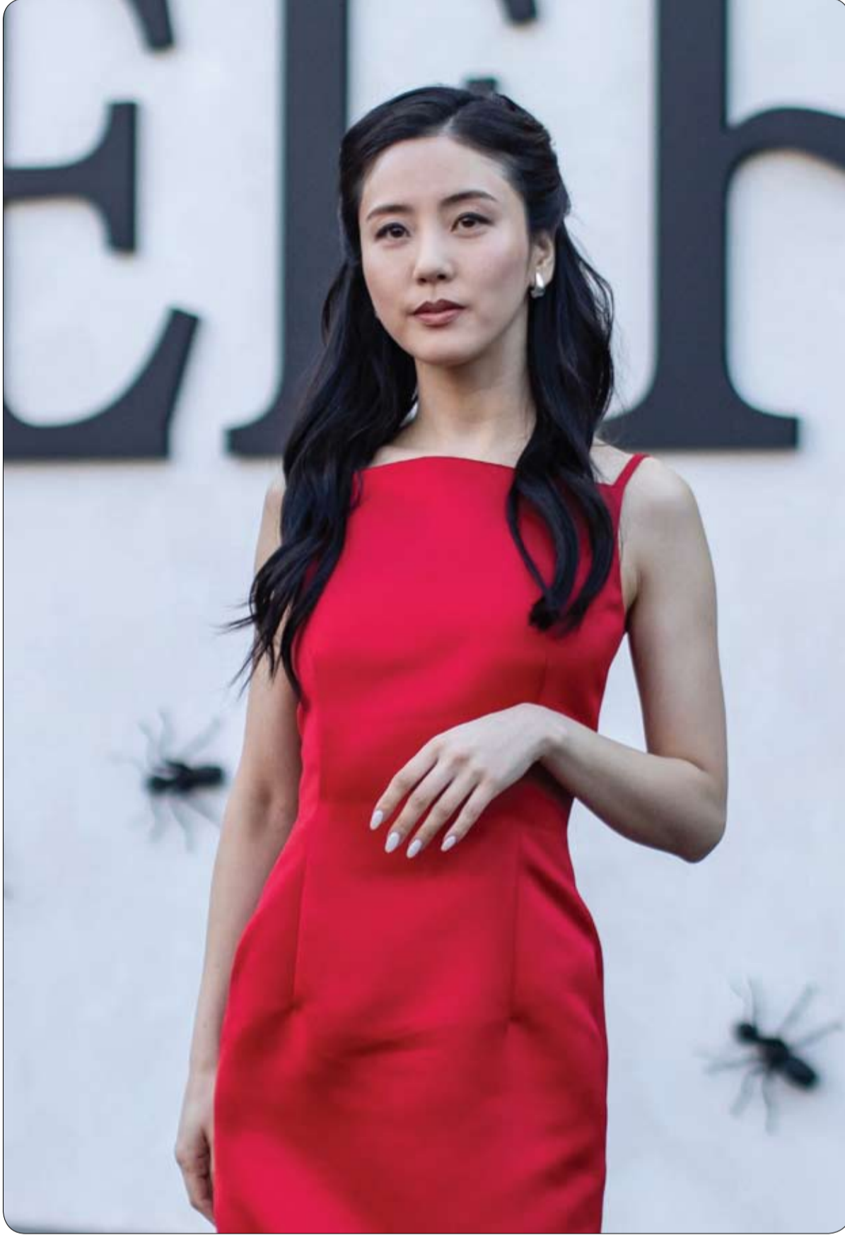
الممثلة الكورية الجنوبية سويون جايغ لدى حضورها العرض الأول للموسم الثاني من مسلسل «بيف» في المسرح المصري في لوس أنجلوس. ا ف ب

نفذ خبراء متفجرات تفجيراً تحت الأرض قنبلة من الحرب العالمية الثانية بالقرب من باريس الأحد، وفق ما أفاد مراسل فرائس برس، بعد أن قامت السلطات بإجلاء أكثر من ألف ساكن. وقام نحو 800 شرطى بتطويق الموقع في ضاحية كولومب الشمالية الغربية، حيث تم اكتشاف القنبلة للمرة الأولى في 10 نيسان-أبريل. وسمع مراسل فرائس برس دوي التفجير عند الساعة 3.20 مساءً بالتوقيت المحلي، في حين أكد مسؤولون تنفيذ التفجير في حفرة بعمق مترين. وصدر الأمر بالتفجير بعد فشل الخبراء في محاولة إزالة صاعق القنبلة التي يزيد طولها عن متر واحد باستثناء قسم الذيل. وأظهرت لقطات شظايا معدنية صدئة في قاع حفرة. وفي وقت مبكر الأحد، طلب قبل التفجير من السكان في دائرة شعاعها 450 متراً الانتقال إلى مراكز استقبال محلية. كما أغلقت بعض الطرق المحلية أمام حركة المرور ووسائل النقل العام. ولا تزال ذخائر الحرب العالمية الثانية غير المنفجرة منتشرة في جميع أنحاء أوروبا، وخاصة في ألمانيا حيث يتم اكتشاف القنابل بانتظام في مواقع البناء، رغم مرور 80 عاماً على انتهاء الحرب.