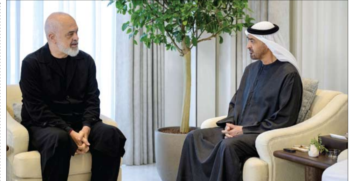
رئيس الدولة خلال مباحثاته مع رئيس وزراء ألمانيا (وام)

مدارس الدولة تستقبل الطلبة مع استئناف التعليم الحضوري محمد بن راشد ومنصور بن زايد: الإمارات لا تقف عند التحديات ولا تقف عن التعلم والتعليم دبي- الفجر: صاحب السمو الشيخ محمد بن راشد آل مكتوم نائب رئيس الدولة رئيس مجلس الوزراء حاكم دبي رعاه الله، في تدوينة على حساب سموه الشخصي على منصة (إكس): يستأنف أبنائنا وبناتنا الطلبة الدراسة الحضورية في كافة جامعاتنا ومدارسنا.. بعد أن أثبتت منظومتنا التعليمية قدرتها الاستثنائية على استمراريته الكاملة في ظل الظروف التي مرت بها المنطقة. رسالتي إلى الطلبة والطالبات: نحن دولة لا تقف عند التحديات.. نحن دولة لا تقف عن التعلم والتعليم.. نحن دولة لا تقف مسيرتها ولا تتعطل تنميتها. نحن دولة تراهن عليكم وتصنع مستقبلها بكم ومعكم ومن أجلكم. من جانبه قال سمو الشيخ منصور بن زايد آل نهيان، نائب رئيس الدولة، نائب رئيس مجلس الوزراء، رئيس ديوان الرئاسة، في تدوينة على حساب سموه الشخصي على منصة (إكس): نؤمن بأن التعليم لا يتوقف، وأن التحديات تواجه بالإرادة والتخطيط. وبدعم القيادة الرشيدة، نضمن استمراريته في جميع الظروف. كل التوفيق لأبنائنا وبناتنا الطلبة، ونتمنّى جهود الكوادر التعليمية والإدارية وتنمى لهم دوام التوفيق في أداء رسالتهم.