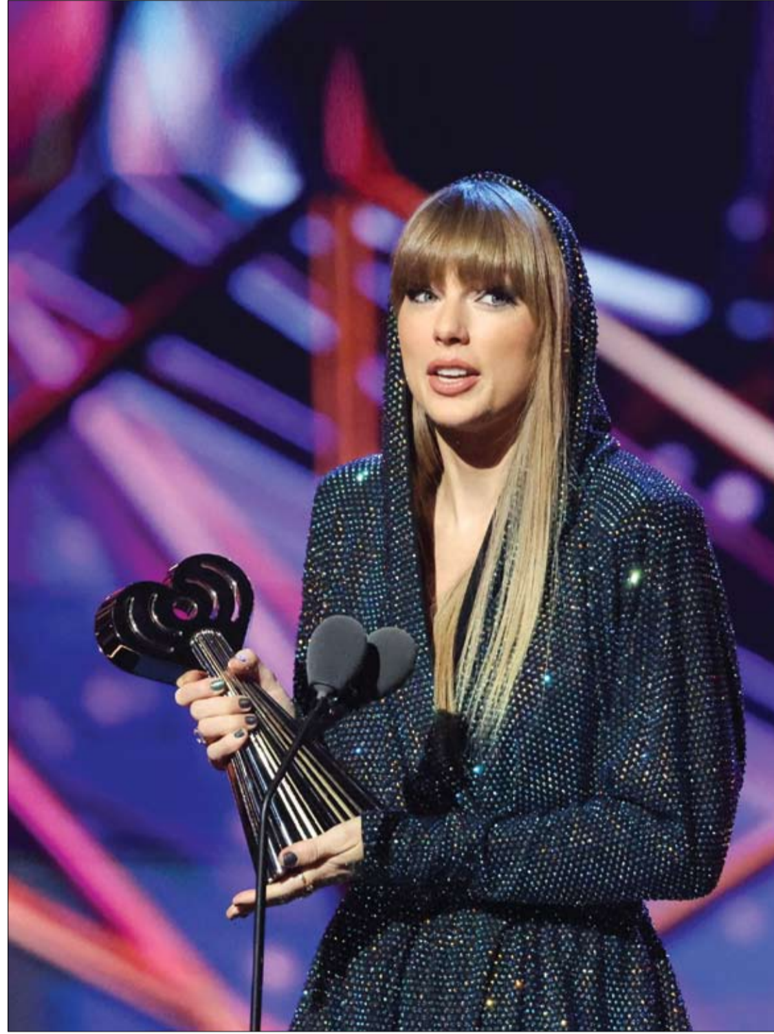
تاييلور سويتز تحمل جائزتها في حفل توزيع الجوائز iHeartRadio Music في لوس أنجلوس.