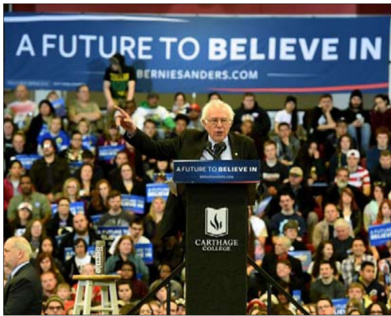
يسار وشباب الحزب الديمقراطي غاضب

الفجر - فريدريك أوتران - ترجمة خيرة الشيباني