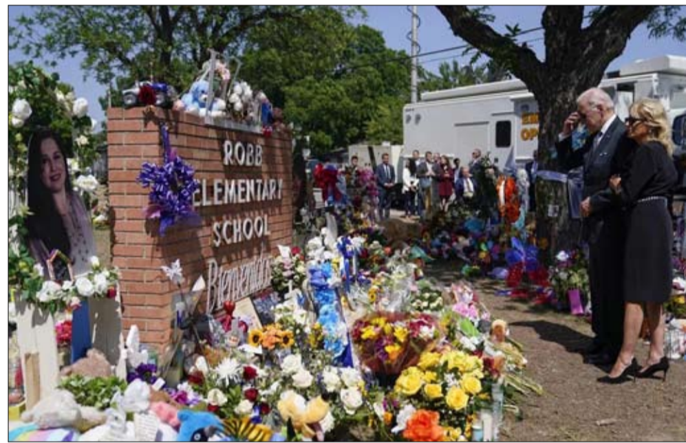
مدابيح داخلية تزيد بايدين هشاشة