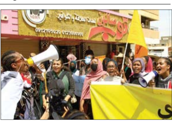
نساء سودانيات يتظاهرن في شوارع العاصمة الخرطوم ضد الحكم العسكري.

وأوضح أن من يصنع الخلاص هو الوضع وحده دون سواه، وأنه لا بد من أن يدرك الشعب أن معاناته لن يشعر بها سواه وأنه أن الأوان ليتولى زمام أمره بنفسه، وأن العصاة السحرية الوحيدة السائرة على قلب الموازين لصالحه هي إرادته الحرة.