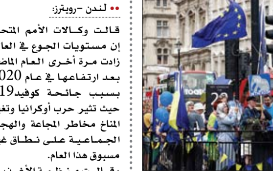
متظاهرون يحتجون ضد رئيس الوزراء البريطاني، في لندن.

كما وجه حزب العمال اتهامات إلى جونسون بالتغطية على مسؤول حكومي متهم بالتحرش. وأعلن وزير الدولة لشؤون الأطفال والعائلات، ويل كوينس، استقالته بقوله إنه لرب لديه خيار آخر بعدما نقل بحسن نية معلومات إلى وسائل الإعلام حصل عليها من مكتب رئيس الوزراء، وتبين أنها غير صحيحة.