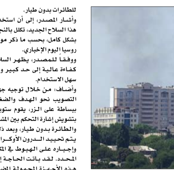
الدخان يتصاعد بعد قصف في دونيتسك، أوكرانيا.

ولطائرات بدون طيار. وأشار المصدر، إلى أن استخدام هذا السلاح الجديد، تكفل بالنجاح بشكل كامل، بحسب ما ذكر موقع روسيا اليوم الإخباري. ووفقاً للمصدر، وتتحقق مصالح كفاءة عالية إلى حد كبير وهو سهل الاستخدام. وأضاف: من خلال توجيه جهاز التصويب نحو الهدف والضغط ببساطة على الزر، يقوم ستوربر بتشويش إشارة التحكم بين المشغل والطائرة بدون طيار، وبعد ذلك يتم تحييد السدرون الأوكراني وإجباره على الهبوط في المكان المحدد. لقد باتت الحاجة إلى هذه الأجهزة المحمولة المضادة للدرونات واضحة، بسبب العدد الكبير من الطائرات بدون طيار ومختلف المروحيات الصغيرة التي يستخدمها جيش أوكرانيا. ولم يحدد محاور المصدر، المكان الذي تم استخدام فيه هذا السلاح الجديد، لكنه أشار إلى استخدامه لأول مرة خلال العملية العسكرية الروسية في غرب جمهورية دونيتسك الشعبية.