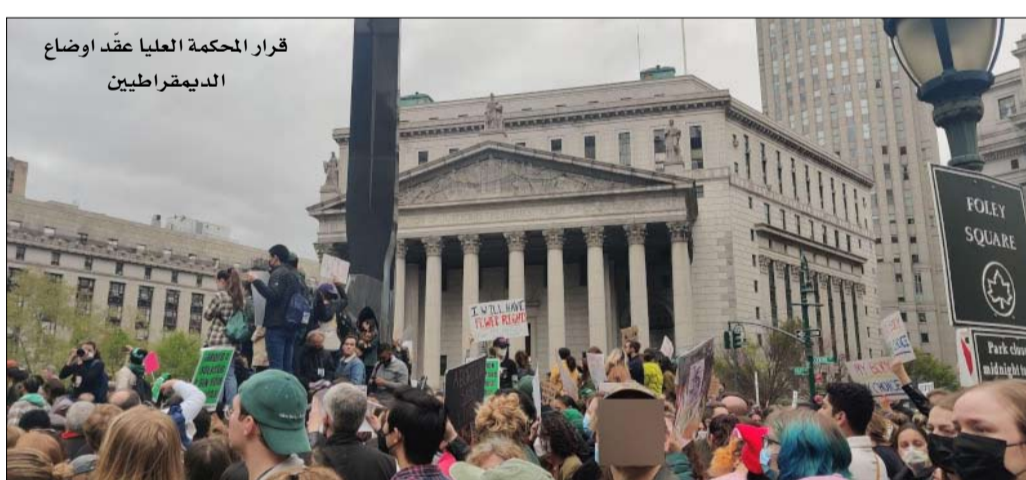
قرار المحكمة العليا عقد اوضاع الديمقراطية

علامة أخرى على ضعفه السياسي، يستمر الجدل حول المستقبل السياسي لجو بايدين، 79 عاماً، في التضخم. "السؤال الكبير بالنسبة للديمقراطيين، هو ما إذا كان الرئيس بايدين سيتنحى أو سيمسعى لإعادة انتخابه، يلخّص داريل إم ويست، نائب رئيس معهد بروكينغز، وهو مؤسسة فكرية أمريكية. وتتزايد الدعوات الخفية أو المباشرة لأكبر رئيس في تاريخ الولايات المتحدة سنّاً، للتخلي عن الترشح لولاية ثانية. "جو بايدين يجب ألا يرشح نفسه مرة أخرى، يجب