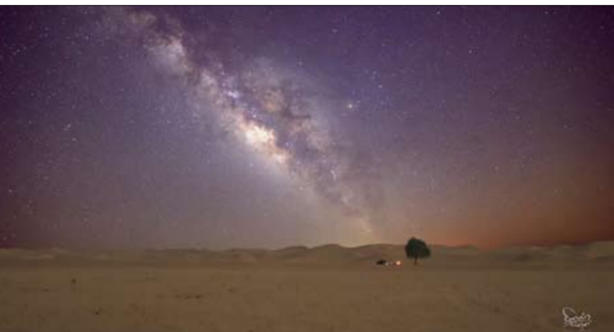
بالتعريض هو كمية الضوء التي يسمح باسقاطها على الشريحة الفوتوغرافية الحساسة للضوء خلال عملية التصوير عبر ضبط اتساع فتحة العدسة وسرعة الغالق وحساسية المستشعر الضوئي الذي