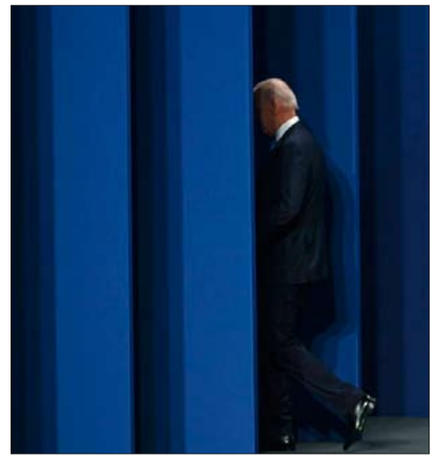
جو بايدين غروب قبل الاوان

أن يمرر المشعل إلى شخص مستعد وقادر على القتال من أجلنا"، هكذا غردت الناشطة في مجال حقوق المرأة ليندي بويلان.