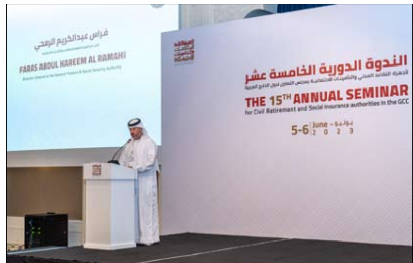
تحت عنوان (أدوات الاستثمار الفعالة)