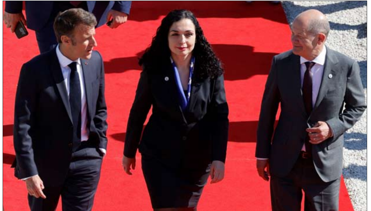
الرئيس الفرنسي ورئيسة كوسوفو والمستشار الألماني قبل قمة المجموعة السياسية الأوروبية في مولدوفا

هل ستكون للمهلة الأوروبية لكي تصرخ منددة بالعدوان على الأقلية الصربية في كوسوفو، 120.000 شخصاً أو 6% من السكان، وتضع جيشها في حالة تأهب قصوى. هذا الإجراء، مجرد مسرحية، كما يؤكد لويك تريجوريس - كان له تأثير في إحياء شبح الصراع في البلقان ولجعل الرعاية الغربية يتفاعلون مع الأحداث. وهكذا، على هامش انعقاد المجلس الأوروبي ببرائيسلاف، قام إيمانويل ماكرون و المستشار الألماني، أولاف شولتز، بلي ذراع رئيسة الكوسوفو والرئيس الصربي، ألكسندر فوتشيتش، من خلال طلب تنظيم انتخابات بلدية جديدة. تقول تيفتا كلمندي، الباحثة في المجلس الأوروبي للعلاقات الخارجية.. "منطقياً، ينبغي على رؤساء