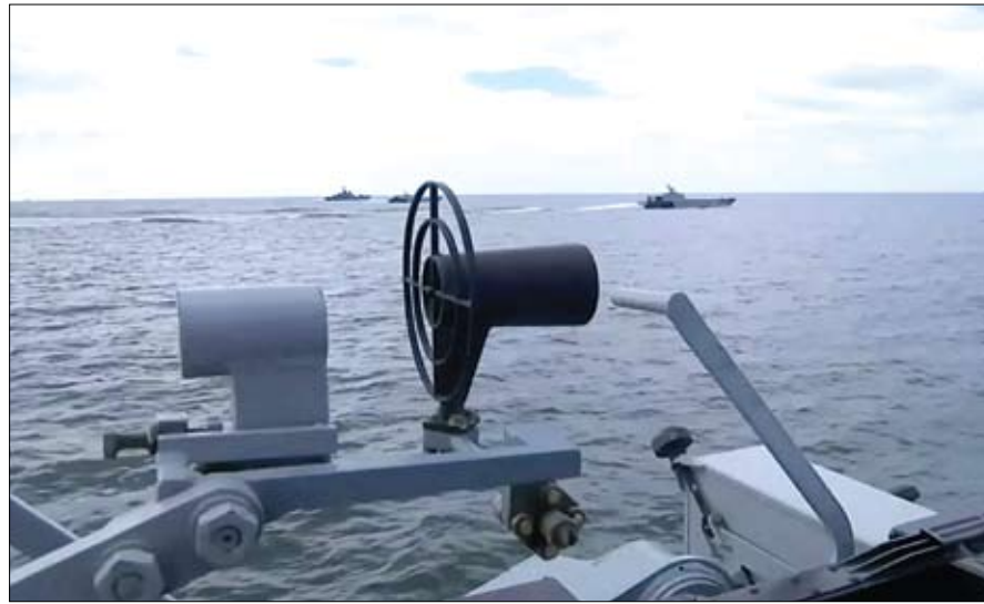
سفن حربية روسية تشارك في مناورات بحرية في بحر البلطيق.

وحت بريغوجين القادة في الجيش الروسي، بمن فيهم وزير الدفاع سيرغي شويغو ورئيس الأركان العامة، فاليري جيراسيموف، على القدوم إلى الخطوط الأمامية. وأضاف: تعالوا، يمكنكم أن تفسلوا ذلك! من جهته، قال قائد القوات البرية الأوكرانية أولكسندر سيرسكي، الإثنين، إن عناصره تواصل التقدم بالقرب من المدينة. وأضاف أن القوات الأوكرانية نجحت في تدمير موقع روسي هناك، إلى ذلك، قالت روسيا أمس الاثنين إنها بدأت مناورات عسكرية بحرية في بحر البلطيق بعد يوم من بدء دول حلف شمال الأطلسي المناوئ لمناوراتهم السنوية