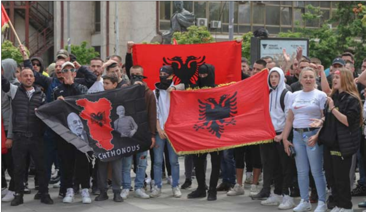
ألبان كوسوفو يحملون الأعلام الألبانية خلال مظاهرة في جنوب ميتروفيشتا

مطلع الأسبوع، أعلن الجيش الأميركي أن فرقاطة صينية نفذت مناورة "خطيرة" أمام بارجة أميركية تبحر قرب مضيق تايوان. حدث هذا بعد أيام قليلة من إعلان واشنطن اعتراض طائرة مقاتلة صينية لطائرة استطلاع أميركية كانت تجري مسحاً فوق بحر الصين