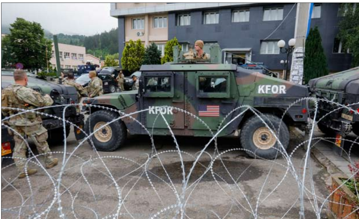
جنود الولايات المتحدة في قوة كوسوفو بقيادة الناتو

المختص في البلقان لويك تريجوريس أن "نوبات التوتر هذه منتظمة ومن المحتمل أن تحدث مرة أخرى في المستقبل. لا يريد الغربيون فتح جبهة ثانية، إلى جانب أوكرانيا، في أوروبا ويفعلون كل ما في وسعهم لخفض التوتر. لكن هذا لا يحل المشاكل الأساسية". درجة عنف غير مسبوقة. وإذا ما كانت المواجهات قد بلغت