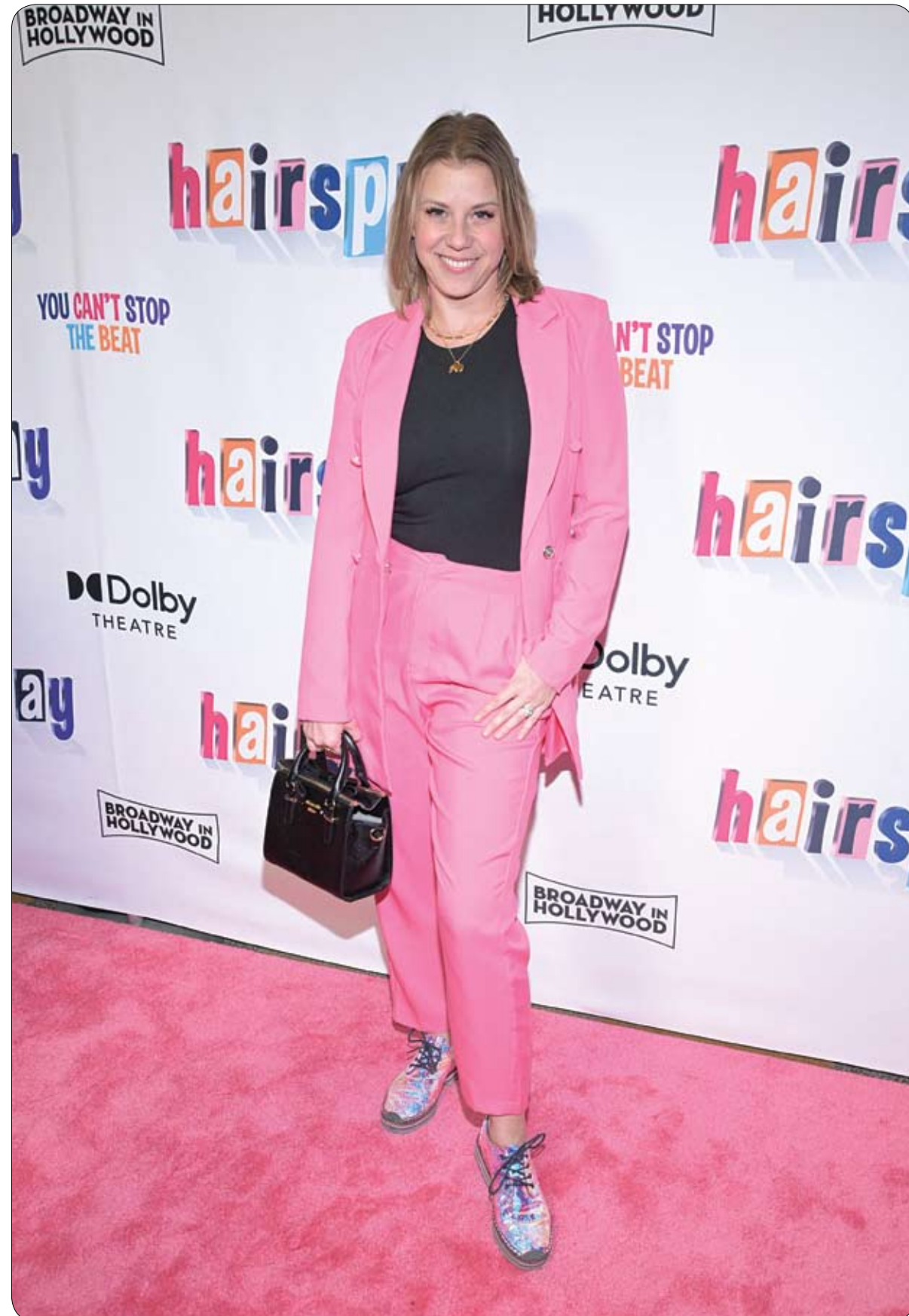
الممثلة جودي سويتين لدى حضورها العرض الليلي الافتتاحي للمسرحية الموسيقية، مثببات الشعر، في لوس أنجلوس.

بالرغم من سكنه بوضع مزر بلا ماء ولا كهرباء ولا إنترنت، يرفض أن يطلق عليه تسمية "مشرد"، ويعتبر المكان واحة أمل وسط كتبه التي تؤنس وحشته وتزيد ثقافته. يمتد في طعامه على ما تقدمه له بعض الجمعيات والميسورين، فيما يقصد محطة وقود مجاورة له للاستحمام. ويمضي المغربي أيامه في مطالعة الكتب وترتيبها، وعلى وجه ابتسامة لا تفارقه، وتظهر جليا في أثناء حواراته مع الذين يقصده من محبي الروايات والباحثين عن كتب نادرة أو قديمة بأسعار رخيصة.