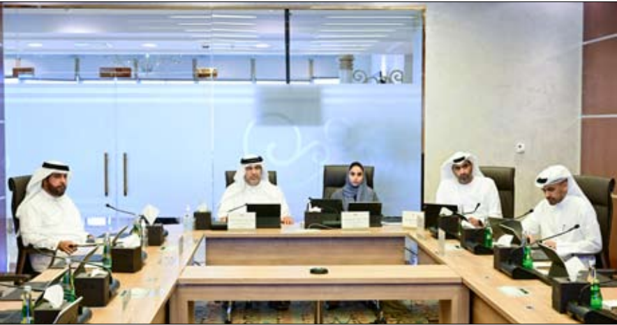
من التنفيذ وفقاً لسياسات معتمدة في الأسواق المحلية والإقليمية والعالمية، وزيادة الإنتاجية وتحسين جودة الخدمات العامة.

حصلت دائرة القضاء في أبوظبي، على شهادة المطابقة العالمية بوصفها "الأيزو 29993:2017" في مجال إدارة التعلم والتدريب خارج إطار التعليم الرسمي، التي يمنحها المعهد البريطاني للمعايير "BSI"، لتكون بذلك أول جهة تتمكن من تحقيق هذا الإنجاز على مستوى تنفيذ العمليات التدريبية المؤسسية في إمارة أبوظبي. وأفاد سعادة المستشار يوسف سعيد العبري، وكيل دائرة القضاء في أبوظبي، بأن الحصول على شهادة الأيزو في مجال التدريب والتأهيل، يعكس نجاح الجهود المبذولة في تنمية رأس المال البشري، تنفيذاً للرؤية الحكيمة لصاحب السمو الشيخ محمد بن زايد آل نهيان، رئيس الدولة، "حفظه الله"، وتماشياً مع التوجيهات السديدة لسمو الشيخ منصور بن زايد آل نهيان، نائب رئيس الدولة، نائب رئيس مجلس الوزراء، وزير ديوان الرئاسة، رئيس دائرة القضاء، بإعادة كوادرو وطنية مدربة ومؤهلة تأهيلاً علمياً، بما يدعم العمليات التطويرية للمنظومة القضائية، ودورها في تعزيز المكانة التنافسية لإمارة أبوظبي. وأكد حرص دائرة القضاء على اعتماد أعلى المعايير المطبقة عالمياً في مختلف القطاعات، بما يدعم الجهود الرامية إلى رفع كفاءة الأداء، وضمان الارتقاء بمستويات الجودة في الخدمات القضائية والعقدية، في ظل الاهتمام بتنمية قدرات ومهارات الموارد البشرية، باعتبارها العنصر الرئيس والفاعل في عملية التنمية المستدامة والتطوير المستمر، بما يحقق التوجهات الاستراتيجية لحكومة أبوظبي للوصول إلى الريادة عالمياً. ومن جانبه، أكد أحمد إبراهيم المرزوقي، المدير