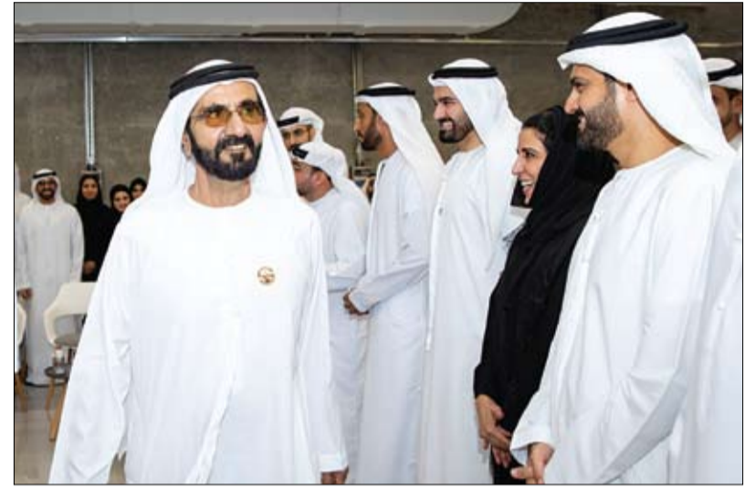
ترأس جلسة عصاف ذهني سنوية مع فريق عمله