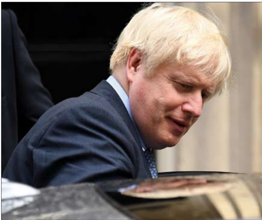
بوريس جونسون.. لا بد من الانتخابات ولو طال السفر