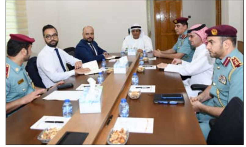
•• رأس الخيمة - الفجر

أكد اللواء على عبد الله بن علوان النعيمي قائد عام شرطة رأس الخيمة، على أهمية ودور الموارد البشرية بمختلف أشكالها في تحقيق أهداف العمل القاضي إلى تطوير وإدارة رأس المال البشري وفق أفضل الممارسات والمعايير العالمية، وتدعيم مفاهيم الثقافة المؤسسية التي تركز على التحفيز والإنتاجية، وتطوير سياسات وأنظمة وإجراءات عمل الموارد البشرية لضمان الاستدامة في الأداء، وبناء شراكات داخلية وخارجية في مجالها، مؤكداً أن وزارة الداخلية تعمل بجد على تعزيز مبدأ تطوير منظومة الموارد البشرية في إطار سعيها المستمر وبحرص للارتقاء بالخدمات المقدمة لمنتسبيها،