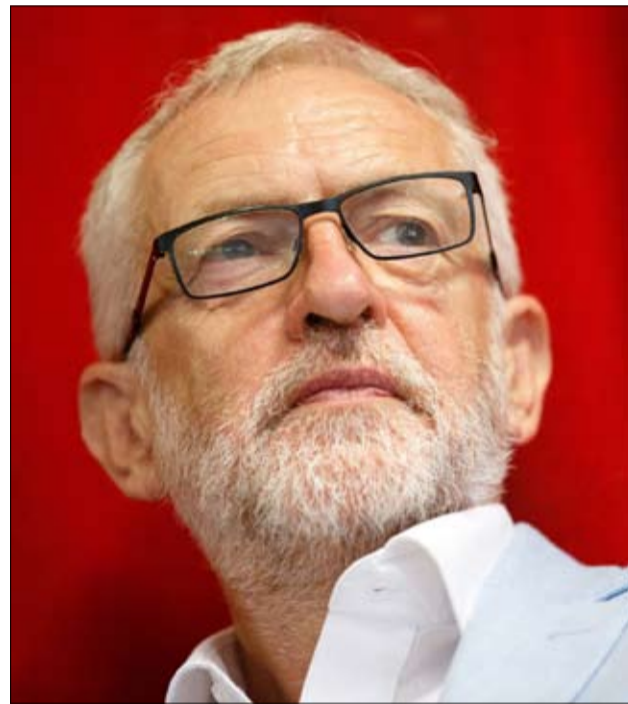
لا انتخابات بدون موافقة حزب العمال

إنها استراتيجية الجديدة. ظل رئيس الوزراء البريطاني بوريس جونسون يضغط منذ عدة أيام لتنظيم انتخابات مبكرة يوم الثلاثاء 15 أكتوبر، أي قبل المجلس الأوروبي يومي 17 و18 أكتوبر، وخاصة قبل تاريخ 31 أكتوبر..