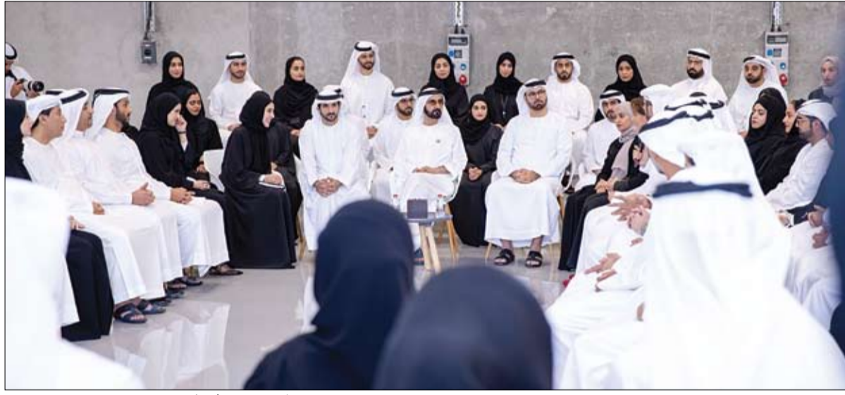
محمد بن راشد خلال ترؤسه جلسة العصف الذهني السنوية مع فريق عمله (وام)

تبادلت موسكو وكييف 70 سجيناً السبت، في عملية تاريخية وصفها الرئيس الأوكراني فولوديمير زيلينسكي بالخطوة الأولى نحو إنهاء النزاع بين البلدين. وهبطت طائرتان تحملان 35 سجيناً من كل جانب في كل من موسكو وكييف، وسط تصفيق أقاربهم الذين كانوا بانتظارهم. وقال زيلينسكي بعدما عانق السجناء السابقين في مطار بوريسبيل في كييف قمناً بالخطوة الأولى علينا استكمال جميع الخطوات لإنهاء هذه الحرب البشعة. وبين المشمولين في عملية التبادل 24 بحاراً أوكرانياً والمخرج الأوكراني أوليغ سينتسوف والصحافي الروسي كيريلو فيشنسكي. وأكد جهاز الاستخبارات الروسي الإفراج عن فلاديمير تسيسماخ، وهو مقاتل في صفوف الانفصاليين المدعومين من روسيا.