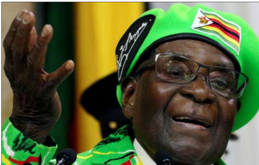
موغابي طموح زوجته اسقطه من عرشه

•• الفجر - خيرة الشيباني غريس موغابي تبكي رحيل زوجها، روبرت موغابي، الرئيس السابق لزيمبابوي. ولئن كانت مغامرات السيدة الأولى قد تصدرت عناوين الصحف لفترة طويلة، فإن طموحاتها السياسية هي التي كلفت زوجها الرئاسة في نوفمبر 2017. بعد أكثر من 37 عاماً في السلطة، وأجبرته على الاختفاء عن شاشات الرادار. وُلدت في جنوب إفريقيا لوالدين من زيمبابوي، عيّنت غريس موغابي سكرتيرة في رئاسة هراري وهي في سن العشرين، وأصبحت عشيقة روبرت موغابي بينما كانت زوجة الرئيس الأولى تموت تدريجياً بسبب السرطان.