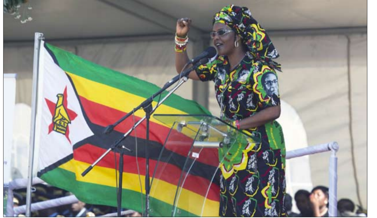
على نفسها جنت براقش