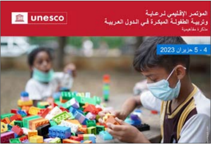
تجربة إمارة الشارقة في رعاية الطفولة المبكرة للخروج بمنظومة متضامنة تعزز الشراكة الإقليمية من أجل قضية الطفولة المبكرة لتلارتقاء بسياسات وبرامج مبتكرة عالية الجودة.

وتعدد القطاعات والتنسيق. ويعتبر المؤتمر مؤسراً مبرشاً ينتاج وتوصيات راجعة إيجابية لاسيما في مجال زيادة الاستثمار والاطلاع على