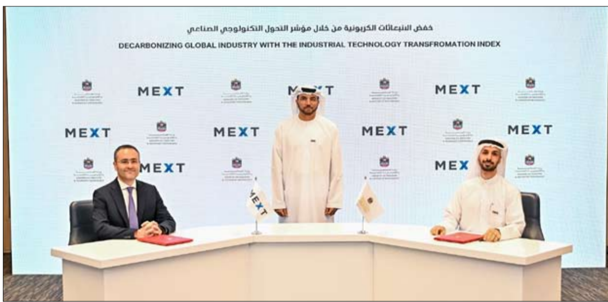
خمس البعثات الكربونية من خلال مؤشر التحول التكنولوجي الصناعي DECARBONIZING GLOBAL INDUSTRY WITH THE INDUSTRIAL TECHNOLOGY TRANSFORMATION INDEX

ويعتقد أن توقيع مذكرة التفاهم على هامش فعاليات منتدى "صنع في الإمارات" بحضور سعادة عمر صوينع السويدي، وكيل وزارة الصناعة والتكنولوجيا المتقدمة؛ ووقّع مذكرة التفاهم نيابة عن الوزارة طارق الهاشمي، مدير إدارة تبنى وتطوير التكنولوجيا، وممثل MEXT في التوقيع إيجي إردم، المدير التنفيذي لـ MEXT.