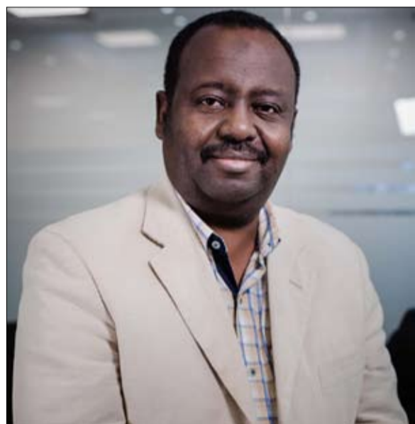
نجم الدين هاشم، المنتج المنفذ لبرنامج منشد الشارقة