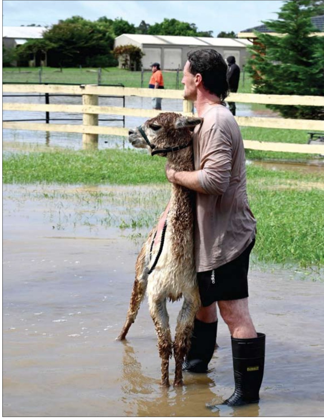
رجل ينقذ حيوان لاما من منزل في مزرعة، غمرته المياه في غرب سيدني، حيث تواجه المنطقة أسوأ

وتشمل هذه النصائح اتباع نظام غذائي غني بالفيتامينات والعناصر الغذائية، والنوم الجيد، والتمارين الرياضية، وتدريب الدماغ، وإجراء الفحوصات الصحية.