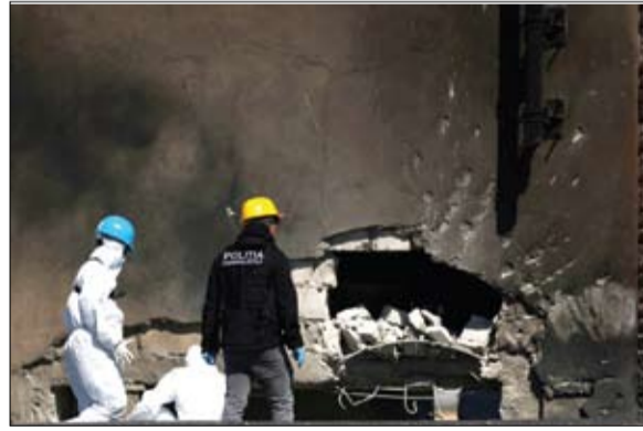
محققون رومانيون يعملون في موقع انفجار استهدف بمسيرة.

خاصة على حدودنا الشرقية، ستواصل زيادة الضغط على روسيا. وقال بنجامين حداد الوزير الفرنسي المكلف بشؤون أوروبا الجمعة إن واقعة سقوط طائرة مسيرة روسية في رومانيا تؤكد أن روسيا تشكل تهديداً للأمن الأوروبي. وأردف حداد بقول لإذاعة «آر. إم. سي» الفرنسية «لم نتجاهم روسيا أوكرانيا فقط، وإنما هددت أيضاً البنية الأمنية الأوروبية. سقطت طائرة مسيرة روسية في رومانيا مرة أخرى الليلة الماضية.. وأشار أيضاً إلى أن لدينا قوات فرنسية متمركزة في رومانيا في إطار عمليات حلف شمال الأطلسي للطمأنة، وتحديداً لإظهار دعمنا لسيادة شركائنا في أوروبا.