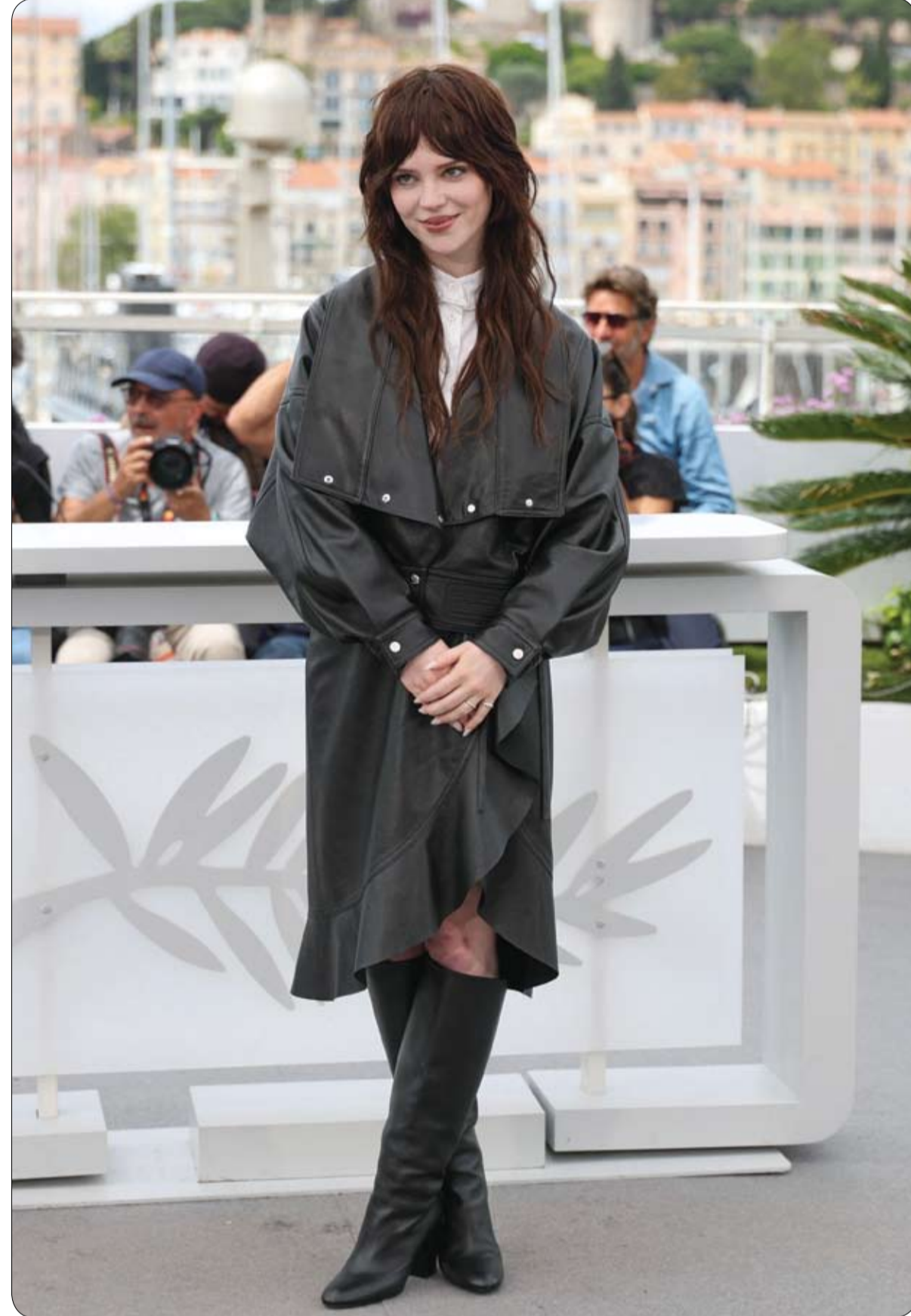
الممثلة الأمريكية صويي تاتشر خلال جلسة تصوير لفيلم «جيهيما الخاص»، في الدورة التاسعة والسبعين لهرجان كان السينمائي.

أعلنت السلطات الكورية الجنوبية عن اعتقال «يوتوبس» بارز بتهمة الفبركة وتشويه سمعة الممثل الشهير «كيم سو-هيون». عبر استخدام تقنيات الذكاء الاصطناعي لتلفيق أدلة نسبت في تدمير المسيرة المهنية للنجم الكوري. أصدرت محكمة منطقة سيؤول المركزية أمراً باعتقال المدعو «كيم سي-أوي»، الذي يدير قناة فضائية المشاهير الشهيرة Hover Lab، التي تحظى بنحو مليون مشترك. وجاء القرار خوفاً من احتمالية تدميره للأدلة أو هروبه.