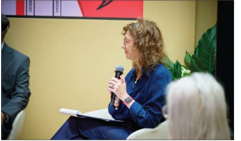
ضمن فعاليات الشارقة ضيف شرف وارسو الدولي للكتاب