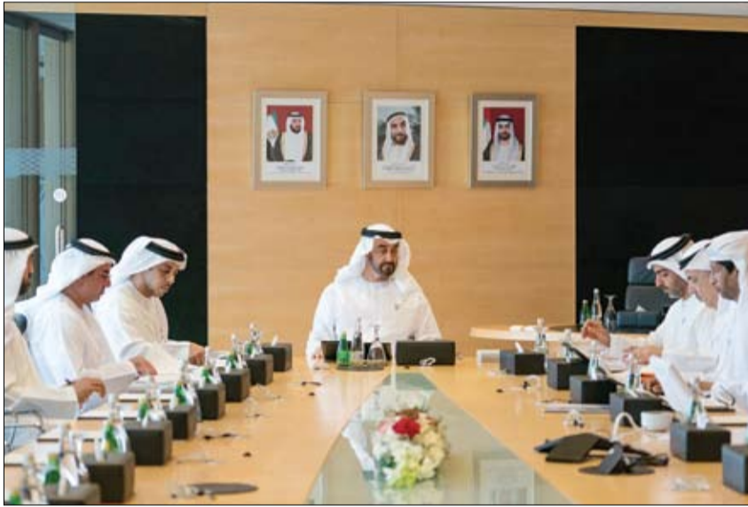
محمد بن زايد خلال تروؤسه اجتماع مجلس إدارة جهاز أبوظبي للاستثمار