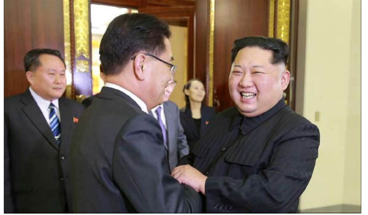
التقارب فتاعة ام مسرحية؟