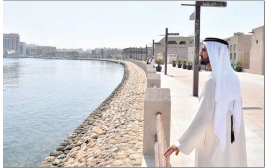
محمد بن راشد خلال تفقده مشروع تطوير منطقة الشندغة (وام)