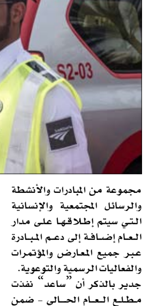
مطلع العام الحالي - ضمن

أطلقت شركة "ساعد" للأنظمة المرورية حملة "زايد باق في قلوبنا" تجاوباً مع المبادرة الوطنية التي أعلنها صاحب السمو الشيخ خليفة بن زايد آل نهيان رئيس الدولة "حفظه الله" بجعل عام 2018 "عام زايد". وأكد المهندس إبراهيم رمل الرئيس التنفيذي لشركة "ساعد" .. أن مبادرة "عام زايد" هي مناسبة وفاء لرجل عظيم تحتفل فيها وبكل فخر بعمقها المؤسس الشيخ زايد بن سلطان آل نهيان "رحمه الله" وإنجازاته وورثته في الدولة وحول العالم ونجد في هذه الاحتفالية الوطنية قيم وموروثات العطاء والإنسانية في أفعالها التي نقشت مجتمعة اسم زايد بحروف