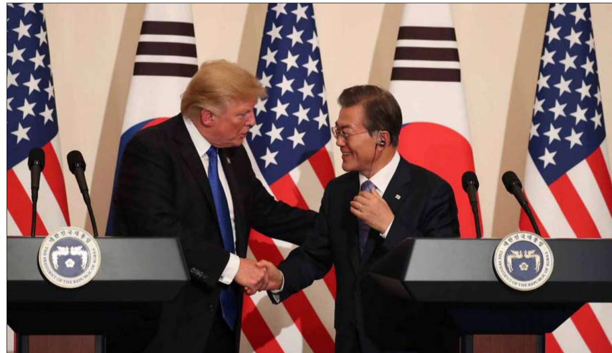
هل هو التشرخ بين مون وترامب..

في هذه المرحلة بما انه لا يضع في الميزان التقدم الباليستي النووي المدهش الذي حققته التجارب في السنوات الأخيرة. في واشنطن، يرى العديد من الخبراء في ما يحدث مناورة تكتيكية بحثة لربح الوقت وتخفيف قبضة العقوبات على