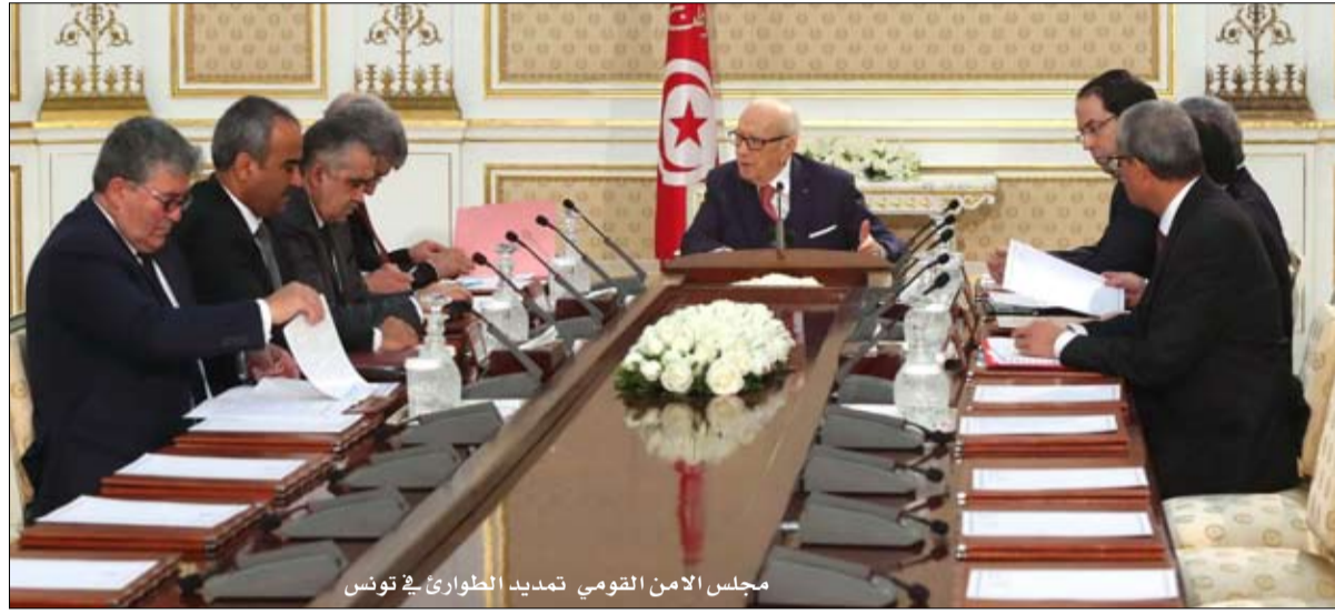
مجلس الامن القومي لتمديد الطوارئ في تونس

قرر الرئيس التونسي، الباجي قايد السبسي، بعد التشاور مع رئيس الحكومة ورئيس البرلمان، التمديد في حالة الطوارئ بكامل البلاد، لمدة سبعة أشهر كاملة على غير العادة، ابتداء من 12 مارس الجاري، وذلك لدى إشرافه الثلاثاء، على اجتماع مجلس الأمن القومي الذي استعرض "تقييما للأوضاع الأمنية داخليا وإقليميا وآخر