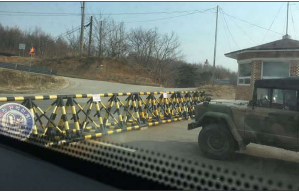
هل ستفنى الحواجز بين الكوريتين؟