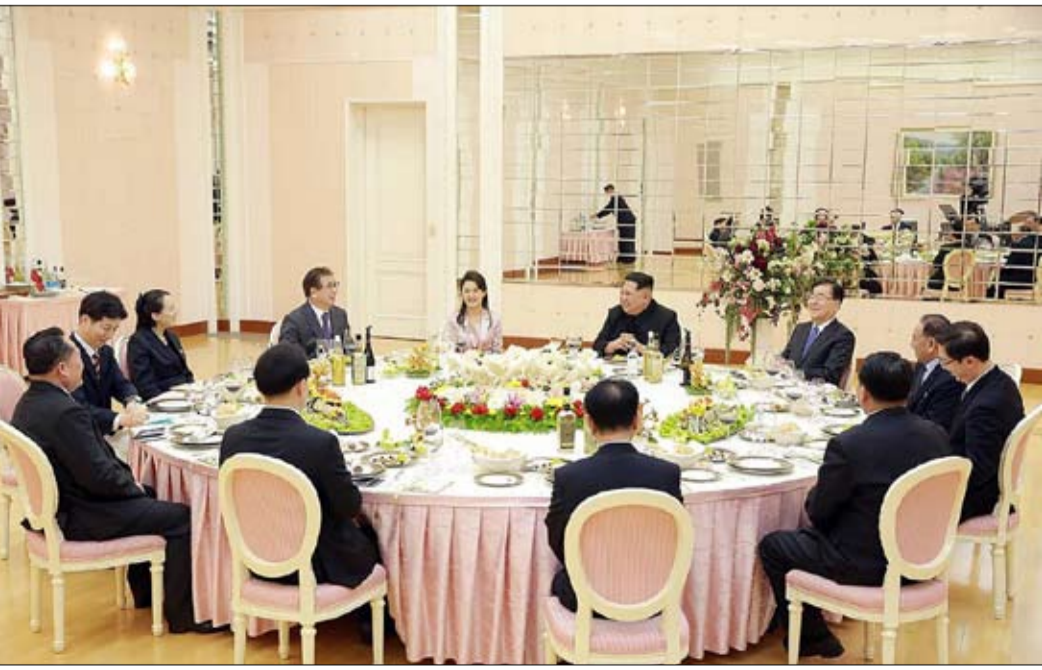
عشاء فاخر يوحي بعهد كوري جديد..ولكن