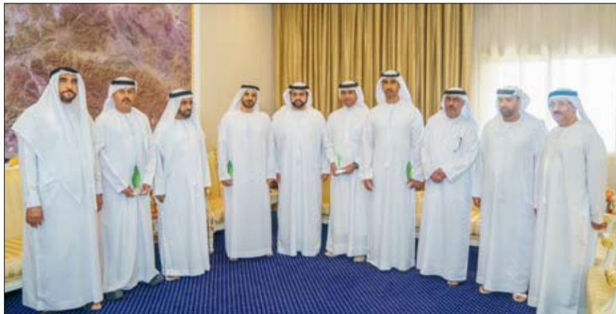
المقدمة لهم، ما يسهم في تعزيز مسيرة العمل التنموي المستدام بالدولة على جميع الأصعدة، واطلع

التي تسهم في توفير حياة كريمة للمواطنين، وتمكينهم إيجابياً في المجتمع، وتطوير جودة الخدمات