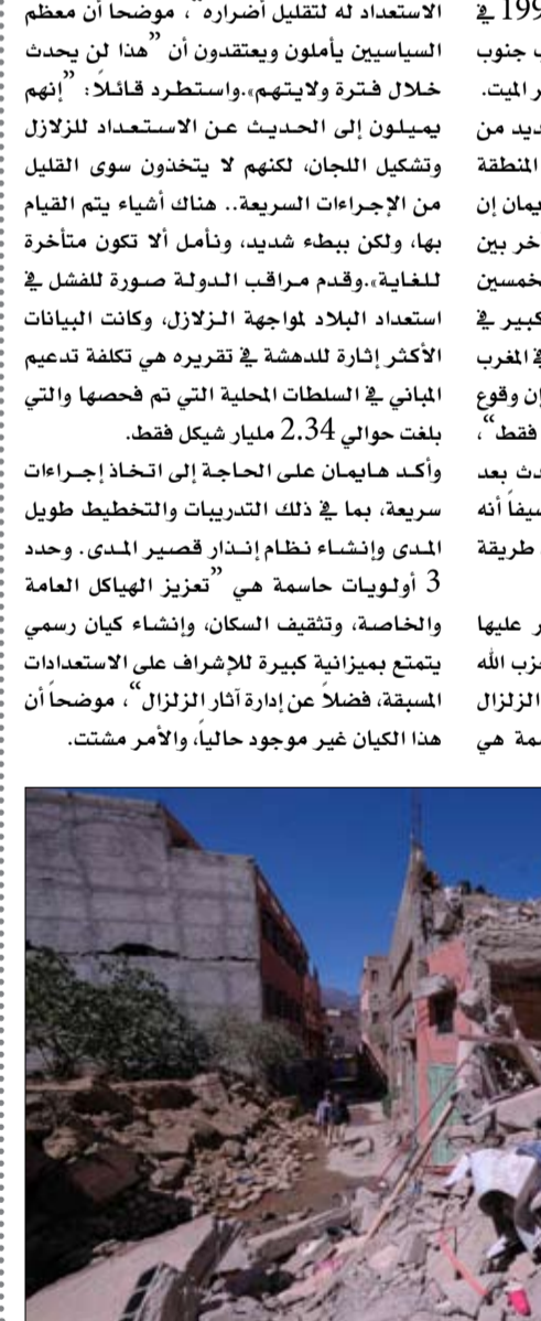
الاستعداد له لتقليل أضراره"، موضحاً أن معظم السياسيين يأملون ويعتقدون أن "هذا لن يحدث خلال فترة ولايتهم.. واستطرد قائلاً: "إنهم يميلون إلى الحديث عن الاستعداد للزلزال وتشكيل اللجان، لكنهم لا يتخذون سوى القليل من الإجراءات السريعة.. هناك أشياء يتم القيام بها، ولكن ببطء شديد، ونأمل ألا تكون متأخرة للغاية.. وقد مراقب الدولة صورة للفشل في استعداد البلاد لمواجهة الزلازل، وكانت البيانات الأكثر إثارة للدهشة في تقريره هي تكلفة تدعيم المباني في السلطات المحلية التي تم فحصها والتي بلغت حوالي 2.34 مليار شيكل فقط. وأكد هايمان على الحاجة إلى اتخاذ إجراءات سريعة، بما في ذلك التدريبات والتخطيط طويل المدى وإنشاء نظام إنذار قصير المدى. وحدد 3 أولويات حاسمة هي "تعزيز الهياكل العامة والخاصة، وتنقيف السكان، وإنشاء كيان رسمي يتمتع بميزانية كبيرة للإشراف على الاستعدادات المسبقة، فضلاً عن إدارة آثار الزلزال"، موضحاً أن هذا الكيان غير موجود حالياً، والأمر مشتت.

كان يقو 6 درجات أو أكثر ووقع في عام 1995 في منطقة إيلات، ولم يسبب دماراً لأنه ضرب جنوب وليس شمال إيلات في منطقة منتج البحر الميت. وقالت "جيروزايم بوست"، إن هناك العديد من الزلازل الصغيرة التي يشعر بها الناس في المنطقة وتحدث بشكل منتظم، ومع ذلك، قال هايمان إن هناك احتمالا كبيرا بحدوث زلزال قوي آخر بين جنوب لبنان وجنوب البحر الميت خلال الخمسين عاما القادمة. وأضاف أن "وقع زلزال كبير في إسرائيل ليس مسألة إذا بل متى، الكارثة في المغرب هي بمثابة إشارة تحذير أخرى لإسرائيل، إن وقوع زلزال كهذا، أو ربما أقوى، هو مسألة وقت فقط". موضحاً أن الزلزال القادم يمكن أن يحدث بعد 10 دقائق أو 10 أو 20 أو 50 عاماً، مضيفا أنه حتى مع كل التكنولوجيا الجديدة، لا توجد طريقة للتنبؤ بزلزال. وتابع: "خلافاً للتهديدات التي يسيطر عليها البشر، مثل التهديد الإيراني أو تنظيم حزب الله اللبناني أو الانقسامات الداخلية، فإن الزلزال لا يمكن السيطرة عليه، والمسألة الحاسمة هي