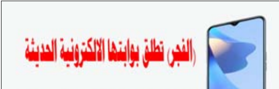
النسخ تطلق بوابتنا الإلكترونية الحديثة * سرعة في التصفح وجمالية في العرض

ويعتقد سابق الاثنين، أعلن مسؤولون في حكومة شرق ليبيا أن ما لا يقل عن ألفي شخص