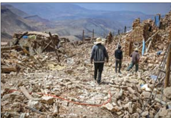
قرويون يسبرون بين أنقاض المنازل المدمرة في دوزو الغربية

بالإضافة إلى أكثر من 2562 الضحايا. يذكر أن الأمل يتضاءل في اليوم الرابع على الزلزال المدمر، فالقرى في منطقة جبال الأطلس النائية يصعب الوصول إليها. ويسابق رجال الإنقاذ الوقت بحثاً عن ناجين، لكن المشاهد من إقليم