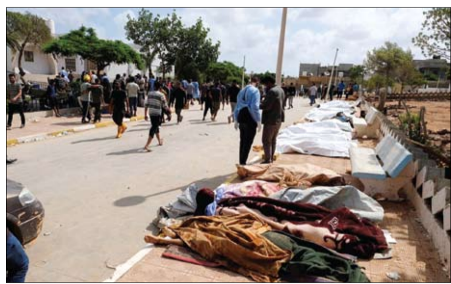
جثث ملقاة على الأرض خارج المستشفى في درنة، بعد عاصفة قوية وأمطار غزيرة ضربت ليبيا

ليبيا المدينة منطقة كوارث. ولا يزال الكثير من الجثث تحت الأنقاض في أحياء المدينة، أو جرفتها المياه في البحر. ونشر سكان درنة مقاطع مسجلة مصورة على الإنترنت تظهر الدمار الكبير وانهيار مبان سكنية بأكملها على طول وادي درنة، وهو وادي النهر الذي ينحدر من الجبال عبر وسط المدينة. كما انهارت مبان سكنية من عدة طوابق.