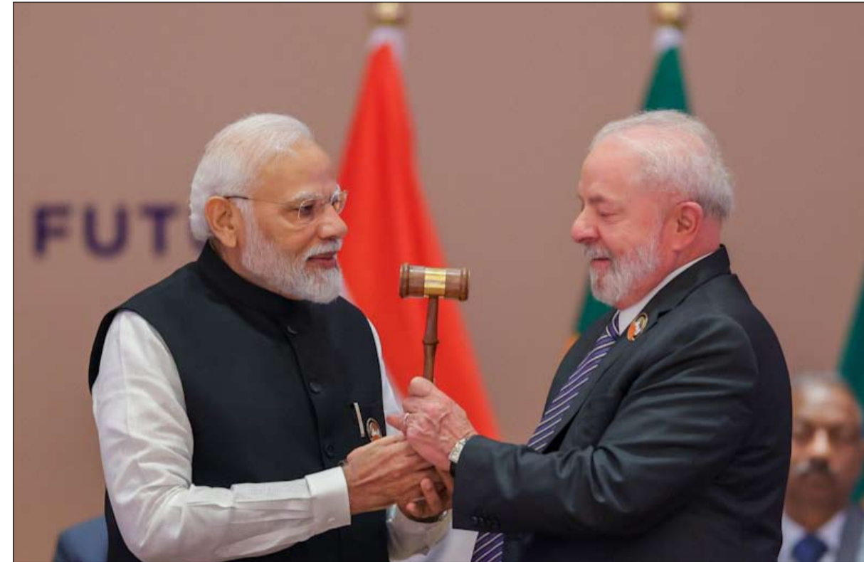
قمة العشرين.. توافق في ملفات واختلاف حول أوكرانيا