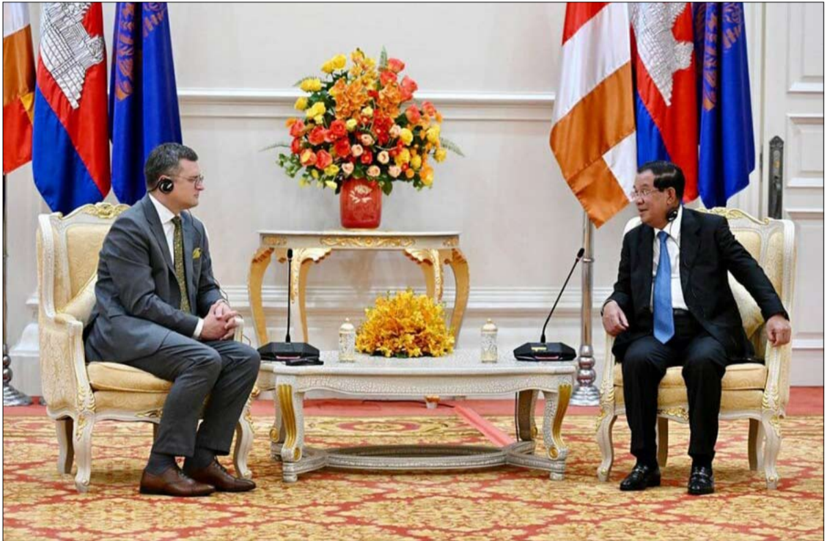
كمبوديا تلعب دوراً في محاولة لإنهاء الحرب في أوكرانيا

ليس هناك انتصار صغير. لقد تعلمت أوكرانيا في الأشهر الأخيرة، بعد أن انخرطت في هجوم مضاد صعب للغاية على جبهة الحرب التي تشنها روسيا، أن يتجه بأقل قدر من التقدم. وينطبق هذا القول المأثور أيضاً على الجبهة الدبلوماسية؛ فحين قررت دول مثل تيمور الشرقية وكمبوديا دعم أوكرانيا بإدانة العدوان الروسي، كادت كيف أن تصرخ ابتهاجاً. على عكس الجيش، الذي تم تعزيزه بشكل كبير منذ العدوان الروسي الأول في عام 2014، لم تكن الدبلوماسية الأوكرانية مستعدة للمعركة التي كان يتعين عليها خوضها على المسرح العالمي عندما عزت القوات الروسية البلاد، في 24 فبراير 2022. يوم السبت 9 سبتمبر 2022 قال أولكسندر كورنيكو، نائب رئيس البرلمان الأوكراني خلال مؤتمر يالطا السنوي للاستراتيجية الأوروبية، الذي نظمته مؤسسة فيكتور بينتشوك: "لم نتوقع على الإطلاق مثل هذا العدد من الممتنعين عن التصويت. وأدركنا أنه كان علينا أن ن فكر في استراتيجية لإقناع هذه البلدان. لم تكن لدينا سفارة في أفريقيا، ولم تكن مصالحنا ممثلة في هذه