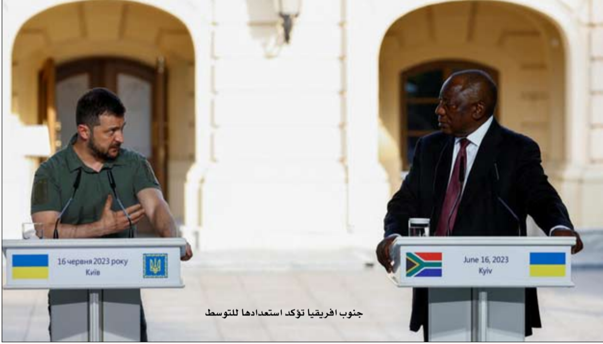
جنوب أفريقيا تؤكد استعدادها للتوسط

نظمت القمة. لقد استطاع مقابلة الهندي رقم واحد هنالك ناريندرا مودي، لكنه واجه رفضاً من الرئيس البرازيلي لولا دا سيلفا، الذي لا يزال متشدداً تجاه القضية الأوكرانية. وفي 9 و10 سبتمبر، في قمة مجموعة العشرين في نيودلهي، كانت الهند هي المضيئة واعتبر مودي أنه من الأفضل عدم دعوة زيلينسكي. واعتبرت كومفور إيرو، رئيسة مجموعة الأزمات الدولية، أن هذه الديناميكية "تحذير للغرب". ومن المؤسف أن الأمر يتطلب حرباً في أوروبا من أجل هذا الأمر.