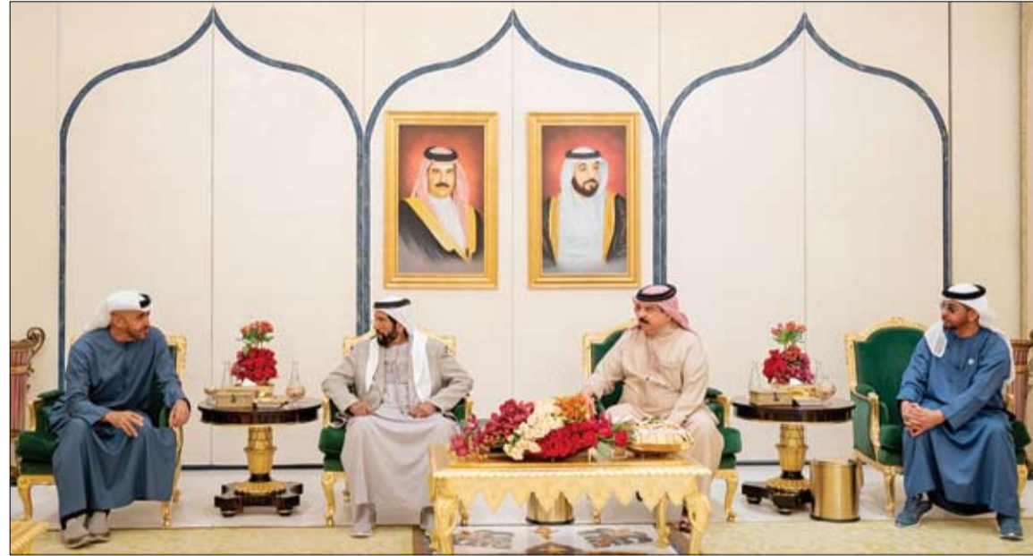
ملك البحرين خلال استقباله محمد بن زايد وحمدان بن زايد وطحنون بن محمد في مقر إقامته في أبو ظبي

من جهة أخرى استقبل صاحب السمو الشيخ محمد بن زايد آل نهيان ولي عهد أبوظبي نائب القائد الأعلى للقوات المسلحة أمس - كلا على حدة - فخامة رستم نور علي مينخانوف رئيس جمهورية تاتارستان الصديقة ومعمالي فلورنس بارلي وزيرة القوات المسلحة في الجمهورية الفرنسية الصديقة.. وذلك على هامش فعاليات اليوم الثاني لعرض ومؤتمر الدفاع الدولي أيدكس 2021. (التفاصيل ص2)