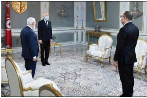
أزمة ثلاثية الأبعاد

وقال الدبلوماسيون إنه تم التوصل إلى اتفاق سياسي لفرض عقوبات جديدة محددة خلال الاجتماع، وتم تكليف وزير خارجية الاتحاد جوزيب بوريل اقتراح لائحة أسماء مسؤولين روس لفرض عقوبات عليهم لكن من غير المرتقب أن تشمل أيًا من الأثرياء النافذين.