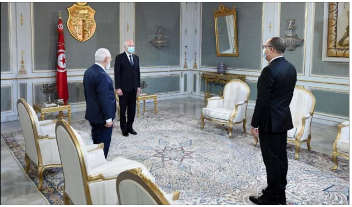
ازمة ثلاثية الابعاد