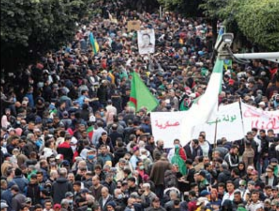
مظاهرات حاشدة في العاصمة الجزائرية

بشرق البلاد التي أصبحت تُعرف بحراك، واحتفلت في 16 فبراير بتظاهرات حاشدة، وكان الحراك اضطر إلى تعليق تظاهراته الأسبوعية في مارس بسبب انتشار فيروس كورونا وقرار السلطات منع كل التجمعات. واستقبلت السلطات التظاهرات، ووجد سكان العاصمة، خصوصا في وسط العاصمة بسبب الازدحام الكبير جراء الحواجز الأمنية على مداخل المدينة خصوصا من الناحية الشرقية، على أكد شهود عيان. وانتشرت على مواقع التواصل الاجتماعي دعوات للتظاهر في