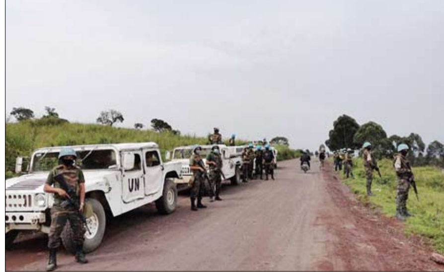
دوريات أمنية تابعة لبعثة الأمم المتحدة في الكونغو عقب الهجوم الارهابي

كما أعربت الوزارة عن خالص تعازيها ومواساتها لذوي الضحايا، جراء هذه الجريمة التكررة. وفي روما أكدت وزارة الخارجية الإيطالية الاثنين مقتل سفيرها لدى جمهورية الكونغو