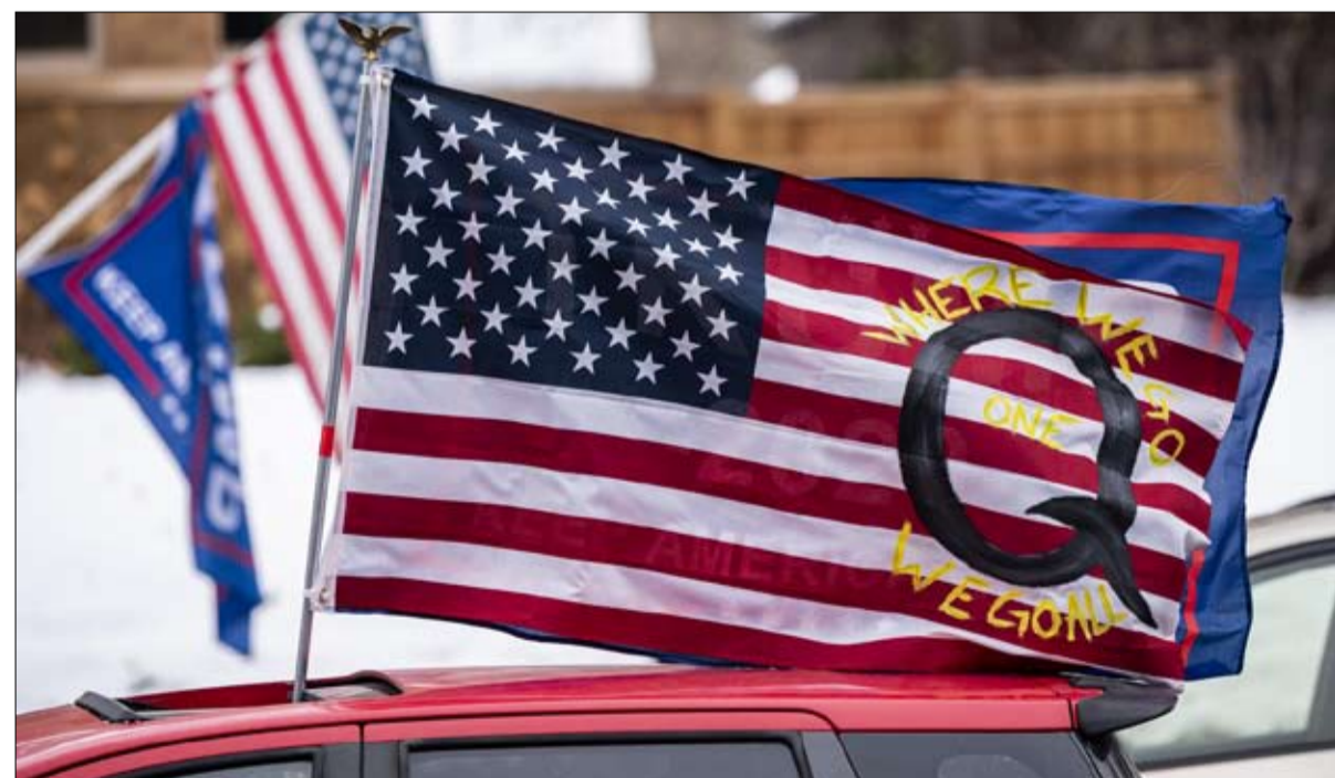
نظرية المؤامرة ستبقى بعد ترامب

وفي انتظار 4 مارس، تتم مواصلة دعم نظرية التزوير الانتخابي الهائل، ويُترك ترامب ومجموعته يستعدون لإحياء الدولة المنحلة عام 1871. قبل ما يقل عن أسبوعين لتحقيق العدالة، ليتم تنظيف سمعة المنقذ، وتوليد الجمهورية من جديد! إذا كنا لا نزال نناقش هذا الأسبوع مستقبل الرئيس المخلوع، يمكننا أن نتوقع أنه بفض النظر عن المسير الذي يخبئه له المستقبل، فإن نظريات المؤامرة ستبقى بعده... لم يخترعها ترامب، لكنه استغلها بمهارة. مزيج من الظروف المواتية جعلت من ترامب بطل المتآمريين، لكنهم سيجدون بديلاً له أسرع من الجمهوريين. «استاذ تاريخ، ومحاضر، وملق سياسي كندي مختص في السياسة والتاريخ الأمريكيين»