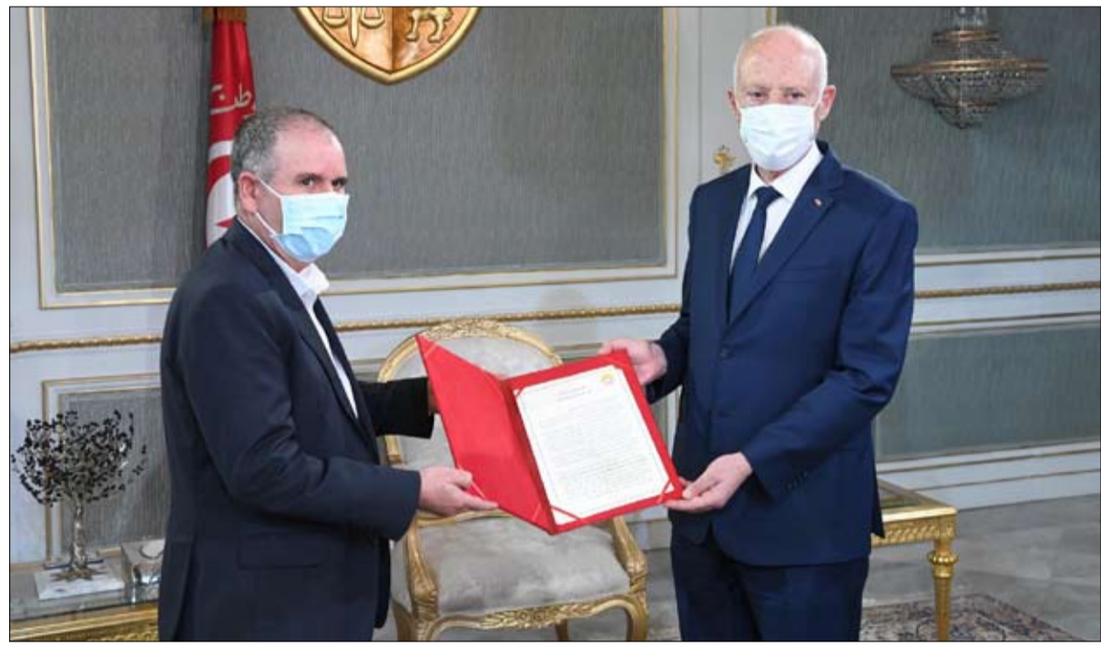
مبادرة الحوار الوطني تنتظر الضوء الاخضر