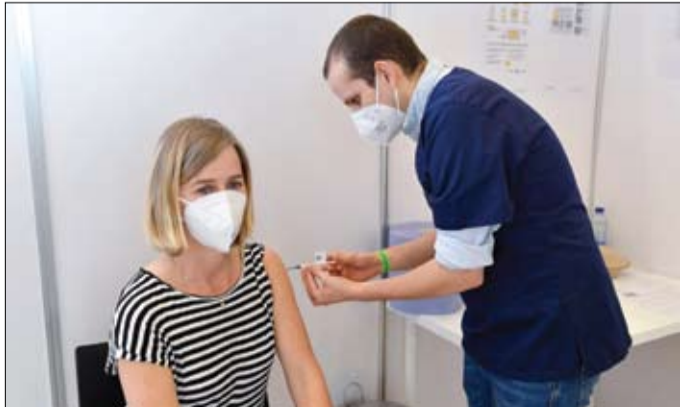
امرأة تتلقى اللقاح في مركز تطعيم اقيم في مطار بروكسل (ا ف ب)

بأعداد ثابتة مع عدم إمكانية الانتقاء بالطلاب الآخرين. يعرض رئيس الوزراء البريطاني بوريس جونسون خطته لإخراج انكلترا من الإغلاق الذي يأمل أن يكون الأخير، مع هدف إعادة فتح المدارس في 8 آذار مارس. بدوره ندد الأمين العام للأمم المتحدة أنطونيو غوتيريش بالبنزعات القومية