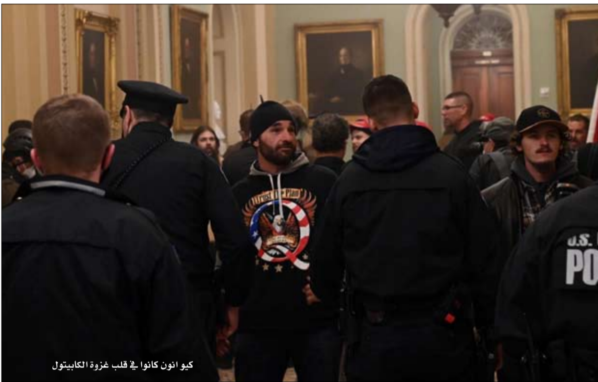
كيو أنون كانوا في قلب غزوة الكابيتول

وحسب "كيو" وأتباعه، كان من المقرر اعتقال جو بايدن والعديد من القادة الديمقراطيين الآخرين من قبل السلطات، وأن الجيش يدعم الرئيس ترامب. الطابع، لم يحدث شيء من هذا القبيل، وبحلول الظهر أصبح جو بايدن الرئيس السادس والأربعين للولايات المتحدة. ولكن أصيبوا في البداية بخيبة أمل وصدمة، تغلب الأتباع على الاكتئاب، وعادوا إلى الهجوم بنظرية أخرى لا تقل إثارة للدهشة. لما كان الشخص المختار أو المنقذ، فإن دونالد ترامب سيؤدي اليمين في مارس المقبل. لذلك تم تأجيل "العاصفة" لبضعة أسابيع فقط. في 4 مارس، سيصبح دونالد ترامب الرئيس التاسع عشر للولايات المتحدة. قد تتساءلون عما وراء هذه النظرية الجديدة. لماذا 4