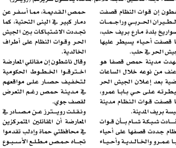
أعضاء لجنة التحقيق التابعة للامم المتحدة يناقشون تقريرهم

الجاري قادمين من الشمال، بينما هاجمت كتائب من ريف حمص مواقع حكومية في حي بابا عمرو واجتاحت قوات الجيش هذا الحي بعد حصار طويل قبل عام وقام الأسد بزيارته في وقت لاحق. الى ذلك افاد تقرير اعدته محققو الامم المتحدة ورفع الاثنان الى مجلس حقوق الانسان ان نظام الرئيس بشار الاسد يستخدم مليشيات وكذلك لجنا شعبة شكلها سكان بعض المناطق لارتكاب مجازر. وجاء في هذا التقرير من عشر صفحات الذي اعدته لجنة تحقيق دولية ومستقلة تابعة للامم المتحدة ان المجازر التي يعتقد ان لجنا شعبة ترتكبها اخذت احيانا منح طائفي. ومعظم مقاتلي المعارضة من السنة في حين ان السلطة في سوريا بايدي علويين. وجاء في التقرير ان المحققين حصلوا على شهادات مترابطة من اشخاص قالوا انهم تعرضوا لضائقات واحيانا واقتوا بشكل تعسفي من قبل افراد في هذه اللجان لانهم قدموا من مناطق تعتبر مؤيدة للثورة. واكد التقرير ان بعض اللجان