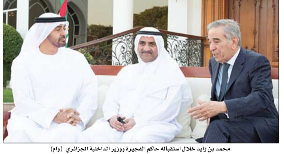
محمد بن زايد خلال استقباله حاكم الفجيرة ووزير الداخلية الجزائري