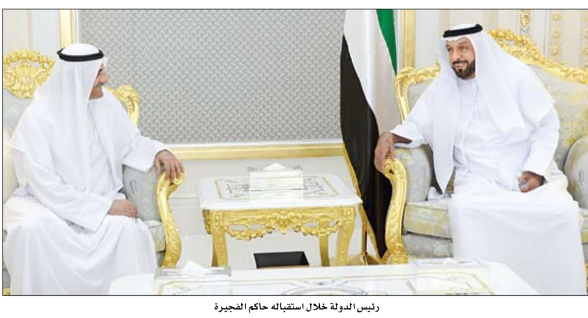
رئيس الدولة خلال استقباله حاكم الفجيرة

استقبل صاحب السمو الشيخ خليفة بن زايد آل نهيان رئيس الدولة حفظه الله أخاه صاحب السمو الشيخ حمد بن محمد الشرقي عضو المجلس الأعلى حاكم الفجيرة يرافقه سمو الشيخ محمد بن حمد بن محمد الشرقي ولي عهد الفجيرة وذلك بقصر الروضة بمدينة العين ظهر امس.