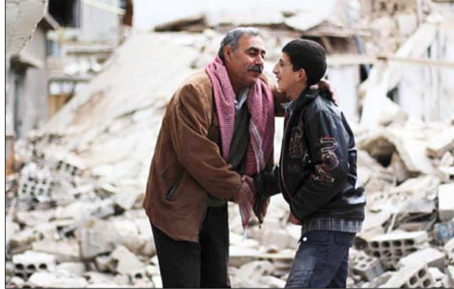
رجل سوري وشاب يهتنان بعضهما بالنجاح عقب قصف قرب منزلهما في ضواحي دمشق

جددت قوات النظام السوري امس الأربعاء قصفها لمناطق عدة في البلاد بالأسلحة الثقيل والطيران الحربي، وكان أبرز العمليات سقوط صاروخ بريف حمص أدى إلى مقتل تسعة على الأقل وجرح آخرين. فقد قالت شبكة شام إن تسعة قتلى، بينهم ثلاثة أطفال، وعدد كبير من الجرحى سقطوا إثر سقوط صاروخ أرض-أرض في بلدة البويضة الشرقية بريف حمص الجنوبي على أحد الملاجئ بالقربية كان يؤوي لنازحين. وأفاد ناشطون بأن قوات النظام أطلقت صاروخ أرض أرض على الملجأ مما تسبب أيضا بإصابة أكثر من عشرين شخصا.