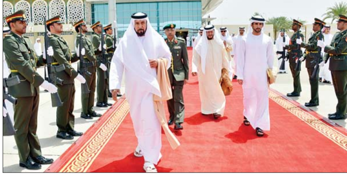
رئيس الدولة خلال مغادرته الى الخارج في زيارة خاصة