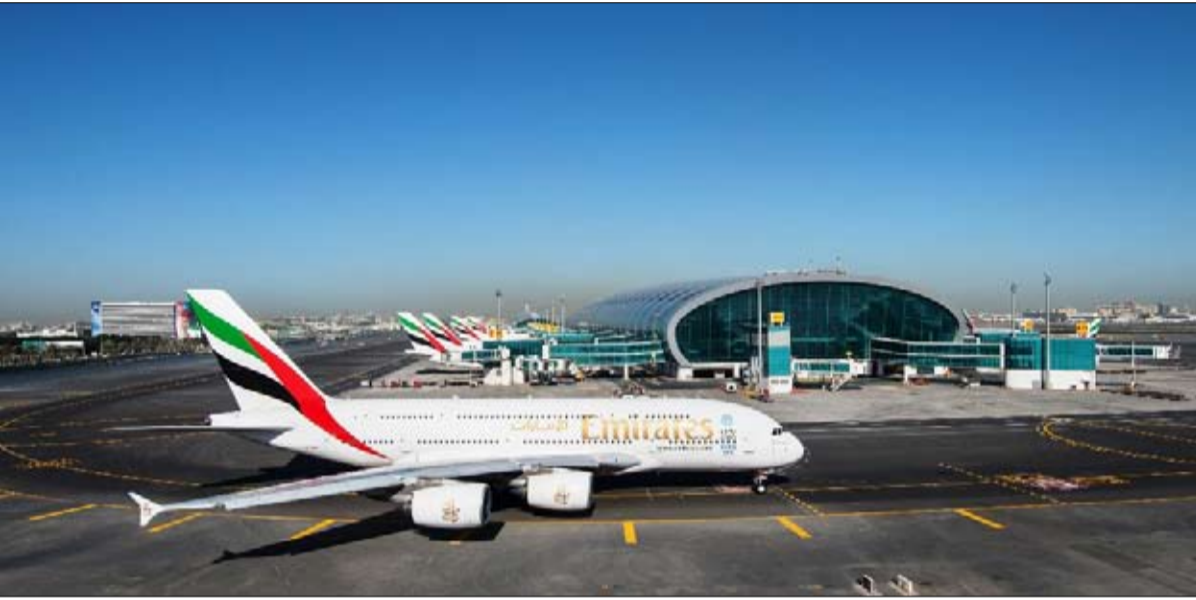
وأضاف غريفيث بقوله، وفقاً لسجل طلبيات طيران الإمارات لشراء الطائرات وخطة توسعنا بالمرتبة الأولى لعمليات طائرات إيرباص من طراز أيه 380 في عام 2013 وما بعده .