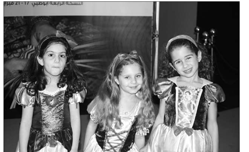
بحضور ورعاية الشبيخة ريم بنت أحمد بن حمدان آل نهيان