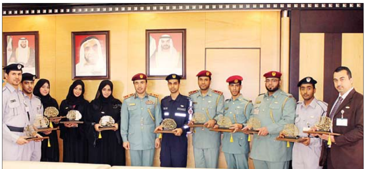
عشر أفكار إبداعية خلال عام.. مؤكداً أن استراتيجية شرطة أبوظبي تتبنى الأفكار الإبداعية المقدمة من منتسبائها وترتك أثراً إيجابياً في تعزيز التطوير لسيرة العمل الشرطي. من جانبهم أعرب الكرمون عن سعادتهم بحصولهم على جائزة الموظف المثالي معاهدتين قيادتنا العليا على مواصلة التميز في خدمة العمل الشرطي. من ناحية أخرى شهد اللواء أحمد ناصر الرئيسي تخريج دورة التفاوض الأمني التي عقدت في نادي ضباط القوات المسلحة واستمرت أسبوعين بمشاركة عدد من