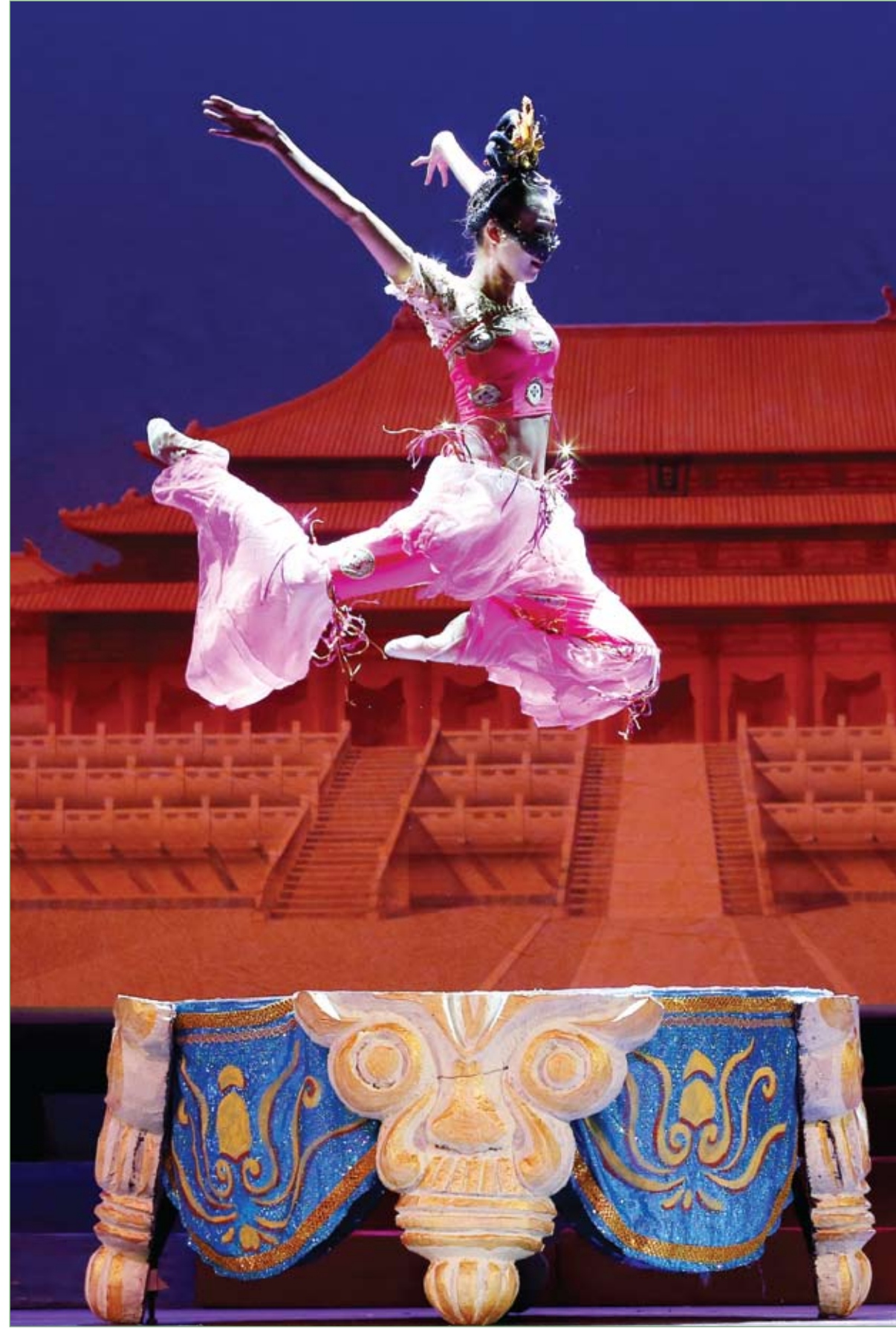
فنانة تقدم رقصة صينية مثيرة خلال بروفة للعرض الأول بعنوان (طريق الحرير) في مسرح ديفيد بمرکز لينكولن في مدينة نيويورك.

توصلت دراسة حديثة إلى أن مواليد الأمهات البدنيات قد يعانون من سمنة في أحد شرايين القلب الرئيسية وذكر موقع هلت دي نيوز العلمي الأمريكي أن باحثين بجامعة سيدني وجدوا أن جدران الشريان الأبهري تكون أسمك عند مواليد الأمهات البدنيات مقارنة بمواليد ذوات الوزن الطبيعي. وتعتبر سمنة هذا الشريان عامل خطر للإصابة بأمراض القلب والشرايين، وبالتالي فقد افترض العلماء أن سمنة الحوامل قد تؤثر على خطر إصابة مواليدهم بأمراض القلب والسكتات الدماغية لاحقاً في حياتهم. وشملت الدراسة 23 امرأة معدل أعمارهن 35 عاماً، وهن بالأسبوع 16 من الحمل. وأنجبت عشر منهن ذكوراً، وتراوح وزن المواليد بين 1.8 و4.3 كيلوغرامات.