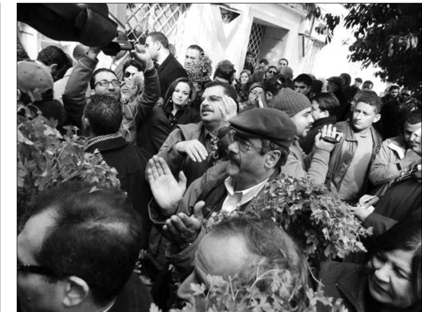
إقبال جماهيري كبير