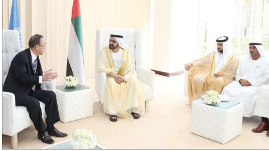
مجموعة طيران الإمارات ومعالي الدكتور أنور محمد قرقاش وزير الدولة للشؤون الخارجية ومعالي محمد إبراهيم الشيباني مدير عام دائرة التشريقات والضيفة في دبي وعدد من المسؤولين والوفد الأممي المرافق للضيف.

الصد أن دولة الإمارات تدعم محادثات السلام بين إسرائيل والفلسطينيين وتدعم الجهود الدولية الرامية إلى تحريك هذا المسار وإقرار الحقوق الفلسطينية المشروعة والمتملة في إقامة دولته المستقلة على تراب أرضه. كما أشاد أمين عام الأمم المتحدة ببرامج تمكين المرأة في الإمارات وإشراكها في المسيرة التنموية الشاملة التي تشهدها الدولة في كل الاتجاهات والقطاعات واعتبر السيد بان كي مون دولة الإمارات