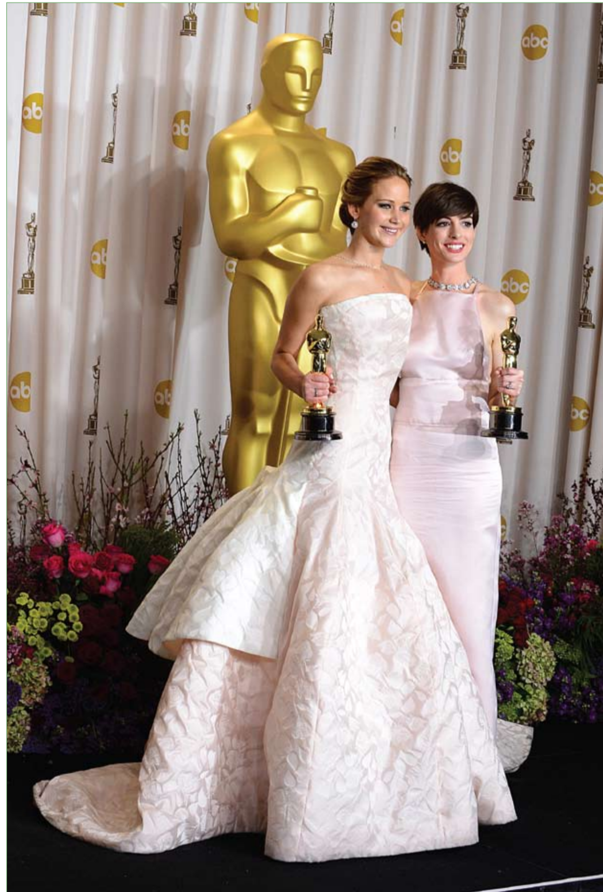
الممثلتان جينيفر لورنس وأن هاتاواي تحلمان جازنيتيها وراء الكواليس خلال حفل توزيع جوائز الأوسكار في هوليوود.

استجاب الطفل عمر الذي ينتمي إلى منطقة ريفية في محافظة حجة غرب اليمن، لكلام والدته بالذهاب لرعي الأغنام، ولكنه كان قد عقد العزم على الانتحار، حزناً على الحمامة الضائعة.