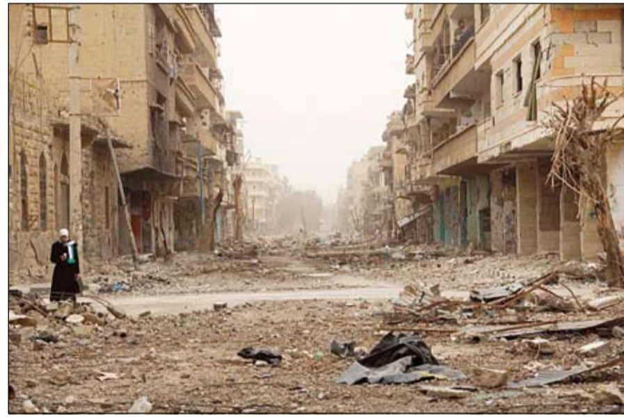
امرأة تتوشح بعلم المعارضة وتأهب لمغادرة محافظة دير الزور المدمرة

عنيف، وطلب المظاهرات بفك الحصار ورحيل النظام، كما طالبوا المجتمع الدولي بحمل مسؤولياته ازاء ما يتعرض له المدنيين. وقالت المفوضية إن عدد اللاجئين السوريين الفارين من بلادهم ارتفع بشكل كبير منذ بداية العام، موضحة أن أكثر من 400 ألف شخص تحولوا إلى لاجئين منذ كانون الثاني يناير 2013 وهم يعانون من صدمات نفسية وليس لديهم ممتلكات ويعد أن فقدوا أفرادا من أسرهم. وأضافت أن ما يقرب من نصف عدد اللاجئين من الأطفال، غالبيتهم تحت سن الحادية عشرة.