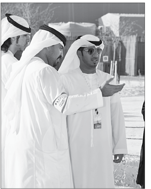
تتعلق بتاريخ القصر وتأثيره في الحياة السياسية والاقتصادية أبو ظبي.

الراغبين في التعرف على المزيد عن تراثهم وتاريخهم الوطني. جدير بالذكر أن فعاليات مهرجان قصر الحصن تستمر في الفترة من 28 فبراير إلى 9 مارس 2013، كاحتفال وطني بالتاريخ والتراث الإماراتي. فضلا عن تضمنه لأحد أروع العروض الاستعراضية بعنوان قصة حصن، مجد وطن، وكذلك معرض قصر الحصن الذي يستعرض الفصول التاريخية للقلعة البيضاء، بالإضافة إلى ورش العمل التفاعلية والفعاليات الترفيهية والأنشطة التي تناسب كل أفراد الأسرة، وكذلك فعالية منتدى قصر الحصن التي تتكون من سلسلة من الجلسات الحوارية التي ستتناول بالحوار والنقاش مختلف العناوين التي