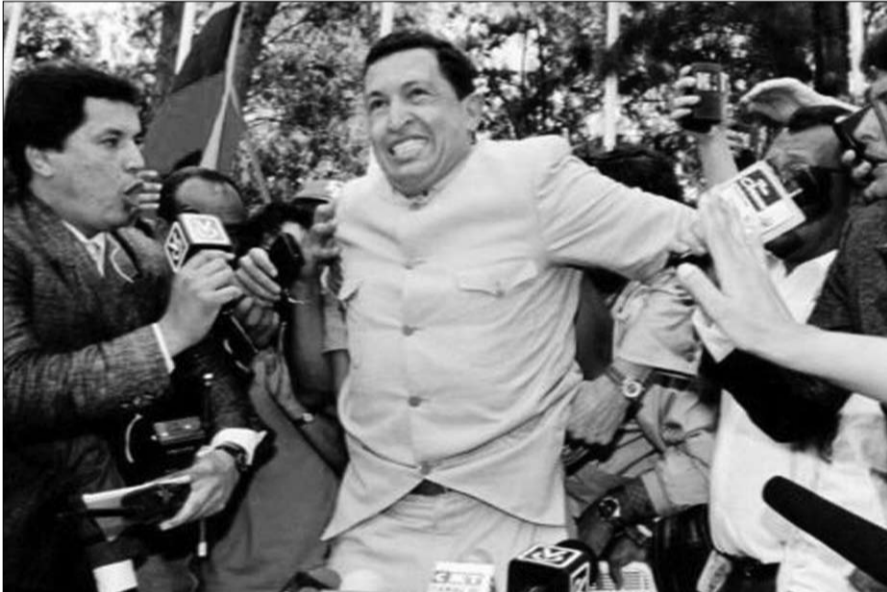
بعد اطلاق سراحه من السجن

للديمقراطية والمدافع عن حقوق المستضعفين والشعوب الاصلية. أنها مفارقة تاريخية حقيقية تحول الليبريتادور إلى مناضل شبه ماركسي، 24 جويلية 1983، وفي الذكرى المئوية الثانية لولادة ذاك البطل الوطني، أسس هوغو شافيز في صلب الجيش الحركة الثورية البوليفارية 200 . وبعد إعداد طويل، قامت الحركة بإغتيالها أخيرا، في 4 فيفري 1992، حيث ثارت عديد الثكنات في جميع أنحاء البلاد. ومن المفارقات، فإن فيدل كاسترو، احد النماذج الكبيرة التي يعجب بها هوغو شافيز، كان صاحب مشروع سياسي وشعر أنّ ساعته لم تحن بعد.