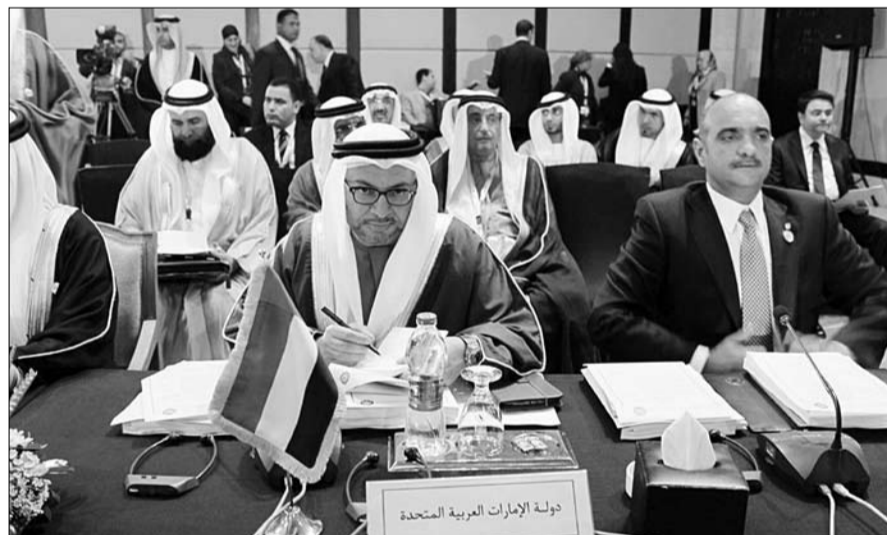
بالقاهرة ومندوبها الدائم لدى الجامعة العربية وسعادة الدكتور طارق الهيدان مساعد وزير الخارجية للشؤون السياسية وسكرتير ثالث بسفارة الدولة بالقاهرة.