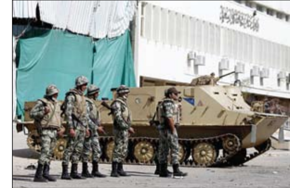
الجيش يحمي مبنى محافظة بور سعيد