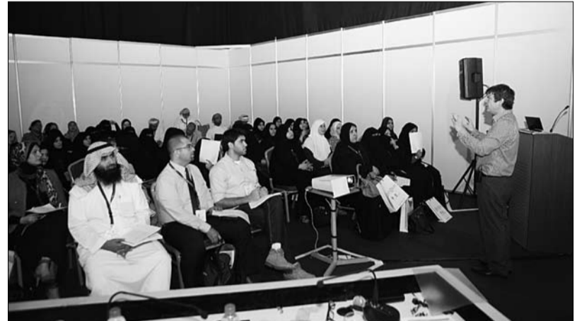
منتدى التعليم العالمي يواصل فعالياته