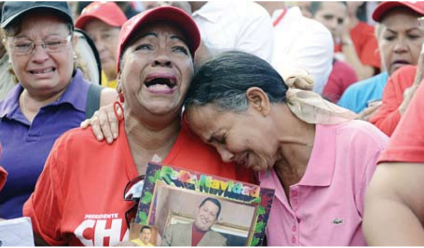
قراء فنزويلا يبكون نصيرهم شافيز

أعلنت أمس الصفحة الرسمية لكتلة حركة النهضة على موقع التواصل الاجتماعي الفيسبوك، استقالة أبو يعرب المرزوقي من المجلس الوطني التأسيسي، وذلك لأسباب شخصية. يذكر أن أبو يعرب شغل أيضا، الى جانب عضويته في المجلس، منصب وزير مستشار للشؤون الثقافية لدى رئيس الحكومة المستقل حمادي الجبالي. وقال أمس الأربعاء الفيلسوف التونسي والقيادي في حركة النهضة المستقل أبو يعرب المرزوقي على أن أكبر عيب وقع فيه الحزب الإسلامي الذي يحكم تونس بعد الثورة (وقد يكون الأمر نفسه حصل في مصر) هو أنه يعمل بعكس المبادئ المتتمثلة بحسب أبو يعرب في تحرير جهاز الدولة من الاحتكار الحزبي واعتماد مبدأ المساواة بين المواطنين في شغل الوظائف باستثناء الوظائف التي تتبع الحكم في بعده السياسي المتغير بمقتضى التداول. وأكد أبو يعرب المرزوقي القادي في حركة النهضة في مقال نشره على صفحته الخاصة بالفيسبوك وحفلها عنون ما يحصل لا يبشر بخير. (التفاصيل ص10)