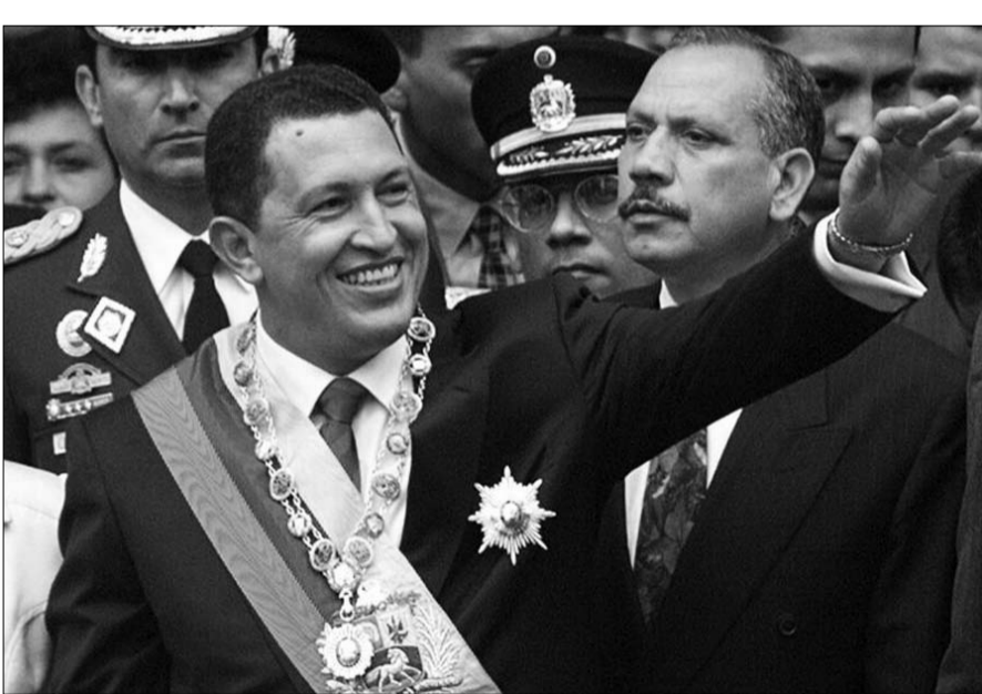
تشافيز رئيسا عام 1999

الذي يمكن أن نعلنه لشعبنا اليوم 5مارس على الساعة الرابعة و25 دقيقة، توفّي قائدنا الرئيس هوغو شافيز فرياس . بيروي صديق طفولته، فيديريكو رويج، هذه الطرفة: عام 1983، خرجنا معا للنزهة، مع زوجة روم، قال لي: هل تعرف شيئا؟ سيأتي يوم أصبح فيه رئيسا للجمهورية. فأجبتُه ما زنا إذا ستعيني وزيراً.. ولكنني أدركت انه كان يتحدث بجد. ولد 28 جويلية 1954، ويحدد عام 1977، رؤيته لمحصره في دفتر مذكراته؛ لا بد أن أعد نفسي للتحرك.. إن شعبي حامل وسلي.. الشروط والظروف لم تتوفر بعد فلماذا لا أحلقها.. وفعلا، كانت البلاد عام 1977 تشهد حالة استقرار سياسي وازدهار اقتصادي تجعل من باب