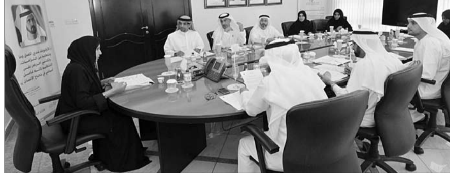
العمل وعلى التطور التقني الذي تشهده مؤسسة صندوق الزواج في جميع إجراءات العمل. يذكر أنه تم تصميم وبرمجة النظام

ترأست معالي الدكتورة ميثاء سالم الشامي وزيرة دولة رئيسة مجلس إدارة صندوق الزواج، اجتماع مجلس إدارة الصندوق الجلسة الأولى لعام 2013 وذلك بحضور أصحاب السعادة أعضاء المجلس في مقر الصندوق بأبوظبي. واعتمد المجلس خلال اجتماعه مشروع جدول الأعمال كما تم اعتماد تقرير لجنة جرد الموجودات الخاصة بالصندوق لعام 2012 والذي جاء وفقاً للإجراءات المالية الموحدة للحكومة الاتحادية. وأثنى أعضاء المجلس على دور لجنة الجرد في تطبيق النظام الإلكتروني الجديد في عملية الجرد والذي تم تطويره لتلبية احتياجات