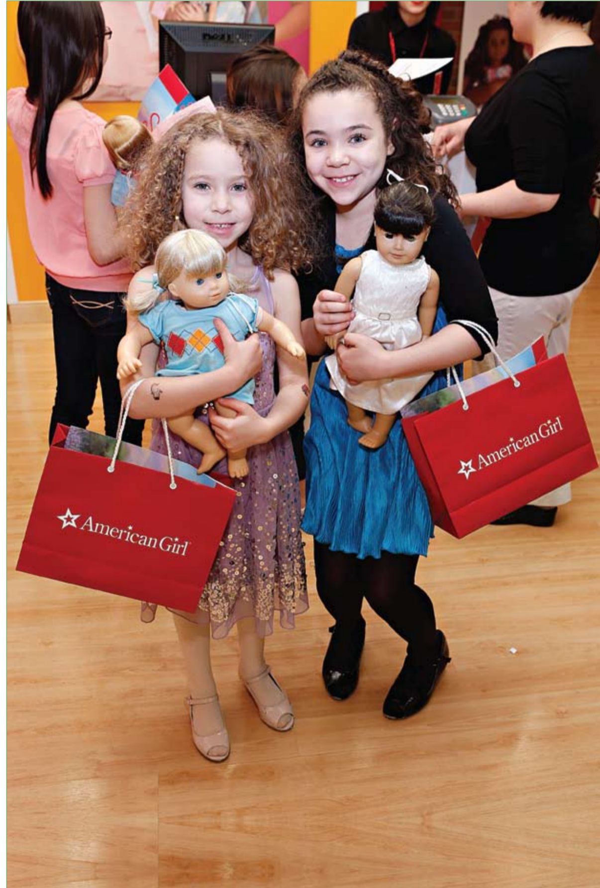
طفلتان تحملان دميتين خلال فعالية خيرية بمؤسسة السرطان والدم لجمع تبرعات بمتجر البنت الأمريكية في مدينة نيويورك.

كم هي رائعة هذه الطفلة .. بهذه التفرقة التي كتبتها نانسي عجرم على حسابها بموقع تويتر عبرت النجمة اللبنانية عن رأيها في طفلة يبدو من ملامحها أنها أندونيسية ، قلدت إحدى أغنياتها. الطفلة كما يبدو بالفديو لا تكتف فقط بحفظ كلمات أغنية نانسي، رغم أنها ليست عربية، لكنها أيضا تقلد حركاتها بعفوية وخفة ظل.. وأتم.. كيف ترون أداء الطفلة.. هل تتفقون مع رأي نانسي ؟