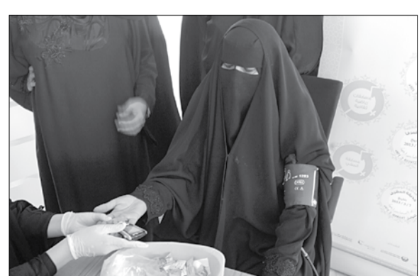
مركز فرح المرفأ. وياتي المهرجان تزامنا مع هذه المناسبة العالمية للتأكيد على دور

جنب شريكها الاب. واشتمل المهرجان على مسابقة رياضية للمشي شارك فيها المدارس بمركز تعليم الكبار وطالبات معهد بينونة للعلوم والتكنولوجيا وطالبات مدرسة المرفأ المشتركة كما اشتمل المهرجان على فترة إرشادات صحية تناولت اهمية شرب الماء وضرورة حرص السيدات على المحافظة على الفص لتجنب مخاطر المرض بالإضافة إجراء فحص للسيدات عن مرض السكرى وضغط الدم بمشاركة مستشفى النور واشرف على فعاليات المهرجان فريق عمل مركز المؤسسة بالمرأ.