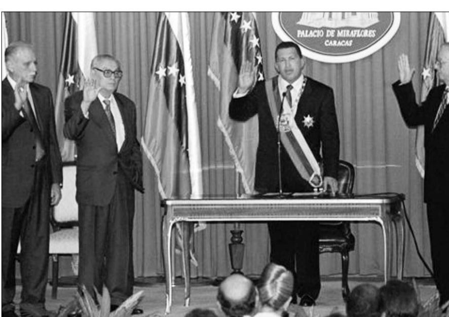
تشافيز يؤدي اليمين فبراير 1999

فاز بالرئاسة ب 56 بالمئة من الأصوات، وأدى القسم 2 فيفري 1999، والترّم بأنه سيقوم بالتحوّل الديمقراطي المطلوب ونظّم بعد ذلك سلسلة من وتم عزل الرئيس بيريز عام 1993 بتهمة نهب الأموال العامة. اتّجه إلى وزارة الدفاع وألقى سلاحه. طلبت منه السلطات ان يلقي خطبا تلفزيونيا يدعو فيه رفاقه للاستسلام. كان من المفترض مراقبة الرسالة قبل بثّها، ولكن لضيق الوقت، تم تسجيلها دون إعداد، وانتزع هوغو تشافيز الفرصة ليقول: رفاقي، للأسف، عرفت الأهداف التي رسمناها فشلا ذريعا، في الوقت الراهن، في العاصمة . في الوقت الراهن، وعندما تولى الرئاسة لاحقا، جعل من 4 فيفري، يوم الكرامة الوطنية.