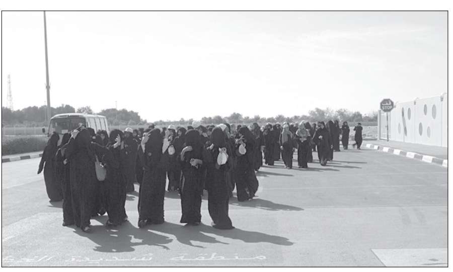
مركز المؤسسة بالمرأ.

جنب شريكها الاب. واشتمل المهرجان على مسابقة رياضية للمشي شارك فيها المدارس بمركز تعليم الكبار وطالبات معهد بينونة للعلوم والتكنولوجيا وطالبات مدرسة المرفأ المشتركة كما اشتمل المهرجان على فترة إرشادات صحية تناولت اهمية شرب الماء وضرورة حرص السيدات على المحافظة على الفص لتجنب مخاطر المرض بالإضافة إجراء فحص للسيدات عن مرض السكرى وضغط الدم بمشاركة مستشفى النور واشرف على فعاليات المهرجان فريق عمل مركز المؤسسة بالمرأ.