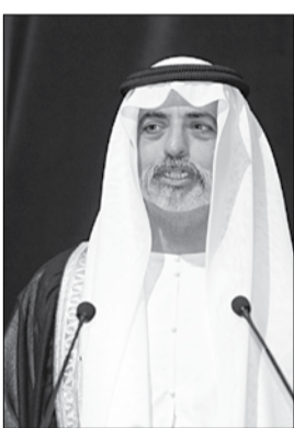
الشيخ نهيان بن مبارك

الله الشيخ زايد بن سلطان آل نهيان طيب الله ثراه اقام مشاريع الرعاية الاجتماعية في جميع أنحاء باكستان واعتبر باكستان وطنه الثاني.. واصبحت منهجا لصاحب السمو الشيخ خليفة بن زايد آل نهيان حفظه الله لمساعدة فئات المجتمع الباكستاني.. من جانبه قال سعادة عيسى عبدالله الباشة النعمي ان اقامة المشاريع التنموية والرعاية الاجتماعية تنشر في جميع أنحاء باكستان بناء على مبادرات وتوجيهات صاحب السمو الشيخ خليفة بن زايد آل نهيان رئيس الدولة حفظه الله.. مؤكدا عمق العلاقات الراضية بين البلدين.. وأشار الى ان هذه المشاريع تلامس احتياجات الاهالي