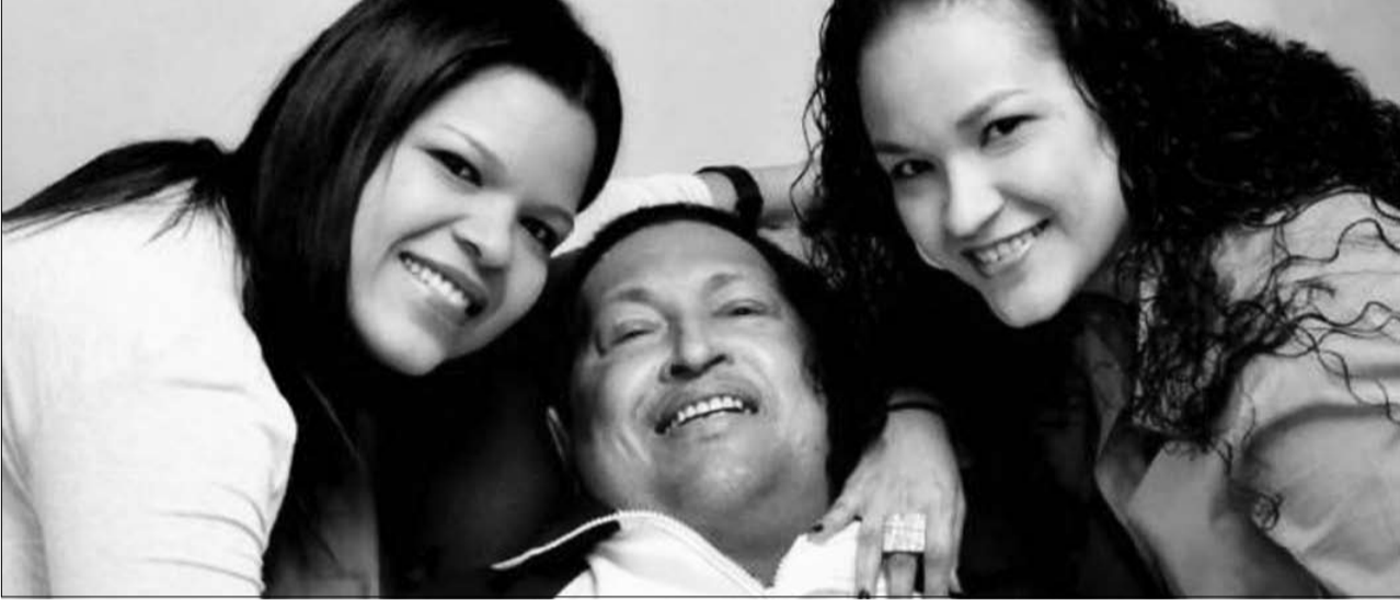
تشافيز مع ابنتيه وهو على غشاء المرض