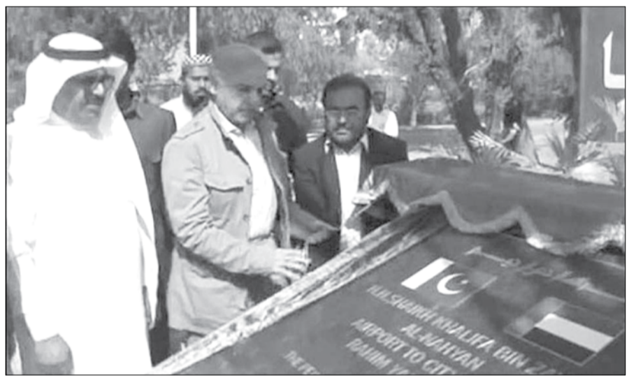
المالي مساعدتها في التغلب على الصعوبات التي تواجهها.. وقال شهباز شريف أن الغفور له بإذن

بمركز خليفة للرعاية الصحية ومدرسة خليفة للعلوم الصحية المساعدة ومعهد خليفة للتدريب المهني ومجمع خليفة الرياضي وحسب خليفة في دوار داري سانغي وتوسيع الطريق الممتد من الدوار والطريق المؤدي إلى جامعة العلامة اقبال المفتوحة والحرم الجامعي ومنتزها عالمياً ومشروع الصراف الصحي.. وقال رئيس حكومة البنجاب شهباز شريف للصحفيين ان سكان البنجاب مدينون لصاحب السمو الشيخ خليفة بن زايد آل نهيان رئيس الدولة حفظه الله.. فقد قام سعادة محمد شهباز شريف رئيس حكومة البنجاب وسعادة السفير عيسى عبدالله الباشة النعمي سفير الدولة لدى جمهورية باكستان الإسلامية بافتتاح عدد من المشاريع التنموية والتعليمية والصحية والمرافق الحيوية في مدينة رحيم يار خان. وشملت هذه المشاريع مدرسة خليفة العامة والقاعة المحقة